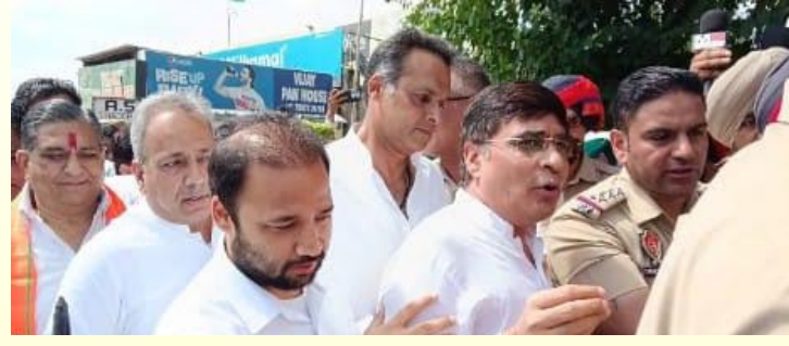
ਜ਼ਬਰਦਸਤੀ ਬੈਰੀਅਰ ਹਟਾ ਦਿੱਤਾ... ਮੁੱਲਾਂਪੁਰ ਨਵਾਂ ਚੰਡੀਗੜ੍ਹ ਅਤੇ ਸ਼ਿੰਗਾਰੀਵਾਲਾ-ਚੰਡੀਗੜ੍ਹ ਚੌਕ 'ਤੇ ਹੋਈਆਂ ਗ੍ਰਿਫ਼ਤਾਰੀਆਂ ਨੂੰ ਲੋਕਤੰਤਰ ਦਾ