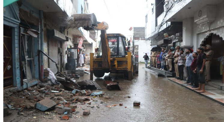
ਕਾਰਵਾਈ ਡਰੱਗ ਮਾਫੀਆ ਲਈ ਇੱਕ ਸਖ਼ਤ ਸੰਦੇਸ਼ ਹੈ। ਉਨ੍ਹਾਂ ਕਿਹਾ ਕਿ ਨਸ਼ਾ ਤਸਕਰਾਂ ਦੀਆਂ ਗੈਰ-ਕਾਨੂੰਨੀ ਜਾਇਦਾਦਾਂ ਢਾਹ ਕੇ ਨਾ ਸਿਰਫ਼ ਕਾਨੂੰਨ ਦੀ ਪਾਲਣਾ ਕਰਵਾਈ ਜਾ ਰਹੀ ਹੈ ਸਗੋਂ ਆਸ-ਪਾਸ ਦੇ ਇਲਾਕਿਆਂ ਨੂੰ ਨਸ਼ੀਲੇ ਪਦਾਰਥਾਂ ਦੇ ਚੰਗੁਲ ਤੋਂ ਮੁਕਤ ਵੀ ਕਰਵਾਇਆ ਜਾ ਰਿਹਾ ਹੈ। ਉਨ੍ਹਾਂ ਕਮਿਸ਼ਨਰੇਟ ਪੁਲਿਸ ਦੀ ਨਸ਼ਿਆਂ ਦੇ ਨੈੱਟਵਰਕ ਨੂੰ ਪੂਰੀ ਤਰ੍ਹਾਂ ਖ਼ਤਮ ਕਰਨ ਦੀ ਵਚਨਬੱਧਤਾ ਦੁਹਰਾਉਂਦਿਆਂ ਨਾਗਰਿਕਾਂ ਨੂੰ ਸਰਕਾਰ ਵੱਲੋਂ ਜਾਰੀ ਵਟਸਐਪ ਨੰਬਰ 9779-100-200 ਰਾਹੀਂ ਨਸ਼ਿਆਂ ਨਾਲ ਸਬੰਧਤ ਜਾਣਕਾਰੀ ਸਾਂਝੀ ਕਰਨ ਦੀ ਅਪੀਲ ਕੀਤੀ