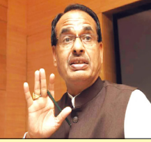
ਨੇ 'ਐਕਸ' 'ਤੇ ਆਪਣਾ ਅਨੁਭਵ ਸਾਂਝਾ ਕੀਤਾ

ਭੋਪਾਲ, ਲੋਕ ਬਾਣੀ-ਕੇਂਦਰੀ ਖੇਤੀਬਾੜੀ ਮੰਤਰੀ ਸ਼ਿਵਰਾਜ ਸਿੰਘ ਚੌਹਾਨ ਨੇ ਸ਼ਨਿੱਚਰਵਾਰ ਨੂੰ ਟੁੱਟੀ ਅਤੇ ਦਬੀ ਸੀਟ ਅਲਾਟ ਕਰਨ ਲਈ ਨੂੰ ਏਅਰ ਇੰਡੀਆ ਦੀ ਨਿੰਦਾ ਕੀਤੀ। ਉਨ੍ਹਾਂ ਇਸਨੂੰ ਅਨੈਤਿਕ ਕਰਾਰ ਦਿੰਦਿਆਂ ਕਿਹਾ ਏਅਰਲਾਈਨ ਯਾਤਰੀਆਂ ਤੋਂ ਪੂਰਾ ਕਿਰਾਇਆ ਵਸੂਲਦੀ ਹੈ ਅਤੇ ਫਿਰ ਉਨ੍ਹਾਂ ਨੂੰ ਨੁਕਸਾਨੀਆਂ ਸੀਟਾਂ 'ਤੇ ਬੈਠਣ ਲਈ ਮਜਬੂਰ ਕਰਦੀ ਹੈ। ਚੌਹਾਨ