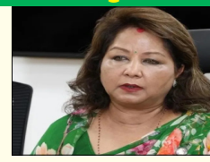
ਵਿਦਿਆਰਥੀਆਂ ਨਾਲ ਬਦਸਲੂਕੀ ਕਰਨ ਵਾਲੇ ਦੇ ਮੁਅੱਤਲ ਸਟਾਫ਼ ਨੂੰ ਨੌਕਰੀ ਤੋਂ ਬਰਖਾਸਤ ਕਰਨ ਦੀ ਮੰਗ ਵੀ ਕੀਤੀ।