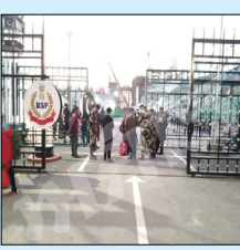
ਰਿਹਾਅ ਕਰ ਦਿੱਤਾ ਗਿਆ ਹੈ।

ਅਟਾਰੀ, ਲੋਕ ਬਾਣੀ- ਭਾਰਤ-ਪਾਕਿਸਤਾਨ ਦੇਸ਼ਾਂ ਦਰਮਿਆਨ ਹੋਏ ਸਮਝੌਤਿਆਂ ਤਹਿਤ ਅੱਜ ਪਾਕਿਸਤਾਨ ਨੇ ਆਪਣੀਆਂ ਵੱਖ-ਵੱਖ ਜੇਲ੍ਹਾਂ ਵਿੱਚ ਬੰਦ 22 ਗਵਾਂਢੀ ਮੁਲਕ ਦੇ ਕੈਦੀਆਂ ਨੂੰ ਅੱਜ ਦੇਰ ਰਾਤ ਪਾਕਿਸਤਾਨ ਤੋਂ ਅਟਾਰੀ ਸਰਹੱਦ ਰਸਤੇ ਭਾਰਤ ਲਈ