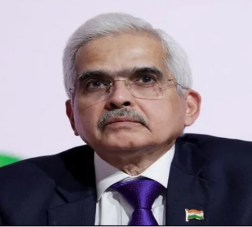
ਸੇਵਾਵਾਂ ਨਿਭਾਅ ਰਹੇ ਹਨ।