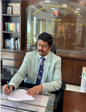
ਐਸ. ਏ. ਐਸ. ਨਗਰ ਵਿਖੇ ਬਿਊਰੋ ਦੇ ਮੁੱਖ ਦਫਤਰ ਵਿਖੇ ਵਿਜੀਲੈਂਸ ਬਿਊਰੋ ਦੇ ਸਾਰੇ ਐਸ. ਐਸ. ਪੀ.ਜੀ. ਦੀ ਇੱਕ ਮੀਟਿੰਗ ਬੁਲਾ ਲਈ ਹੋ ਤਾਂ ਜੋ ਸਾਰੇ ਲੇਬਿਓ ਕੇਸਾਂ ਅਤੇ ਵਿਜੀਲੈਂਸ ਪੜਤਾਲਾਂ ਦੀ ਸਮੀਖਿਆ ਕੀਤੀ ਜਾ ਸਕੇ।