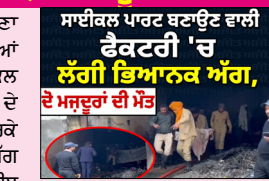
ਦੋ ਅੰਦਰ ਹੀ ਫਸ ਗਏ, ਜਿਨ੍ਹਾਂ ਦੀ ਝੁਲਸਣ ਕਰਕੇ ਮੌਤ ਹੋ ਗਈ। ਪੁਲਿਸ ਮਾਮਲੇ ਦੀ ਜਾਂਚ ਕਰ ਰਹੀ ਹੈ।

ਲੁਧਿਆਣਾ ਲੋਕ ਬਾਣੀ ਲੁਧਿਆਣਾ ਦੇ ਗਿੱਲ ਰੋਡ ਸਥਿਤ ਕਲਸੀਆਂ ਵਾਲੀ ਗਲੀ ਦੇ ਅੰਦਰ ਇਕ ਸਾਈਕਲ ਪਾਰਟ ਬਣਾਉਣ ਵਾਲੀ ਫੈਕਟਰੀ ਦੇ ਵਿੱਚ ਅਚਾਨਕ ਅੱਗ ਲੱਗਣ ਕਰਕੇ ਦੋ ਮਜ਼ਦੂਰਾਂ ਦੀ ਮੌਤ ਹੋ ਗਈ। ਅੱਗ ਅੱਜ ਲਗਭਗ 10:30 ਵਜੇ ਦੇ ਕਰੀਬ ਲੱਗੀ, ਜਿਸ ਵੇਲੇ ਮਜ਼ਦੂਰ ਅੰਦਰ ਕੰਮ ਕਰ ਰਹੇ ਸਨ। ਇਕ ਮਜ਼ਦੂਰ ਨੂੰ ਤਾਂ ਬਚਾ ਲਿਆ ਗਿਆ ਜਦੋਂ ਕਿ