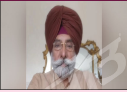
ਰੱਖਣ ਲਈ ਦ੍ਰਿੜ ਸਨ, ਉਨ੍ਹਾਂ ਤੇ ਮਾਨਸਿਕ ਦਬਾਅ ਐਨਾ ਵਧ ਗਿਆ ਕਿ ਅਸਤੀਫ਼ਾ ਦੇਣ ਲਈ ਮਜਬੂਰ ਹੋਣਾ ਪਿਆ। ਉਨ੍ਹਾਂ ਗਿਆਨੀ ਹਰਪ੍ਰੀਤ ਸਿੰਘ ਸੰਬੰਧੀ ਕਿਹਾ ਕਿ ਉਨ੍ਹਾਂ ਵਿਚੋਂ ਪੰਥ ਦਾ ਭਵਿੱਖ ਨਜ਼ਰ ਆ ਰਿਹਾ ਹੈ।