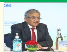
ਚੋਣ ਕਮਿਸ਼ਨਰ ਵਜੋਂ ਇਸ ਸਾਲ ਬਿਹਾਰ ਅਸੈਂਬਲੀ ਚੋਣਾਂ ਤੇ ਅਗਲੇ ਸਾਲ ਕੇਰਲਾ ਤੇ ਪੁੱਡੁਚੇਰੀ ਅਸੈਂਬਲੀ ਚੋਣਾਂ ਦਾ ਪ੍ਰਬੰਧ ਦੇਖਣਗੇ।

ਨਵੀਂ ਦਿੱਲੀ ਲੋਕ ਬਾਣੀ- ਚੋਣ ਕਮਿਸ਼ਨਰ ਗਿਆਨੇਸ਼ ਕੁਮਾਰ ਨੂੰ ਸੋਮਵਾਰ ਰਾਤੀਂ ਦੇਸ਼ ਦਾ 26ਵਾਂ ਮੁੱਖ ਚੋਣ ਕਮਿਸ਼ਨਰ ਨਿਯੁਕਤ ਕੀਤਾ ਗਿਆ ਹੈ। ਕਾਨੂੰਨ ਮੰਤਰਾਲੇ ਨੇ ਇਸ ਦੀ ਪੁਸ਼ਟੀ ਕੀਤੀ ਹੈ। ਕੁਮਾਰ ਦਾ ਕਾਰਜਕਾਲ 26 ਜਨਵਰੀ 2029 ਤੱਕ ਹੋਵੇਗਾ। 1989 ਬਚ ਦੇ ਹਰਿਆਣਾ ਕੇਂਦਰ ਦੇ ਆਈਏਐਸ ਅਧਿਕਾਰੀ ਵਿਵੇਕ ਜੋਸ਼ੀ ਨੂੰ ਚੋਣ ਕਮਿਸ਼ਨਰ ਨਿਯੁਕਤ ਕੀਤਾ ਗਿਆ ਹੈ। ਜੋਸ਼ੀ ਇਸ ਵੇਲੇ ਹਰਿਆਣਾ ਵਿੱਚ ਮੁੱਖ ਸਕੱਤਰ ਦੇ ਅਹੁਦੇ 'ਤੇ ਤਾਇਨਾਤ ਹਨ। ਗਿਆਨੇਸ਼ ਕੁਮਾਰ 26ਵੇਂ ਮੁੱਖ