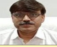
ਜਿੱਥੇ ਉਹ ਏਡੀਸੀ ਵਜੋਂ ਕੰਮ ਕਰਦੇ ਰਹੇ ਹਨ।