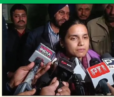
ਭਾਰਤੀ ਨਾਗਰਿਕਾਂ ਦੇ ਵਿੱਚ ਕੁਝ ਖੱਚੇ ਵੀ ਸ਼ਾਮਲ ਹਨ, ਜਿਨ੍ਹਾਂ ਨੂੰ ਲੋੜ ਮੁਤਾਬਕ ਸਮਾਨ ਮੁਹੱਈਆ ਕੀਤਾ ਗਿਆ ਹੈ।