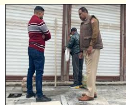
50-60 ਹਜ਼ਾਰ ਰੁਪਏ ਚੁੱਕ ਲਏ ਜੋ ਉਸ ਨੇ ਵਰਕਰਾਂ ਨੂੰ ਤਨਖਾਹਾਂ ਦੇਣ ਲਈ ਕਾਊਂਟਰ ਦੇ ਬੱਲੇ ਰੱਖੇ ਹੋਏ ਸਨ। ਪੁਲੀਸ ਨੇ ਕੇਸ ਦਰਜ ਕਰ ਕੇ ਕਾਰਵਾਈ ਆਰੰਭ ਦਿੱਤੀ ਹੈ।