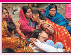
ਦੱਸਿਆ ਕਿ ਮਿਤਕਾਂ 'ਚ 14 ਮਹਿਲਾਵਾਂ ਸ਼ਾਮਲ ਹਨ। ਇਸ ਦੌਰਾਨ ਕੇਂਦਰੀ ਰੇਲ ਮੰਤਰੀ ਅਸ਼ਵਨੀ ਵੈਸ਼ਨਵ ਨੇ ਘਟਨਾ ਦੀ ਉੱਚ ਪੱਧਰੀ ਜਾਂਚ ਦੇ ਹੁਕਮ ਦਿੱਤੇ ਹਨ ਅਤੇ ਕਿਹਾ ਹੈ

ਦਿੱਲੀ ਰੇਲਵੇ ਸਟੇਸ਼ਨ 'ਤੇ ਭਗਦੜ; 18 ਹਲਾਕ ਨਵੀਂ ਦਿੱਲੀ ਲੋਕ ਥਾਣੀ ਨਵੀਂ ਦਿੱਲੀ ਰੇਲਵੇ ਸਟੇਸ਼ਨ 'ਤੇ ਲੰਘੀ ਰਾਤ ਭਾਰੀ ਭੀੜ ਕਾਰਨ ਮਰੀ ਭਗਦੜ 'ਚ ਘੱਟੋ-ਘੱਟ 18 ਲੋਕਾਂ ਦੀ ਮੌਤ ਹੋ ਗਈ ਅਤੇ 15 ਹੋਰ ਜ਼ਖਮੀ ਹੋ ਗਏ। ਇਹ ਘਟਨਾ ਰਾਤ 10 ਵਜੇ ਦੇ ਕਰੀਬ ਵਾਪਰੀ। ਭਾਰਤੀ ਰੇਲਵੇ ਮੁਤਾਬਕ ਮਿਤਕਾਂ ਦੇ ਪਰਿਵਾਰਾਂ ਨੂੰ 10-10 ਲੱਖ ਰੁਪਏ ਦਾ ਮੁਆਵਜ਼ਾ ਦਿੱਤਾ ਜਾਵੇਗਾ। ਗੰਭੀਰ ਜ਼ਖਮੀਆਂ ਲਈ 2.5 ਲੱਖ ਰੁਪਏ ਅਤੇ ਮਾਮੂਲੀ ਜ਼ਖਮੀਆਂ ਲਈ 1 ਲੱਖ ਰੁਪਏ ਦੇ ਮੁਆਵਜ਼ੇ ਦਾ ਐਲਾਨ ਵੀ ਕੀਤਾ ਗਿਆ ਹੈ। ਦਿੱਲੀ ਪੁਲੀਸ ਨੇ