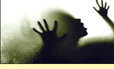
ਉਸ ਨੂੰ ਕਿਸੇ ਕੰਮ ਦੇ ਬਹਾਨੇ ਕਰਾਵਲ ਨਗਰ ਸਥਿਤ ਘਰ 'ਚ ਬੁਲਾਇਆ। ਜਦੋਂ ਉਹ ਪਹੁੰਚੀ ਤਾਂ ਮੁਲਜ਼ਮ ਨੇ ਉਸ ਨਾਲ ਜਬਰ ਜਨਾਹ ਕੀਤਾ।

ਨਵੀਂ ਦਿੱਲੀ ਲੋਕ ਬਾਣੀ-ਉੱਤਰ-ਪੂਰਬੀ ਦਿੱਲੀ ਦੇ ਕਰਾਵਲ ਨਗਰ ਇਲਾਕੇ 'ਚ ਇੱਕ 17 ਸਾਲਾ ਲੜਕੀ ਨਾਲ ਉਸ ਦੇ ਗੁਆਂਢੀ ਨੇ ਕਥਿਤ ਤੌਰ 'ਤੇ ਜਬਰ ਜਨਾਹ ਕਰਨ ਸਬੰਧੀ ਇਕ ਵਿਅਕਤੀ ਨੂੰ ਗ੍ਰਿਫ਼ਤਾਰ ਕੀਤਾ ਗਿਆ ਹੈ। ਪੁਲੀਸ ਨੇ ਮੁਲਜ਼ਮ ਨੂੰ ਗ੍ਰਿਫ਼ਤਾਰ ਕਰ ਕੇ ਪੁੱਛਗਿੱਛ ਸ਼ੁਰੂ ਕਰ ਦਿੱਤੀ ਗਈ ਹੈ। ਪੁਲੀਸ ਅਧਿਕਾਰੀ ਨੇ ਦੱਸਿਆ ਕਿ ਲੜਕੀ ਅਨੁਸਾਰ ਮੁਲਜ਼ਮ ਗੁਆਂਢੀ ਨੇ