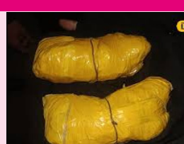
ਤਸਕਰਾਂ ਦੀ ਘੁਸਪੈਠ ਅਤੇ ਹਰਕਤਾਂ ਨੂੰ ਰੋਕਣ ਲਈ ਭਾਰਤ-ਪਾਕਿਸਤਾਨ ਸਰਹੱਦ ਨੇੜੇ ਨਾਜ਼ੁਕ ਥਾਵਾਂ 'ਤੇ ਸੀਸੀਟੀਵੀ ਕੈਮਰੇ ਲਗਾਉਣ ਲਈ 30 ਕਰੋੜ ਰੁਪਏ ਜਾਰੀ ਕੀਤੇ ਹਨ। ਹੋਇਆ ਹੈ।