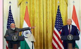
ਨੇ ਜਿੱਥੇ ਉਸਾਰੂ ਦੱਸਿਆ ਉੱਥੇ ਹੀ ਟਰੰਪ ਨੇ ਮੋਦੀ ਨੂੰ 'ਮਹਾਨ ਦੋਸਤ' ਤੇ 'ਸ਼ਾਨਦਾਰ ਆਦਮੀ' ਦੱਸਿਆ।

ਵਾਸ਼ਿੰਗਟਨ, ਲੋਕ ਬਾਣੀ- ਪ੍ਰਧਾਨ ਮੰਤਰੀ ਨਰਿੰਦਰ ਮੋਦੀ ਤੇ ਅਮਰੀਕੀ ਰਾਸ਼ਟਰਪਤੀ ਡੋਨਲਡ ਟਰੰਪ ਵੱਲੋਂ ਇੱਥੇ ਵਾਈਟ ਹਾਊਸ 'ਚ ਦੁਵੱਲੀ ਵਾਰਤਾ ਕੀਤੀ ਗਈ ਜਿਸ ਦੌਰਾਨ ਦੋਵਾਂ ਆਗੂਆਂ ਨੇ ਆਰਥਿਕ, ਸਮਾਜਿਕ, ਖੇਤਰੀ ਤੇ ਆਲਮੀ ਮਸਲਿਆਂ 'ਤੇ ਵਿਚਾਰ ਚਰਚਾ ਕੀਤੀ ਅਤੇ ਵੱਖ ਵੱਖ ਖੇਤਰਾਂ 'ਚ ਆਪਸੀ ਸਹਿਯੋਗ ਵਧਾਉਣ ਤੇ ਮਜ਼ਬੂਤ ਕਰਨ ਬਾਰੇ ਸਹਿਮਤੀ ਪ੍ਰਗਟਾਈ। ਇਸ ਮੁਲਾਕਾਤ ਨੂੰ ਪ੍ਰਧਾਨ ਮੰਤਰੀ ਮੋਦੀ