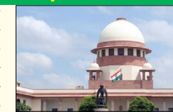
ਅਪਰੈਲ ਤੋਂ ਸ਼ੁਰੂ ਹੋਣ ਵਾਲੇ ਹਫ਼ਤੇ ਵਿੱਚ ਲਈ ਪੇਸ਼ ਕਰਨ ਵਾਸਤੇ ਕਿਹਾ ਹੈ। ਸੁਪਰੀਮ ਕੋਰਟ ਅਜਿਹੀਆਂ ਕਈ ਪਟੀਸ਼ਨਾਂ ਦੀ ਸੁਣਵਾਈ ਕਰ ਰਹੀ ਹੈ,