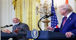
ਅਮਰੀਕਾ ਤੋਂ ਹੋਰ ਤੇਲ, ਗੈਸ ਅਤੇ 6-35 ਲੜਾਕੂ ਜਹਾਜ਼ਾਂ ਸਣੇ ਫੌਜੀ ਹਾਰਡਵੇਅਰ ਖਰੀਦੇਗਾ। ਟਰੰਪ ਨੇ ਹਾਲਾਂਕਿ ਜ਼ੋਰ ਦੇ ਕੇ ਆਖਿਆ ਕਿ ਵਾਸ਼ਿੰਗਟਨ ਨਵੀਂ ਦਿੱਲੀ ਨੂੰ ਪਰਸਪਰ ਟੈਰਿਫ ਤੋਂ ਨਹੀਂ ਬਖਸ਼ੇਗਾ।

ਵਾਸ਼ਿੰਗਟਨ ਲੋਕ ਬਾਣੀ-ਅਮਰੀਕੀ ਰਾਸ਼ਟਰਪਤੀ ਡੋਨਲਡ ਟਰੰਪ ਨੇ ਪ੍ਰਧਾਨ ਮੰਤਰੀ ਨਰਿੰਦਰ ਮੋਦੀ ਨਾਲ ਗੱਲਬਾਤ ਮਗਰੋਂ ਐਲਾਨ ਕੀਤਾ ਕਿ ਭਾਰਤ ਵਪਾਰਕ ਘਾਟੇ ਅਮਰੀਕਾ ਤੋਂ ਵਧੇਰੇ ਤੇਲ, ਗੈਸ ਅਤੇ 6-35 ਲੜਾਕੂ ਜਹਾਜ਼ਾਂ ਸਣੇ ਫੌਜੀ ਸਾਜ਼ੋ ਸਾਮਾਨ ਖਰੀਦੇਗਾ। ਅਮਰੀਕੀ ਰਾਸ਼ਟਰਪਤੀ ਡੋਨਲਡ ਟਰੰਪ ਨੇ ਪ੍ਰਧਾਨ ਮੰਤਰੀ ਨਰਿੰਦਰ ਮੋਦੀ ਨਾਲ ਗੱਲਬਾਤ ਤੋਂ ਬਾਅਦ ਐਲਾਨ ਕੀਤਾ ਕਿ ਭਾਰਤ ਵਪਾਰਕ ਘਾਟੇ ਨੂੰ ਘਟਾਉਣ ਲਈ