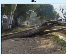
ਵੇਖ ਕੇ ਇਸ ਟੁੱਟ ਚੁੱਕੇ ਦਰੱਖਤ ਨੂੰ ਛੋਟੀ ਹੀ ਚੁੱਕਵਾ ਲਿਆ ਜਾਵੇਗਾ।

ਪੂਰੀ ਲੋਕ ਬਾਣੀ- ਦਰਲੇ ਵਾਲੇ ਫਾਟਕਾਂ ਕੋਲ ਪੈਦੀ ਨਹਿਰੀ ਵਿਭਾਗ ਦੀ ਨਰਸਰੀ ਨਾਲ ਜਾਂਦੇ ਰਜਵਾਹ 'ਤੇ ਲੰਮੇ ਸਮੇਂ ਤੋਂ ਇੱਕ ਸਫ਼ੇਦੇ ਦਾ ਦਰੱਖਤ ਰਜਵਾਹ ਦੇ ਦੋਵੇਂ ਕੰਢਿਆਂ 'ਤੇ ਡਿੱਗਣ ਕਾਰਨ ਆਉਣ-ਜਾਣ ਵਾਲਿਆਂ ਲਈ ਪ੍ਰੇਸ਼ਾਨੀ ਦਾ ਕਾਰਨ ਬਣਿਆ ਹੋਇਆ ਹੈ। ਇਸ ਸਬੰਧੀ ਜੰਗਲਾਤ ਵਿਭਾਗ ਦੇ ਅਧਿਕਾਰੀ ਕਾਰਨ ਆਉਣ-ਜਾਣ ਵਾਲਿਆਂ ਨੂੰ ਛੋਟੀ ਹੀ ਚੁੱਕਵਾ ਲਿਆ ਜਾਵੇਗਾ।