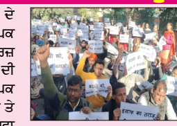
ਪੱਕਾਮੁੱਕੀ ਕੀਤੀ ਗਈ ਜਿਸ ਖ਼ਿਲਾਫ਼ ਅਧਿਆਪਕਾਂ ਨੇ ਰੋਸ ਪ੍ਰਗਟਾਇਆ। ਅਧਿਆਪਕ ਆਗੂਆਂ ਨੇ ਕਿਹਾ ਕਿ ਸ਼ਿਕਾਇਤ ਕਰਨ ਦੇ ਆਧਾਰ 'ਤੇ ਜਾਂਚ ਕਮੇਟੀ ਬਣਾਈ ਗਈ ਹੈ

ਚੰਡੀਗੜ੍ਹ, ਲੋਕ ਬਾਣੀ ਯੂਟੀ ਦੇ ਸਰਕਾਰੀ ਸਕੂਲਾਂ ਦੀ ਅਧਿਆਪਕ ਜਥੇਬੰਦੀ ਜੁਆਇੰਟ ਟੀਚਰਜ਼ ਐਸੋਸੀਏਸ਼ਨ ਦੇ ਚੇਅਰਮੈਨ ਦੀ ਬਦਲੀ ਖ਼ਿਲਾਫ਼ ਅੱਜ ਅਧਿਆਪਕ ਯੂਟੀ ਸਕੱਤਰੇਤ ਵਿੱਚ ਇਕੱਠੇ ਹੋਏ ਤੇ ਅਧਿਆਪਕ ਆਗੂ ਦੀ ਇਕਤਰਫਾ ਸ਼ਿਕਾਇਤ 'ਤੇ ਬਦਲੀ ਕਰਨ ਖ਼ਿਲਾਫ਼ ਰੋਸ ਪ੍ਰਗਟਾਇਆ। ਇਸ ਮੌਕੇ ਪ੍ਰਸ਼ਾਸਕ ਦੇ ਸਲਾਹਕਾਰ ਨੂੰ ਮੰਗ ਪੱਤਰ ਦੇਣ ਜਾਂਦੇ ਅਧਿਆਪਕਾਂ ਨਾਲ ਸਬੰਧਤ ਖੇਤਰ ਦੇ ਐਸਐੱਚਓ ਵੱਲੋਂ