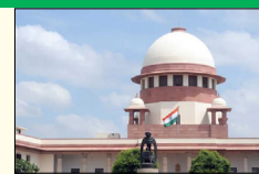
ਨਹੀਂ ਕੀਤਾ ਗਿਆ। ਬੈਂਚ ਨੇ ਕਿਹਾ, 'ਸੀਐੱਮਐੱਸ ਯੂਨੀਵਰਸਿਟੀ ਦੇ ਚਾਂਸਲਰ ਦੀ ਨਿਯੁਕਤੀ ਨੂੰ ਹਾਈ ਕੋਰਟ ਦੇ ਡਿਵੀਜ਼ਨ ਬੈਂਚ ਵੱਲੋਂ ਕਾਨੂੰਨ ਦੀ ਨਜ਼ਰ 'ਚ ਅਵੇਧ ਐਲਾਨਿਆ ਗਿਆ ਸੀ