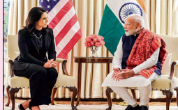
ਸਹਿਯੋਗ ਵਧਾਉਣਾ ਸ਼ਾਮਲ ਹੈ। ਮਸਕ ਆਪਣੇ ਤਿੰਨ ਬੱਚਿਆਂ ਨਾਲ ਬਲੇਅਰ ਹਾਊਸ ਪੁੱਜੇ ਸਨ

ਵਾਸ਼ਿੰਗਟਨ, ਲੋਕ ਬਾਣੀ- ਅਮਰੀਕਾ ਦੇ ਦੌਰੇ 'ਤੇ ਇਥੇ ਪੁੱਜੇ ਪ੍ਰਧਾਨ ਮੰਤਰੀ ਨਰਿੰਦਰ ਮੋਦੀ ਨੇ ਅੱਜ ਸਪੇਸਐਕਸ ਦੇ ਸੀਈਓ ਐਲਨ ਮਸਕ ਨਾਲ ਮੁਲਾਕਾਤ ਕੀਤੀ। ਮੋਦੀਆਂ ਨੇ ਕਿਹਾ ਕਿ ਦੋਵੇਂ ਆਗੂਆਂ ਨੇ ਕਈ ਮੁੱਦਿਆਂ ਬਾਰੇ ਗੱਲਬਾਤ ਕੀਤੀ ਜਿਸ 'ਚ ਪੁਲਾੜ, ਗਤੀਸ਼ੀਲਤਾ, ਤਕਨੀਕ ਅਤੇ ਨਵੀਆਂ ਖੋਜਾਂ ਦੇ ਖੇਤਰ 'ਚ ਭਾਰਤ ਅਤੇ ਅਮਰੀਕਾ ਵਿਚਕਾਰ