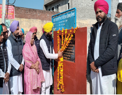
ਨਾਲ ਨਗਰ ਪੰਚਾਇਤ ਘੜ੍ਹਿਆਂ ਵਿੱਚ ਨਿਕਾਸੀ ਪਾਣੀ ਦੀ ਸਮੱਸਿਆ ਦਾ ਹੱਲ ਹੋ ਜਾਵੇਗਾ। ਇਸ ਮੌਕੇ ਨਗਰ ਨਿਵਾਸੀ ਹਾਜ਼ਰ ਸਨ

ਦਾ ਉਦਘਾਟਨ ਕੀਤਾ ਹੈ ਇਸ ਤੋਂ 18 ਲੱਖ ਰੁਪਏ ਦੀ ਲਾਗਤ ਆਵੇਗੀ। ਉਨ੍ਹਾਂ ਦੱਸਿਆ ਕਿ ਜੋ ਨਗਰ ਘੜ੍ਹਿਆਂ ਵਿਖੇ ਪਰਜਾਪਤ ਭਾਈਚਾਰੇ ਲਈ ਜੋ ਸ਼ੌਫ਼ ਬਣਾਉਣ ਦਾ ਉਦਘਾਟਨ ਕੀਤਾ ਗਿਆ ਹੈ ਜੋ ਕਿ ਤਕਰੀਬਨ 8 ਲੱਖ 31 ਹਜ਼ਾਰ ਰੁਪਏ ਦੀ ਲਾਗਤ ਨਲ ਬਣ ਕੇ 2 ਮਹੀਨੇ ਵਿੱਚ ਤਿਆਰ ਹੋ ਜਾਵੇਗਾ। ਉਨ੍ਹਾਂ ਕਿਹਾ ਕਿ ਘੜ੍ਹਿਆਂ ਦੇ ਪਾਣੀ ਦੀ ਨਿਕਾਸੀ ਦੀ ਸਮੱਸਿਆ ਦਾ ਹੱਲ ਕਰਨ ਲਈ ਜਲਦ ਹੀ ਪਲਾਟ ਲਗਾਇਆ ਜਾ ਰਿਹਾ ਹੈ ਜਿਸ ਦੇ ਲੰਗਟ