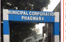
ਕਰਕੇ ਕਾਂਗਰਸੀ ਕੌਂਸਲਰ ਚਿੰਤਤ ਸਨ ਕਿ ਸ਼ਾਇਦ ਸਰਕਾਰ ਇਸਨੂੰ ਹੋਰ ਲੰਬਾ ਸਮਾਂ ਨਾ ਲਟਕਾਏ। ਕਾਂਗਰਸ ਕੋਲ 22 ਕੌਂਸਲਰ ਹਨ ਤੇ 3 ਬਸਪਾ ਦੇ ਸਮਰਥਕ ਵੀ ਇਸ ਨਾਲ ਹਨ

ਫਗਵਾੜਾ, ਲੋਕ ਬਾਣੀ -- ਇੱਥੋਂ ਦੇ ਨਗਰ ਨਿਗਮ ਦੀ ਪਿਛਲੇ ਮਹੀਨੇ 21 ਦਸੰਬਰ ਨੂੰ ਹੋਈਆਂ ਚੋਣਾਂ ਦੇ ਸਬੰਧ ਵਿੱਚ ਹੁਣ ਮੇਅਰ, ਸੀਨੀਅਰ ਡਿਪਟੀ ਮੇਅਰ ਤੇ ਉੱਪ ਮੇਅਰ ਦੀ ਚੋਣ ਤੇ ਸਹੁੰ ਚੁੱਕ ਸਮਾਗਮ 25 ਜਨਵਰੀ ਸ਼ਾਮ 4 ਵਜੇ ਆਡੀਟੋਰੀਅਮ ਹਾਲ ਵਿਖੇ ਹੋਵੇਗਾ। ਇਸ ਸਬੰਧੀ ਪੰਜਾਬ ਸਰਕਾਰ ਨੇ ਹੁਕਮ ਜਾਰੀ ਕਰ ਦਿੱਤੇ ਹਨ। ਇਸ ਚੋਣ ਤੋਂ ਬਾਅਦ ਹੁਣ ਕੌਂਸਲਰ ਉਤਾਵਲੇ ਸਨ ਕਿ ਮੇਅਰ ਦੀ ਚੋਣ ਜਲਦ ਹੋਵੇ। ਕਾਂਗਰਸ ਕੋਲ ਵਧੇਰੇ ਬਹੁਮਤ ਹੋਣ