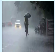
ਕਾਫੀ ਦਿੱਕਤਾਂ ਹੋ ਰਹੀਆਂ ਹਨ

ਚੰਡੀਗੜ੍ਹ, ਵਿਨੋਦ ਸ਼ਰਮਾ - ਪੰਜਾਬ ਵਿੱਚ ਮੌਸਮ ਨੂੰ ਲੋਕੇ ਅੱਜ ਤੋਂ ਵੱਡਾ ਬਦਲਾਅ ਦੇਖਣ ਨੂੰ ਮਿਲੇਗਾ। ਮੌਸਮ ਵਿਭਾਗ ਨੇ ਪੰਜਾਬ ਦੇ ਅੱਧੇ ਤੋਂ ਜਿਆਦਾ ਜ਼ਿਲ੍ਹਿਆਂ ਵਿੱਚ ਮੀਂਹ ਦਾ ਅਲਰਟ ਜਾਰੀ ਕੀਤਾ ਹੈ। ਸੂਬੇ ਵਿੱਚ ਵੈਸਟਰਨ ਡਿਸਟਰਬੈਂਸ ਸਰਗਰਮ ਹੋਣ ਨਾਲ 2 ਦਿਨ ਤੱਕ ਕੁਝ ਥਾਵਾਂ 'ਤੇ ਮੀਂਹ ਪੈਣ ਦੀ ਸੰਭਾਵਨਾ ਹੈ ਤੇ ਪੰਜਾਬ ਚ ਹੁੰਦੇ ਕਾਰਨ ਵਾਹਨਾਂ ਨੂੰ