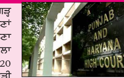
ਚਾਰ ਸਾਲ ਤੋਂ ਚੱਲ ਰਹੇ ਵਿਵਾਦ ਅਤੇ ਦੇਰੀ ਨੂੰ ਸਮਾਪਤ ਕਰਨ ਦੇ ਉਦੇਸ਼ ਨਾਲ ਲਿਆ ਗਿਆ ਹੈ।