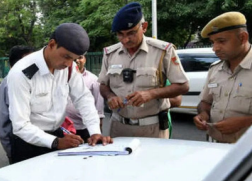
ਲਾਇਸੈਂਸ ਰੱਦ ਕਰਨ ਦੇ ਨਾਲ ਉਨ੍ਹਾਂ ਦੇ ਰਜਿਸਟਰੇਸ਼ਨ ਸਰਟੀਫਿਕੇਟ (ਆਰਸੀ) ਵੀ ਮੁਅੱਤਲ ਕੀਤੇ ਜਾਣਗੇ।