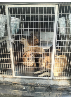
ਰੋਜ਼ਾਨਾ ਲੋਕ ਬਾਣੀ www.lokbanii