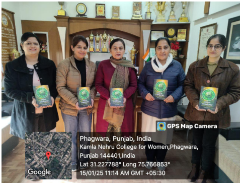
Phagwara, Punjab, India Kamla Nehru College for Women, Phagwara, Punjab 144401, India Lat 31.227788° Long 75.766853° 15/01/25 11:14 AM GMT +05:30