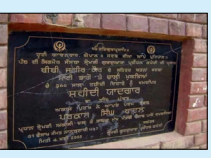
ਇਹ ਨੀਂਹ ਪੱਥਰ ਸ਼੍ਰੋਮਣੀ ਗੁਰਦੁਆਰਾ ਪ੍ਰਬੰਧਕ ਕਮੇਟੀ ਦੀ ਤਤਕਾਲੀ ਪ੍ਰਧਾਨ ਬੀਬੀ ਜਗੀਰ ਕੌਰ ਅਤੇ ਸ਼੍ਰੋਮਣੀ ਅਕਾਲੀ ਦਲ ਦੇ ਤਤਕਾਲੀ ਪ੍ਰਧਾਨ ਸਦਰਗੀ ਪ੍ਰਕਾਸ਼ ਸਿੰਘ ਬਾਦਲ ਵੱਲੋਂ ਰੱਖਿਆ

ਸ੍ਰੀ ਮੁਕਤਸਰ ਸਾਹਿਬ ਲੋਕ ਬਾਣੀ- ਜਿਉਂ ਹੀ ਸ੍ਰੀ ਮੁਕਤਸਰ ਸਾਹਿਬ ਦੇ ਮੇਲਾ ਮਾਘੀ ਦਾ ਜ਼ਿਕਰ ਹੁੰਦਾ ਹੈ ਤਾਂ 19 ਸਾਲ 8 ਮਹੀਨੇ ਪਹਿਲਾਂ 2 ਮਈ 2005 ਨੂੰ ਮਾਈ ਭਾਰੀ ਤੇ ਚਾਲੀ ਮੁਕਤਿਆਂ ਦੇ 300 ਸਾਲਾ ਸ਼ਹੀਦੀ ਦਿਹਾੜੇ ਨੂੰ ਸਮਰਪਿਤ ਯਾਦਗਾਰ ਬਣਾਉਣ ਦੇ ਰੱਖ ਨੀਂਹ ਪੱਥਰ ਦੀ ਆਮ ਲੋਕ ਤਾਂ ਚਰਚਾ ਕਰਦੇ ਹਨ, ਪਰ ਅਫ਼ਸੋਸ ਦੀ ਗੱਲ ਹੈ ਕਿ ਹੁਣ ਕੋਈ ਵੀ ਧਾਰਮਿਕ ਜਾਂ ਸਿਆਸੀ ਆਗੂ ਇਸ ਯਾਦਗਾਰ ਦੀ ਗੱਲ ਨਹੀਂ ਕਰਦਾ।