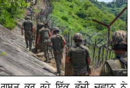
ਗਸ਼ਤ ਕਰ ਰਹੇ ਇੱਕ ਫ਼ੌਜੀ ਜਵਾਨ ਨੇ ਗਲਤੀ ਨਾਲ ਇੱਕ ਬਾਰੂਦੀ ਸੁਰੰਗ 'ਤੇ ਪੈਰ ਰੱਖ ਦਿੱਤਾ, ਜਿਸ ਕਾਰਨ ਛੇ ਫ਼ੌਜੀ ਜਵਾਨ ਜ਼ਖ਼ਮੀ ਹੋ ਗਏ

ਜੰਮੂ, ਲੋਕ ਬਾਣੀ- ਅਧਿਕਾਰੀਆਂ ਨੇ ਦੱਸਿਆ ਕਿ ਮੰਗਲਵਾਰ ਨੂੰ ਜੰਮੂ-ਕਸ਼ਮੀਰ ਦੇ ਰਾਜ਼ੀਰੀ ਜ਼ਿਲ੍ਹੇ ਵਿੱਚ ਕੰਟਰੋਲ ਰੇਖਾ (*ੳ੩) ਨੇੜੇ ਇੱਕ ਬਾਰੂਦੀ ਸੁਰੰਗ ਧਮਾਕੇ ਵਿੱਚ ਛੇ ਸੈਨਿਕ ਜ਼ਖ਼ਮੀ ਹੋ ਗਏ। ਇਹ ਧਮਾਕਾ ਰਾਜ਼ੀਰੀ ਦੇ ਨੌਸ਼ਹਿਰਾ ਸੈਕਟਰ ਵਿੱਚ ਧਮਾਕਾ ਹੋਇਆ। ਇੱਕ ਅਧਿਕਾਰੀ ਨੇ ਇਹ ਜਾਣਕਾਰੀ ਦਿੱਤੀ ਕਿ ਇਹ ਘਟਨਾ ਸਵੇਰੇ 10.45 ਵਜੇ ਦੇ ਕਰੀਬ ਵਾਪਰੀ ਜਦੋਂ ਕੰਟਰੋਲ ਰੇਖਾ ਦੇ ਨੌਸ਼ਹਿਰਾ ਸੈਕਟਰ ਵਿੱਚ