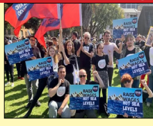
ਮੁਲਕਾਂ ਤੋਂ ਆਏ ਸਟੂਡੈਂਟਸ, ਕੱਚੇ ਵੀਜ਼ੇ ਵਾਲੇ ਪਰਵਾਸੀ ਵਰਗ ਵਧੇਰੇ ਹਨ। ਇਨ੍ਹਾਂ ਨੂੰ ਕਈ ਕਾਰੋਬਾਰੀ ਸਸਤੀ ਲੋਥਰ ਦੇ ਤੌਰ 'ਤੇ ਵਰਤਦੇ ਹਨ

ਆਸਟਰੇਲੀਆ ਲੋਕ ਬਾਣੀ- ਆਸਟਰੇਲੀਆ ਨੇ ਕਾਰਮੀਆਂ ਦਾ ਸ਼ੋਸ਼ਣ ਰੋਕਣ ਲਈ ਸਖਤੀ ਕਰਨੀ ਸ਼ੁਰੂ ਕਰ ਕੀਤੀ ਹੈ। ਇਕ ਮਿਥੀ ਹੱਦ ਨਾਲ ਘੱਟ ਤਨਖਾਹ ਦੇਣ ਵਾਲੇ ਕਾਰੋਬਾਰੀਆਂ ਲਈ ਨਵਾਂ ਕਾਨੂੰਨ ਪਹਿਲੀ ਜਨਵਰੀ ਤੋਂ ਲਾਗੂ ਕੀਤਾ ਜਾ ਚੁੱਕਾ ਹੈ। ਹੁਣ ਕਿਸੇ ਮੁਲਾਜ਼ਮ ਨੂੰ ਘੱਟ ਤਨਖਾਹ ਦੇਣ ਜਾਂ ਹੁਕਮਾਂ ਤੋਂ ਵਾਂਝੇ ਰੱਖਣ ਦੀ ਅਣਗਹਿਲੀ ਇੱਕ ਸਜ਼ਾਯੋਗ ਜੁਰਮ ਹੋਵੇਗੀ। ਗ਼ਰਬਤਲਬ ਹੈ ਕਿ ਕਈ ਕਾਰੋਬਾਰੀ ਕਾਰਮੀਆਂ ਨੂੰ ਘੱਟ ਤਨਖਾਹ ਦੇ ਕੇ ਉਨ੍ਹਾਂ ਦਾ ਸ਼ੋਸ਼ਣ ਕਰਦੇ ਸਨ। ਆਰਥਿਕ ਲੁੱਟ ਦੇ ਸਿਹਾਰ ਪੀੜਤਾਂ 'ਚ ਖ਼ਾਸਕਰ ਭਾਰਤ ਸਮੇਤ ਹੋਰਨਾਂ