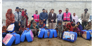
ਰੋਜ਼ਾਨਾ ਲੋਕ ਬਾਣੀ www.lokbani