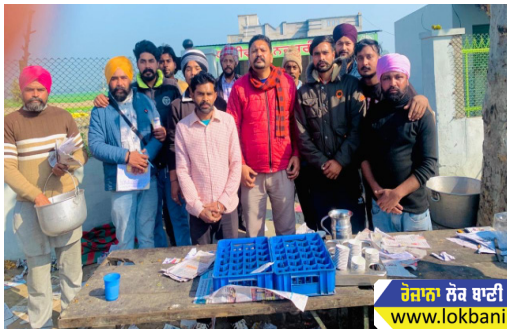
ਰੋਜ਼ਾਨਾ ਲੋਕ ਬਾਣੀ www.lokbani