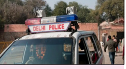
ਨੇ ਕਿਹਾ ਕਿ ਜਾਂਚ ਦੌਰਾਨ ਉਨ੍ਹਾਂ ਨੂੰ ਇਹ ਵੀ ਪਤਾ ਲੱਗਾ ਕਿ @7@ (ਗੌਰ-ਸਰਕਾਰੀ ਸੰਸਥਾ) ਨੇ ਸੰਸਦ 'ਤੇ ਹਮਲੇ ਦੇ ਦੋਸ਼ੀ ਅਫ਼ਜ਼ਲ ਗੁਰੂ ਦੀ ਹਮਾਇਤ ਕੀਤੀ ਸੀ।

ਨਵੀਂ ਦਿੱਲੀ, ਲੋਕ ਬਾਣੀ- ਦਿੱਲੀ ਪੁਲੀਸ ਨੇ ਮੰਗਲਵਾਰ ਨੂੰ ਦਾਅਵਾ ਕੀਤਾ ਹੈ ਕਿ ਸ਼ਹਿਰ ਦੇ ਸਕੂਲਾਂ ਨੂੰ ਬੰਬ ਨਾਲ ਉਡਾਉਣ ਦੀਆਂ ਧਮਕੀਆਂ ਭੇਜਣ ਦੇ ਦੋਸ਼ ਵਿੱਚ ਹਾਲ 'ਚ ਹੀ ਗ੍ਰਿਫ਼ਤਾਰ ਕੀਤਾ ਗਿਆ 12ਵੀਂ ਜਮਾਤ ਦਾ ਵਿਦਿਆਰਥੀ ਇੱਕ ਅਜਿਹੀ NGO ਨਾਲ ਜੁੜਿਆ ਹੋਇਆ ਹੈ, ਜਿਹੜੀ ਇੱਕ ਰਾਜਨੀਤਿਕ ਪਾਰਟੀ ਦੀ ਹਮਾਇਤ ਕਰਦੀ ਹੈ। ਇੱਕ ਪੁਲੀਸ ਅਧਿਕਾਰੀ