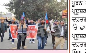
ਐਜੂਕੇਸ਼ਨ (ਸੈਕੰਡਰੀ) ਪੰਜਾਬ ਵਲੋਂ ਬੀਤੀ 8 ਨਵੰਬਰ ਨੂੰ ਇਕ ਪੱਤਰ ਜ਼ਰੀਏ ਪੀ. ਟੀ.ਆਈ. ਅਤੇ ਆਰਟ ਕਰਾਫਟ ਅਧਿਆਪਕਾਂ ਦੀ ਤਨਖਾਹ ਰਵਿਜ਼ਨ ਅਤੇ ਰਿਕਵਰੀ ਕਰਨ ਦਾ ਨਾਦਰਸ਼ਾਹੀ ਫਰਮਾਨ ਜਾਰੀ ਕੀਤਾ ਗਿਆ ਹੈ,