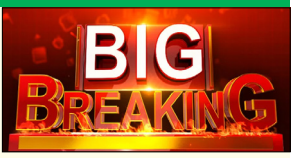
ਕਿ ਅੰਮ੍ਰਿਤਪਾਲ ਸਿੰਘ ਇਸ ਸਮੇਂ ਅਸਮ ਦੀ ਡਿਫ਼ਰੈਂਸ ਜੇਲ੍ਹ ਵਿੱਚ ਸਾਥੀਆਂ ਸਮੇਤ ਬੰਦ ਹਨ। ਉਨ੍ਹਾਂ ਉਪਰ ਪੰਜਾਬ ਸਰਕਾਰ ਵੱਲੋਂ NSA ਕਾਨੂੰਨ ਲਾਗੂ ਕੀਤਾ ਹੋਇਆ ਹੈ।

ਸ੍ਰੀ ਮੁਕਤਸਰ ਸਾਹਿਬ, ਲੋਕ ਬਾਣੀ- ਪੰਜਾਬ ਵਿੱਚ ਅੱਜ ਮਾਘੀ ਮੇਲੇ 'ਤੇ ਖ਼ੁਬ ਸਾਹਿਬ ਤੋਂ ਮੈਂਬਰ ਪਾਰਲੀਮੈਂਟ ਅੰਮ੍ਰਿਤਪਾਲ ਸਿੰਘ ਨਾਲ ਜੁੜੀ ਵੱਡੀ ਖ਼ਬਰ ਸਾਹਮਣੇ ਆਈ ਹੈ। ਮੇਲੇ 'ਤੇ ਸਿਆਸੀ ਕਾਨਫਰੰਸ ਦੌਰਾਨ ਅੰਮ੍ਰਿਤਪਾਲ ਸਿੰਘ ਦੇ ਧੜੇ ਵੱਲੋਂ ਸਿਆਸੀ ਪਾਰਟੀ ਦਾ ਐਲਾਨ ਕਰ ਦਿੱਤਾ ਗਿਆ ਹੈ। ਵਾਰਿਸ ਪੰਜਾਬ ਦੇ ਮੁਖੀ ਅੰਮ੍ਰਿਤਪਾਲ ਸਿੰਘ ਦੀ ਪਾਰਟੀ ਦਾ ਨਾਮ 'ਅਕਾਲੀ ਦਲ ਵਾਰਿਸ ਪੰਜਾਬ ਦੇ' ਰੱਖਿਆ ਗਿਆ ਹੈ। ਦੱਸ ਦਈਏ