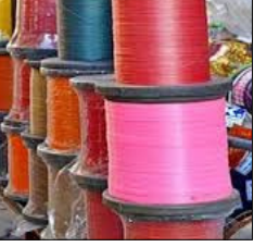
ਇਸ ਪਾਬੰਦੀ ਦੇ ਬਾਵਜੂਦ ਇਸ ਡੋਰ ਨੂੰ ਵੇਚਣ ਵਾਲਿਆਂ ਮਿਲਾਫ਼ 10 ਹਜ਼ਾਰ ਰੁਪਏ ਤੋਂ ਲੈ ਕੇ 15 ਲੱਖ ਰੁਪਏ ਤੱਕ ਦਾ ਜੁਰਮਾਨਾ ਲਗਾਇਆ ਜਾ ਸਕਦਾ ਹੈ।