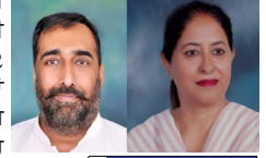
ਰੋਜ਼ਾਨਾ ਲੋਕ ਬਾਣੀ www.lokbani

ਲੁਧਿਆਣਾ (ਵਰਿੰਦਰ ਪ੍ਰਕਾਸ਼ ਭਾਂਬਰੀ / ਸੁਖਚੈਨ ਮਹਿਰਾ)- ਆਮ ਆਦਮੀ ਪਾਰਟੀ ਨੇ ਵਿਧਾਨ ਸਭਾ 2022 ਦੀਆਂ ਚੋਣਾਂ ਦੌਰਾਨ ਪੰਜਾਬ ਦੇ ਲੋਕਾਂ ਨੂੰ ਗਰੰਟੀਆ ਦੇ ਵਾਅਦੇ ਕਰਕੇ ਪੰਜਾਬ ਵਿੱਚ 92 ਵਿਧਾਇਕਾਂ ਨਾਲ ਸ਼ਾਨਦਾਰ ਜਿੱਤ ਹਾਸਲ ਕਰਨ ਵਿੱਚ ਸਫਲ ਹੋਏ ਸਨ। ਪਰ 2024 ਲੋਕ ਸਭਾ ਚੋਣਾਂ ਦੌਰਾਨ ਪੰਜਾਬ ਵਾਸੀਆਂ ਨੇ ਆਮ ਆਦਮੀ ਪਾਰਟੀ ਨੂੰ ਵਾਅਦੇ ਪੰਜਾਬ ਦੇ ਲੋਕਾਂ ਨਾਲ ਕੀਤੇ ਸੀ ਉਹਨਾਂ ਵਾਅਦਿਆਂ ਤੇ ਆਪ ਖਰੀ ਨਹੀਂ ਉਤਰ ਸਕੀ, ਜਿਸ ਕਰਕੇ ਆਪ ਦੇ 3 ਉਮੀਦਵਾਰ ਹੀ ਜਿੱਤੇ ਸਨ। ਹਾਲ ਹੀ ਲੁਧਿਆਣਾ ਨਗਰ ਨਿਗਮ ਚੋਣਾਂ 2024 ਵਿੱਚ ਆਪ ਬਹੁਮਤ ਹਾਸਲ ਨਹੀਂ ਕਰ ਸਕੀ। ਆਪ ਨੂੰ ਲੁਧਿਆਣਾ ਨਗਰ ਨਿਗਮ ਦੇ 95 ਵਾਰਡਾਂ ਤੋਂ 41 ਵਾਰਡਾਂ ਤੇ ਜਿੱਤ ਹਾਸਲ ਕਰਨ ਵਿੱਚ ਸਫਲ ਹੋਏ। ਜੇਕਰ ਗੱਲ ਕਰੀਏ ਨਗਰ ਨਿਗਮ ਚੋਣਾਂ ਵਿੱਚ ਆਪ ਨੂੰ ਪੂਰੇ ਲੁਧਿਆਣਾ ਤੋਂ ਸਭ ਤੋਂ ਘੱਟ ਸੀਟਾਂ ਹਲਕਾ ਦੱਖਣੀ ਵਿੱਚ 11 ਵਾਰਡਾਂ ਤੇ ਸਿਰਫ 2 ਸੀਟਾਂ ਤੇ ਜਿੱਤ ਹਾਸਲ ਹੋਈ ਸੀ। ਜੇਕਰ ਇੱਥੇ ਪਿਛਲੇ ਆਂਕੜਿਆਂ ਦੀ ਗੱਲ ਕਰੀਏ ਤਾਂ ਆਪ ਨੇ ਵਿਧਾਨ ਸਭਾ ਚੋਣਾਂ ਵਿੱਚ ਹਲਕਾ ਦੱਖਣੀ ਤੇ ਤਕਰੀਬਨ 44500 ਵੋਟਾਂ ਪਈਆਂ ਤੇ ਆਪ ਵਿਧਾਇਕਾ ਨੇ ਸ਼ਾਨਦਾਰ ਜਿੱਤ ਹਾਸਲ ਕੀਤੀ। 2024 ਲੋਕ ਸਭਾ ਚੋਣਾਂ ਦੌਰਾਨ ਆਮ ਆਦਮੀ ਪਾਰਟੀ ਨੂੰ ਤਕਰੀਬਨ 19500 ਵੋਟਾਂ ਪਈਆਂ। ਜਿੱਕਿ ਵਿਧਾਨ ਸਭਾ ਚੋਣਾਂ ਨਾਲੋਂ 25000 ਵੋਟਾਂ ਘੱਟ ਪਈਆਂ। ਹਾਲ ਹੀ ਨਗਰ ਨਿਗਮ ਚੋਣਾਂ ਵਿੱਚ ਆਮ ਆਦਮੀ ਪਾਰਟੀ 11 ਵਾਰਡਾਂ ਤੇ ਸਿਰਫ 2 ਵਾਰਡ ਹੀ ਜਿੱਤਣ ਤੇ ਸਫਲ ਰਹੇ। ਇੱਥੇ ਲੋਕ ਸਭਾ ਚੋਣਾਂ ਤੋਂ ਵੀ ਘੱਟ ਵੋਟਾਂ ਪਈਆਂ, ਜਿਸ ਤੋਂ ਇਹ ਸਿੱਧ ਹੁੰਦਾ ਹੈ ਕਿ ਲੋਕਾਂ ਦਾ ਆਮ ਆਦਮੀ ਪਾਰਟੀ ਤੋਂ ਮੋੜ ਭੰਗ ਹੋਇਆ ਹੈ।