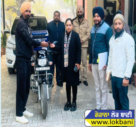
ਰੋਜ਼ਾਨਾ ਲੋਕ ਬਾਣੀ www.lokbani