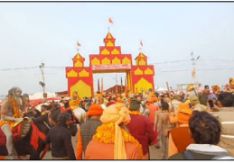
ਸੁਚਾਰੂ ਪ੍ਰਬੰਧ ਅਤੇ ਸੁਰੱਖਿਆ ਨੂੰ ਯਕੀਨੀ ਬਣਾਉਣ ਲਈ ਵਿਆਪਕ ਵਾਹਨ ਪਾਰਕਿੰਗ ਪ੍ਰਬੰਧ ਕੀਤੇ ਗਏ ਹਨ।

ਮਹਾਕੁੰਭ ਲਈ 6 ਤਰ੍ਹਾਂ ਦੇ ਵਾਹਨ ਈ-ਪਾਸ ਜਾਰੀ ਕੀਤੇ ਜਾਣਗੇ ਪ੍ਰਯਾਗਰਾਜ, ਲੋਕ ਬਾਣੀ- ਉੱਤਰ ਪ੍ਰਦੇਸ਼ ਸਰਕਾਰ ਆਗਾਮੀ ਮਹਾਕੁੰਭ 2025 ਮੇਲੇ ਵਿੱਚ ਸ਼ਰਧਾਲੂਆਂ ਦੀ ਸੁਰੱਖਿਆ ਨੂੰ ਯਕੀਨੀ ਬਣਾਉਣ ਲਈ ਛੇ ਵੱਖ-ਵੱਖ ਕਿਸਮ ਦੇ ਵਾਹਨ ਈ-ਪਾਸ ਜਾਰੀ ਕਰੇਗੀ। ਵੀਆਈਪੀਜ਼ ਲਈ ਸਟੈਂਡ, ਅਖਾੜਿਆਂ ਲਈ ਭਗਵਾ, ਸੰਸਥਾਵਾਂ ਲਈ ਪੀਲਾ, ਮੀਡੀਆ ਕਰਮੀਆਂ ਲਈ ਅਸਮਾਨੀ ਨੀਲਾ, ਪੁਲਿਸ ਲਈ ਨੀਲਾ ਅਤੇ ਐਮਰਜੈਂਸੀ ਵਾਹਨਾਂ ਲਈ ਲਾਲ ਰੰਗ ਦੇ ਪਾਸ ਜਾਰੀ ਕੀਤੇ ਜਾਣਗੇ। ਇਸ ਤੋਂ ਇਲਾਵਾ ਸ਼ਰਧਾਲੂਆਂ ਦੀ ਸਹੂਲਤ,