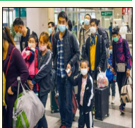
ਮੈਟਾਨਿਊਮੋਵਾਇਰਸ ਸਾਹ ਨਾਲ ਜੁੜੇ ਕਿਸੇ ਵੀ ਹੋਰ ਵਾਇਰਸ ਵਾਂਗ ਹੈ,