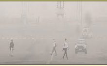
ਸ਼੍ਰੇਣੀ ਵਿਚ ਹੈ। ਕੇਂਦਰੀ ਪ੍ਰਦੂਸ਼ਣ ਕੰਟਰੋਲ ਬੋਰਡ ਨੇ ਇਕ ਦਿਨ ਦੇ ਬੰਦ ਤੋਂ ਬਾਅਦ ਡਾਟਾ ਅਪਡੇਟ ਮੁੜ ਸ਼ੁਰੂ ਕੀਤਾ।

ਦਿੱਲੀ ਦਾ ਸੰਘਣੀ ਧੁੰਦ ਕਾਰਨ ਤਾਪਮਾਨ 8 ਡਿਗਰੀ ਸੈਲਸੀਅਸ ਤੱਕ ਨਵੀਂ ਦਿੱਲੀ, ਲੋਕ ਬਾਣੀ-ਰਾਜਧਾਨੀ ਦਿੱਲੀ ਚ ਅੱਜ ਸੰਘਣੀ ਧੁੰਦ ਛਾਈ ਰਹੀ, ਜਿਸ ਨਾਲ ਤਾਪਮਾਨ ਘੱਟੋ-ਘੱਟ 8 ਡਿਗਰੀ ਸੈਲਸੀਅਸ ਤੱਕ ਡਿੱਗ ਗਿਆ। ਇਸ ਦੌਰਾਨ, ਦਿੱਲੀ ਦੀ ਹਵਾ ਦੀ ਗੁਣਵੱਤਾ ਹੋਰ ਵਿਗੜ ਗਈ, ਹਵਾ ਗੁਣਵੱਤਾ ਸੂਚਕਾਂਕ 348 ਦਰਜ ਕੀਤਾ ਗਿਆ, ਜੋ ਕਿ ਬਹੁਤ ਮਾੜੀ