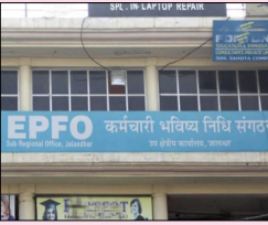
ਹੁਣ ਕਿਸੇ ਵੀ ਬੈਂਕ ਵਿਚੋਂ ਪੈਨਸ਼ਨ ਕਢਵਾ ਸਕਣਗੇ ਤੇ ਉਨ੍ਹਾਂ ਨੂੰ ਪੈਨਸ਼ਨ ਸ਼ੁਰੂ ਕਰਵਾਉਣ ਮੌਕੇ ਤਸਦੀਕ ਲਈ ਕਿਸੇ ਬੈਂਕ ਵਿਚ ਜਾਣ ਦੀ ਵੀ ਲੋੜ ਨਹੀਂ ਪਏਗੀ

ਈਪੀਐੱਫਓ ਪੈਨਸ਼ਨਰ ਹੁਣ ਕਿਸੇ ਵੀ ਬੈਂਕ 'ਚੋਂ ਕਢਵਾ ਸਕਣਗੇ ਪੈਨਸ਼ਨ ਨਵੀਂ ਦਿੱਲੀ, ਲੋਕ ਬਾਣੀ-ਕਰਮਚਾਰੀ ਪ੍ਰੋਵੀਡੈਂਟ ਫੰਡ ਸੰਗਠਨ (ਈਪੀਐੱਫਓ) ਦੇ ਪੈਨਸ਼ਨਰ ਹੁਣ ਕਿਸੇ ਵੀ ਬੈਂਕ ਤੋਂ ਪੈਨਸ਼ਨ ਕਢਵਾ ਸਕਣਗੇ। ਰਿਟਾਇਰਮੈਂਟ ਫੰਡ ਬਾਰੇ ਸੋਸ਼ਲ ਈਪੀਐੱਫਓ ਨੇ ਪੂਰੇ ਦੇਸ਼ ਵਿਚਲੇ ਆਪਣੇ ਖੇਤਰੀ ਦਫਤਰਾਂ ਵਿਚ ਕੇਂਦਰੀਕ੍ਰਿਤ ਪੈਨਸ਼ਨ ਪੋਸਟ ਸਿਸਟਮ ਪ੍ਰਬੰਧ ਲਾਗੂ ਕਰਨ ਦਾ ਅਮਲ ਪੂਰਾ ਕਰ ਲਿਆ ਹੈ। ਕਿਰਤ ਮੰਤਰਾਲੇ ਨੇ ਕਿਹਾ ਕਿ ਈਪੀਐੱਫਓ ਦੀ ਇਸ ਪੇਸ਼ਕਦਮੀ ਦਾ 68 ਲੱਖ ਤੋਂ ਵੱਧ ਪੈਨਸ਼ਨਰਾਂ ਨੂੰ ਲਾਭ ਹੋਵੇਗਾ। ਇਸ ਪ੍ਰਬੰਧ ਤਹਿਤ ਲਾਭਪਾਤਰੀ ਭਾਵ ਪੈਨਸ਼ਨਰ