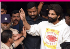
ਨੇ ਅਦਾਕਾਰ ਤੇ ਪੁਲੀਸ ਦੇ ਵਕੀਲਾਂ ਦੀਆਂ ਦਲੀਲਾਂ ਸੁਣਨ ਮਗਰੋਂ ਫੈਸਲਾ ਰਾਖਵਾਂ ਰੱਖ ਲਿਆ ਸੀ।

ਬੀਏਟਰ ਭਗਦੜ ਕੇਸ ਵਿਚ ਅਦਾਕਾਰ ਅਲੂ ਅਰਜੁਨ ਨੂੰ ਨਿਯਮਤ ਜ਼ਮਾਨਤ ਦੇਹਰਾਧਾਦ, ਲੋਕ ਬਾਣੀ-ਸਥਾਨਕ ਕੋਰਟ ਨੇ ਬੀਏਟਰ ਦੇ ਬਾਹਰ ਭਗਦੜ ਕੇਸ ਵਿਚ ਤੇਲਗੂ ਅਦਾਕਾਰ ਅਲੂ ਅਰਜੁਨ ਨੂੰ ਨਿਯਮਤ ਜ਼ਮਾਨਤ ਦੇ ਦਿੱਤੀ ਹੈ। ਅਦਾਕਾਰ ਦੀ ਹਾਲੀਆ ਰਿਲੀਜ਼ ਫਿਲਮ 'ਪੁਸ਼ਪਾ-2' ਦੀ ਸਕਰੀਨਿੰਗ ਮੌਕੇ ਬੀਏਟਰ ਦੇ ਬਾਹਰ ਮਚੀ ਭਗਦੜ 'ਚ ਇਕ ਮਹਿਲਾ ਦੀ ਮੌਤ ਹੋ ਗਈ ਸੀ। ਇਸ ਕੇਸ ਵਿਚ ਅਦਾਕਾਰ ਨੂੰ ਮੁਲਜ਼ਮ ਵਜੋਂ ਨਾਮਜ਼ਦ ਕੀਤਾ ਗਿਆ ਸੀ। ਇਸ ਤੋਂ ਪਹਿਲਾਂ ਵਧੀਕ ਮੈਟਰੋਪਾਲਿਟਨ ਸੈਸ਼ਨਜ਼ ਜੱਜ