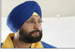
ਹਸਪਤਾਲ ਲਿਜਾਇਆ ਗਿਆ, ਜਿੱਥੇ ਉਨ੍ਹਾਂ ਦੀ ਇਕ ਆਰਟਰੀ ਬਲਾਕ ਹੋਣ ਬਾਰੇ ਪਤਾ ਲੱਗਾ। ਡਾਕਟਰ ਉਨ੍ਹਾਂ ਦੀ ਬਲਾਕ ਆਰਟਰੀ ਦਾ ਇਲਾਜ ਕਰ ਰਹੇ ਸਨ ਕਿ ਇਸ ਦੌਰਾਨ ਉਨ੍ਹਾਂ ਨੂੰ ਦਿਲ ਦਾ ਦੌਰਾ ਪੈ ਗਿਆ