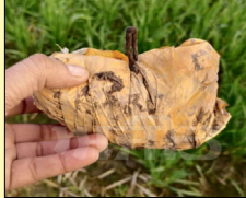
ਨਾਨਕ ਨਾਲ ਲੱਗਦੀ ਸਰਹੱਦੀ ਪੱਟੀ ਦੇ ਪਿੱਛਾਂ ਵਿੱਚ ਡੇਰੇ ਨਾਲ ਲੱਗਦੇ ਵੱਡੀ ਮੁਸ਼ਤੱਦੀ ਰੱਖੀ ਜਾ ਰਹੀ ਸੀ।