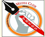
ਪੱਤਰਕਾਰਾਂ ਨੂੰ ਅਵਾਰਡ ਦੇ ਕੇ ਸਨਮਾਨਿਤ ਕੀਤਾ ਜਾਵੇਗਾ ਅਤੇ ਪੰਜਾਬੀ ਕਲਾਕਾਰਾਂ ਵਲੋਂ ਗ਼ਜ਼ਲ, ਤੇ ਗੀਤ ਗਾ ਕੇ ਆਏ ਹੋਏ ਮਹਿਮਾਨਾਂ ਦਾ ਸਵਾਗਤ ਕੀਤਾ ਜਾਵੇਗਾ ਇਸ ਗੱਲ ਦੀ

ਜਲੰਧਰ ਚ ਅੱਜ ਦੀ ਸ਼ਾਮ ਹੋਵੇਗੀ ਪੱਤਰਕਾਰਾਂ ਦੇ ਨਾਂਮ ਜਲੰਧਰ, ਵਿਸ਼ਾਲ ਸ਼ੈਲੀ-- ਸਭ ਤੋਂ ਪੁਰਾਣੀ ਤੇ ਸੀਨੀਅਰ ਪੱਤਰਕਾਰਾਂ ਦੀ ਸੰਸਥਾ ਅਤੇ ਪੰਜਾਬ ਭਰ ਦੇ ਪੱਤਰਕਾਰਾਂ ਦੇ ਭਲੇ ਲਈ ਬਣਾਈ ਗਈ ਸੰਸਥਾ ਮੀਡੀਆ ਕਲੱਬ ਵਲੋਂ ਜਲੰਧਰ ਵਿੱਚ ਅੱਜ ਦੀ ਸ਼ਾਮ ਪੱਤਰਕਾਰਾਂ ਦੇ ਨਾਂਮ ਪ੍ਰੋਗਰਾਮ ਮੀਡੀਆ ਕਲੱਬ ਵਲੋਂ ਕਰਵਾਇਆ ਜਾ ਰਿਹਾ ਹੈ ਤੇ ਜਿਸ ਵਿੱਚ ਸਾਰੇ ਮੀਡੀਆ ਕਰਮੀ ਨਵਾਂ ਸਾਲ ਮਨਾਉਣਗੇ ਤੇ ਸੀਨੀਅਰ ਤਿੰਨ ਬਜ਼ੁਰਗ ਸੀਨੀਅਰ