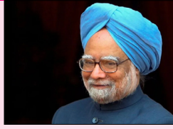
ਸੂਤਰਾਂ ਨੇ ਕਿਹਾ ਕਿ ਸਰਕਾਰ ਸਾਬਕਾ ਪ੍ਰਧਾਨ ਮੰਤਰੀ ਦੇ ਪਰਿਵਾਰ ਦੇ ਸੰਪਰਕ ਵਿੱਚ ਹੈ ਤੇ ਯਾਦਗਾਰ ਦੀ ਥਾਂ ਲਈ ਤਿੰਨ ਚਾਰ ਵਿਕਲਪਾਂ ਉੱਤੇ ਵਿਚਾਰ ਚਰਚਾ ਕੀਤੀ ਗਈ ਹੈ।

ਸਾਬਕਾ ਪ੍ਰਧਾਨ ਮੰਤਰੀ ਮਨਮੋਹਨ ਸਿੰਘ ਜੀ ਦੀ ਯਾਦਗਾਰ ਬਣਾਉਣ ਲਈ ਹੋਈ ਜਗ੍ਹਾ ਦੀ ਸ਼ਿਨਾਖਤ ਨਵੀਂ ਦਿੱਲੀ, ਲੋਕ ਬਾਣੀ- ਸਰਕਾਰ ਨੇ ਸਾਬਕਾ ਪ੍ਰਧਾਨ ਮੰਤਰੀ ਡਾ.ਮਨਮੋਹਨ ਸਿੰਘ ਦੀ ਯਾਦਗਾਰ ਵਾਸਤੇ ਥਾਂ ਦੀ ਨਿਸ਼ਾਨਦੇਹੀ ਲਈ ਅਮਲ ਸ਼ੁਰੂ ਕਰ ਦਿੱਤਾ ਹੈ। ਸਰਕਾਰ ਨੇ ਢੁੱਕਵੀਂ ਥਾਂ ਨੂੰ ਅੰਤਿਮ ਰੂਪ ਦੇਣ ਲਈ ਸਿੰਘ ਦੇ ਪਰਿਵਾਰ ਨਾਲ ਰਾਬਤਾ ਬਣਾਇਆ ਹੋਇਆ ਹੈ। ਸੂਤਰਾਂ ਨੇ ਕਿਹਾ ਕਿ ਸੀਪੀਡਬਲਿਊਡੀ ਅਧਿਕਾਰੀਆਂ ਨੇ ਰਾਸ਼ਟਰੀ ਸਮਿਤੀ ਸਥੱਲ ਵਿੱਚ ਸੰਜੇ ਗਾਂਧੀ ਦੀ ਯਾਦਗਾਰ ਨੇੜੇ ਦੱਰਾ ਕਰਕੇ ਕੁਝ ਥਾਵਾਂ ਦੀ ਸਨਾਖਤ ਕੀਤੀ ਹੈ, ਜਿੱਥੇ ਯਾਦਗਾਰ ਬਣਾਈ ਜਾ ਸਕਦੀ ਹੈ।