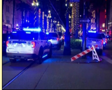
ਰਹਿਣ ਦੀ ਸਲਾਹ ਦਿੱਤੀ ਹੈ। ਪੁਲੀਸ ਵੱਲੋਂ ਇਸ ਘਟਨਾ ਦੀ ਦਹਿਸ਼ਤੀ ਹਮਲੇ ਵਜੋਂ ਜਾਂਚ ਕੀਤੀ ਜਾ ਰਹੀ ਹੈ।

ਅਮਰੀਕਾ ਵਿੱਚ ਨਵੇਂ ਸਾਲ ਮੌਕੇ ਵਾਪਰੇ ਹਾਦਸੇ ਵਿੱਚ ਦਸ ਦੀ ਮੌਤ ਅਮਰੀਕਾ ਲੋਕ ਬਾਣੀ-ਨਵੇਂ ਸਾਲ ਦੇ ਪਹਿਲੇ ਦਿਨ ਅੱਜ ਨਿਊ ਓਰਲੀਅਨਜ਼ (ਲੁਸਿਆਨਾ) ਦੀ ਮਸ਼ਹੂਰ ਕੈਨਾਲ ਤੇ ਬਰਬਰ ਸਟਰੀਟ ਉੱਤੇ ਤੇਜ਼ਤਰਾਰ ਪਿਕਅੱਪ ਟਰੱਕ ਨੇ ਹਜ਼ੂਮ ਨੂੰ ਦਰਭ ਦਿੱਤਾ। ਹਾਦਸੇ ਵਿੱਚ ਦਸ ਵਿਅਕਤੀਆਂ ਦੀ ਮੌਤ ਹੋ ਗਈ ਜਦੋਂਕਿ 30 ਹੋਰ ਜ਼ਖ਼ਮੀ ਦੱਸੇ ਜਾਂਦੇ ਹਨ। ਸ਼ਹਿਰ ਦੀ ਹੰਗਾਮੀ ਹਾਲਾਤ ਦੀਆਂ ਤਿਆਰੀਆਂ ਥਾਰੋ ਏਜੰਸੀ 'ਨੋਲਾ ਰੈਡੀ' ਨੇ ਇਲਾਕੇ ਦੇ ਲੋਕਾਂ ਨੂੰ ਘਰਾਂ ਵਿੱਚ