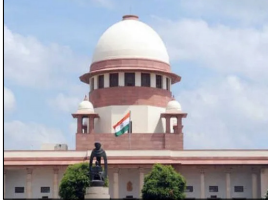
ਇਮਾਰਤਾਂ ਨੂੰ ਨਾ ਕਰਵਾ ਤੇ ਨਾ ਹੀ ਬਿਜਲੀ-ਪਾਣੀ ਤੇ ਸੰਵਹਿਤ ਦਾ ਕੁਨੈਕਸ਼ਨ ਮਿਲੇਗਾ।

ਸੁਪਰੀਮ ਕੋਰਟ ਹੋਈ ਗੈਰਕਾਨੂੰਨੀ ਇਮਾਰਤਾਂ ਦੇ ਖਿਲਾਫ ਦਿੱਲੀ, ਲੋਕ ਬਾਣੀ-ਸੁਪਰੀਮ ਕੋਰਟ ਨੇ 'ਗੈਰਕਾਨੂੰਨੀ ਉਸਾਰੀਆਂ' ਨੂੰ ਨੱਥ ਪਾਉਣ ਦੇ ਇਰਾਦੇ ਨਾਲ 'ਵਡੇਰੇ ਜਨਤਕ ਹਿੱਤਾਂ' ਵਿੱਚ ਪੂਰੇ ਦੇਸ਼ ਲਈ ਜਾਰੀ ਦਿਸ਼ਾ ਨਿਰਦੇਸ਼ਾਂ ਵਿੱਚ ਸਾਫ਼ ਕਰ ਦਿੱਤਾ ਕਿ ਬੈਂਕ ਅਤੇ ਵਿੱਤੀ ਸੰਸਥਾਵਾਂ ਕੰਪਲੀਕਸ/ਆਰਕੀਟੈਕਚਰ ਸਰਟੀਫਿਕੇਟ ਦੀ ਤਸਦੀਕ ਕੀਤੇ ਬਗੈਰ ਕਿਸੇ ਵੀ ਇਮਾਰਤ ਨੂੰ ਕਰਵਾ ਨਹੀਂ ਦੇਣਗੀਆਂ ਤੇ ਸਰਵਿਸ ਪ੍ਰੋਵਾਈਡਰਾਂ ਵੱਲੋਂ ਸਰਟੀਫਿਕੇਟ ਦੇਖਣ ਮਗਰੋਂ ਹੀ ਬਿਜਲੀ, ਪਾਣੀ ਤੇ ਸੰਵਹਿਤ ਦੇ ਕੁਨੈਕਸ਼ਨ ਦਿੱਤੇ ਜਾਣ। ਦੂਜੇ ਸ਼ਬਦਾਂ ਵਿੱਚ ਕਹਿੰਦੇ ਤਾਂ ਅਧੁਰੀਆਂ