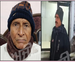
ਅਣਪਛਾਤੇ ਮੋਟਰਸਾਈਕਲ ਉਤੇ ਫਰਾਰ ਹੋ ਗਏ। ਥਾਣਾ ਸਿਟੀ ਪੁਲੀਸ ਬਲਾਚੌਰ ਲੁਟੇਰਿਆਂ ਦੀ ਭਾਲ ਵਿੱਚ ਡਾਪੋਮਾਰੀ ਕਰ ਰਹੀ ਹੈ।