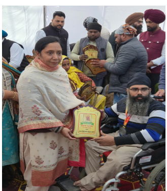
ਕਈ ਹੋਰ ਮੁੱਦਿਆਂ ਨੂੰ ਉਨ੍ਹਾਂ ਸਾਹਮਣੇ ਰੱਖਿਆ ਅਤੇ ਮੰਤਰੀ ਨੇ ਉਨ੍ਹਾਂ ਦੀਆਂ ਸਮੱਸਿਆਵਾਂ ਦੇ ਨਿਪਟਾਰੇ ਲਈ ਭਰੋਸਾ ਦਿੱਤਾ।

ਸਿੱਖਿਆ, ਰੋਜ਼ਗਾਰ ਅਤੇ ਸਿਹਤ ਸਹੂਲਤਾਂ ਦੇ ਪ੍ਰਦਾਨ ਲਈ ਦ੍ਰਿੜਤਾ ਨਾਲ ਕੰਮ ਕਰ ਰਹੀ ਹੈ। ਮੰਤਰੀ ਨੇ ਦਿਵਿਆਂਗਜਨ ਭਲਾਈ ਸਕੀਮਾਂ, ਜਿਵੇਂ ਕਿ ਪੈਨਸ਼ਨ ਯੋਜਨਾ, ਮੁਫਤ ਸਫਰ ਸਹੂਲਤ, ਸਵੈ-ਰੋਜ਼ਗਾਰ ਯੋਜਨਾਵਾਂ ਆਦਿ ਦਾ ਵੀ ਜ਼ਿਕਰ ਕੀਤਾ। ਉਨ੍ਹਾਂ ਨੇ ਕਿਹਾ ਕਿ ਦਿਵਿਆਂਗਜਨਾਂ ਦੀ ਭਲਾਈ ਲਈ ਮੁੱਖ ਮੰਤਰੀ ਸ. ਭਗਵੰਤ ਸਿੰਘ ਮਾਨ ਦੀ ਅਗਵਾਈ ਵਾਲੀ ਪੰਜਾਬ ਸਰਕਾਰ ਵੱਲੋਂ ਜ਼ਮੀਨੀ ਪੱਧਰ ਤੇ ਨਵੀਂ ਯੋਜਨਾਵਾਂ ਲਾਗੂ ਕੀਤੀਆਂ ਜਾ ਰਹੀਆਂ ਹਨ। ਸਮਾਗਮ ਦੌਰਾਨ ਕਮੇਟੀ ਦੇ ਮੈਂਬਰਾਂ ਨੇ ਪਿਛਲੇ ਅਰਸੇ ਦੌਰਾਨ ਦਿਵਿਆਂਗਜਨਾਂ ਦੀਆਂ ਕਈ ਮੰਗਾਂ ਨੂੰ ਪੂਰਾ ਕਰਨ ਤੇ ਕੈਬਨਿਟ ਮੰਤਰੀ ਡਾ. ਬਲਜੀਤ ਕੌਰ ਦਾ ਧੰਨਵਾਦ ਕੀਤਾ ਅਤੇ