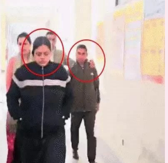
ਹੈ, ਜਿਸ ਚ ਉਨ੍ਹਾਂ ਨੇ ਇਸ ਪੂਰੇ ਮਾਮਲੇ ਨੂੰ ਮੰਦਭਾਗਾ ਦੱਸਿਆ ਹੈ। ਉਨ੍ਹਾਂ ਕਿਹਾ ਕਿ ਅਜਿਹਾ ਨਹੀਂ ਹੋਣਾ ਚਾਹੀਦਾ ਸੀ। ਅਜਿਹੀਆਂ ਗੱਲਾਂ ਵਿਭਾਗ ਦਾ ਨਾਂ ਬਦਨਾਮ ਕਰਦੀਆਂ ਹਨ। ਇਸ ਵਿਭਾਗ ਵਿੱਚ ਪਾਰਦਰਸ਼ਤਾ ਨਾਲ ਕੰਮ ਕੀਤਾ ਜਾਵੇ।