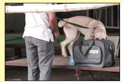
ਨੇ ਦੱਸਿਆ ਕਿ ਅੱਗ ਬੁਝਾਉ ਵਿਭਾਗ, ਸਥਾਨਕ ਪੁਲੀਸ, ਡਾਂਗ ਸਕੁਅਡ ਅਤੇ ਬੰਬ ਨਿਰੋਪਕ ਟੀਮਾਂ ਸਕੂਲ ਪਹੁੰਚੀਆਂ ਅਤੇ ਤਲਾਸ਼ੀ ਮੁਹਿੰਮ ਚਲਾਈ।

ਦਿੱਲੀ, ਲੋਕ ਬਾਣੀ-ਇੱਥੋਂ ਦੇ ਛੇ ਸਕੂਲਾਂ ਨੂੰ ਬੰਬ ਨਾਲ ਉਡਾਉਣ ਦੀ ਅੱਜ ਧਮਕੀ ਮਿਲੀ। ਅਧਿਕਾਰੀਆਂ ਨੇ ਦੱਸਿਆ ਕਿ ਕੌਮੀ ਰਾਜਧਾਨੀ ਦੇ ਸਕੂਲਾਂ ਨੂੰ ਇਸ ਹਫ਼ਤੇ ਧਮਕੀ ਭਰੇ ਈਮੇਲ ਭੇਜੇ ਜਾਣ ਦੀ ਇਹ ਤੀਜੀ ਘਟਨਾ ਹੈ। ਦਿੱਲੀ ਫਾਇਰ ਸਰਵਿਸਿਜ਼ ਦੇ ਇੱਕ ਅਧਿਕਾਰੀ ਨੇ ਦੱਸਿਆ, 'ਸਾਨੂੰ ਸਵੇਰੇ 6:09 ਵਜੇ ਦਿੱਲੀ ਪਬਲਿਕ ਸਕੂਲ, ਆਰਕੇ ਪੁਰਮ ਵਿੱਚ ਬੰਬ ਦੀ ਧਮਕੀ ਬਾਰੇ ਇੱਕ ਫੋਨ ਆਇਆ।' ਅਧਿਕਾਰੀ