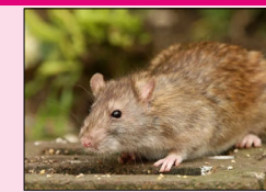
ਕਿ ਮੌਤ ਸੈਪਟੀਮੀਆ ਸਦਮਾ ਅਤੇ ਉੱਚ ਸੰਕਰਮਣ ਕਾਰਨ ਹੋਈ ਹੈ ਨਾ ਕਿ ਚੂਹੇ ਦੇ ਕੱਟਣ ਨਾਲ। ਰਾਜਸਥਾਨ ਸਰਕਾਰ ਨੇ ਮਾਮਲੇ ਦੀ ਜਾਂਚ ਲਈ ਇੱਕ ਕਮੇਟੀ ਦਾ ਗਠਨ ਕੀਤਾ ਹੈ।

ਜੈਪੁਰ, ਲੋਕ ਬਾਣੀ-ਸਰਕਾਰੀ ਹਸਪਤਾਲ ਵਿੱਚ ਕੈਂਸਰ ਦਾ ਇਲਾਜ ਕਰਵਾ ਰਹੇ 10 ਸਾਲਾ ਬੱਚੇ ਨੂੰ ਕਥਿਤ ਤੌਰ 'ਤੇ ਚੂਹੇ ਨੇ ਉਸ ਦੇ ਇੱਕ ਅੰਗੂਠੇ 'ਤੇ ਕੱਟ ਲਿਆ। ਹਸਪਤਾਲ ਦੇ ਇੱਕ ਅਧਿਕਾਰੀ ਨੇ ਸ਼ਨਿੱਚਰਵਾਰ ਨੂੰ ਦੱਸਿਆ ਕਿ ਉਸ ਦੀ ਮੌਤ ਹੋ ਗਈ ਹੈ। ਜਦੋਂ ਕਿ ਸਟੇਟ ਕੈਂਸਰ ਇਸਟੀਬਲਿਟੀ, ਜਿੱਥੇ ਲੜਕੇ ਨੂੰ 11 ਦਸੰਬਰ ਨੂੰ ਦਾਖਲ ਕਰਵਾਇਆ ਗਿਆ ਸੀ, ਨੇ ਕਿਹਾ