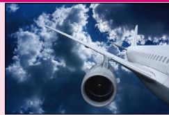
ਜੀਓ ਨਿਊਜ਼ ਮੁਤਾਬਕ 55 ਸਾਲਾ ਭਾਰਤੀ ਦੀ ਸਿਹਤ ਵਿਗੜਨ ਕਾਰਨ ਇਡੀਗੋ ਦੀ ਉਡਾਣ ਨੂੰ ਹੰਗਾਮੀ ਹਾਲਤ ਵਿੱਚ ਉਤਰਨਾ ਪਿਆ।

ਕਰਾਚੀ, ਲੋਕ ਬਾਣੀ- ਨਵੀਂ ਦਿੱਲੀ ਤੋਂ ਸਾਉਦੀ ਅਰਬ ਦੇ ਜੇਦਾਹ ਜਾ ਰਹੀ ਇਡੀਗੋ ਦੀ ਉਡਾਣ ਨੂੰ ਅੱਜ ਪਾਕਿਸਤਾਨ ਦੇ ਕਰਾਚੀ ਸ਼ਹਿਰ ਦੇ ਜਿਨਾਹ ਅੰਤਰਰਾਸ਼ਟਰੀ ਹਵਾਈ ਅੱਡੇ 'ਤੇ ਮੈਡੀਕਲ ਐਮਰਜੈਂਸੀ ਕਾਰਨ ਐਮਰਜੈਂਸੀ ਲੈਂਡਿੰਗ ਕਰਨੀ ਪਈ। ਸਿਵਲ ਏਵੀਏਸ਼ਨ ਅਥਾਰਟੀ (ਸੀਏਏ) ਦੇ ਸੂਤਰਾਂ ਅਨੁਸਾਰ ਨਵੀਂ ਦਿੱਲੀ ਤੋਂ ਰਵਾਨਾ ਹੋਇਆ ਇਹ ਜਹਾਜ਼ ਪਾਕਿਸਤਾਨੀ ਹਵਾਈ ਖੇਤਰ ਵਿੱਚ ਪੁੱਜਿਆ ਹੈ ਜੋ ਕਿ ਇੱਕ ਯਾਤਰੀ ਦੀ ਹਾਲਤ ਗੰਭੀਰ ਹੋ ਗਈ।