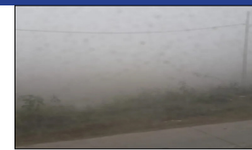
'ਚ 3.0 ਡਿਗਰੀ, ਚਿਤੌੜਗੜ੍ਹ 'ਚ 3.2 ਡਿਗਰੀ, ਪਿਲਾਨੀ 'ਚ 4.0 ਡਿਗਰੀ, ਜੈਪੁਰ 'ਚ 4.5 ਡਿਗਰੀ ਅਤੇ ਸੋਗਰੀਆ 'ਚ 4.9 ਡਿਗਰੀ ਸੈਲਸੀਅਸ ਦਰਜ ਕੀਤਾ ਗਿਆ।

ਜੈਪੁਰ, ਲੋਕ ਬਾਣੀ - ਰਾਜਸਥਾਨ ਦੇ ਕਈ ਇਲਾਕਿਆਂ 'ਚ ਠੰਡ ਦਾ ਕਹਿਰ ਜਾਰੀ ਹੈ, ਸੀਕਰ ਜ਼ਿਲ੍ਹੇ ਦੇ ਫਤਿਹਪੁਰ 'ਚ ਸਭ ਤੋਂ ਘੱਟ ਤਾਪਮਾਨ ਮਨਵੀਂ 1.3 ਡਿਗਰੀ ਸੈਲਸੀਅਸ ਦਰਜ ਕੀਤਾ ਗਿਆ। ਭਾਰਤੀ ਮੌਸਮ ਵਿਭਾਗ (ਐਸਐਮ) ਦੇ ਅਨੁਸਾਰ ਸ਼ੁੱਕਰਵਾਰ ਰਾਤ ਨੂੰ ਰਾਜ ਦੇ ਕਈ ਹਿੱਸਿਆਂ ਵਿੱਚ ਸੀਤ ਲਹਿਰ ਦੇ ਹਾਲਾਤ ਦਰਜ ਕੀਤੇ ਗਏ। ਕਰੋਲੀ 'ਚ ਘੱਟ-ਘੱਟ ਤਾਪਮਾਨ 1.9 ਡਿਗਰੀ ਸੈਲਸੀਅਸ, ਚੂਰੂ 'ਚ 2.4 ਡਿਗਰੀ, ਭੀਲਵਾੜਾ 'ਚ 2.6 ਡਿਗਰੀ, ਸਿਰੋਹੀ