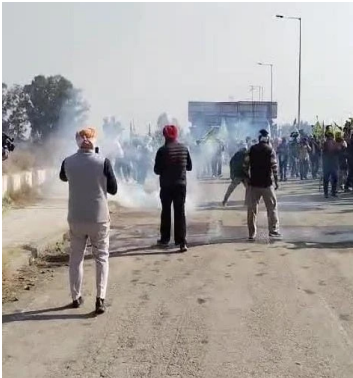
ਪੂਰਾ ਦੇਸ਼ ਚਿੰਤਤ ਹੈ, ਪਰ ਦੇਸ਼ ਦੇ ਪ੍ਰਧਾਨ ਮੰਤਰੀ ਨੂੰ ਨਹੀਂ।