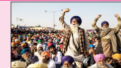
ਕਾਰਵਾਈ 'ਚ ਪੁਲਿਸ ਨੇ ਵੀ ਕਿਸਾਨਾਂ 'ਤੇ ਅੱਥਰੂ ਗੈਸ ਦੇ ਗੋਲੇ ਛੱਡੇ। ਹਾਲਾਂਕਿ, ਇਸ ਹੜਤਾਲ ਦੌਰਾਨ ਕਿਸਾਨ ਸਰਹੱਦ ਤੋਂ ਅੱਗੇ ਨਹੀਂ ਵਧ ਸਕੇ ਅਤੇ ਮੁੜ ਪਿੱਛੇ ਹਟ ਗਏ।

ਲੁਧਿਆਣਾ, ਸੁਖਚੈਨ ਮਹਿਰਾ- ਸ਼ੁੱਠ ਬੈਰੀਅਰ ਤੇ ਕਿਸਾਨ ਆਗੂਆਂ ਵਲੋਂ ਕੱਲ੍ਹ 14 ਦਸੰਬਰ ਨੂੰ ਦਿੱਲੀ ਕੂਚ ਲਈ ਤੀਜੇ ਜਥੇ ਦੇ ਜਾਣ ਦੀ ਤਿਆਰੀ ਖਿੱਚ ਲਈ ਗਈ ਹੈ। ਇਸ ਲਈ ਪੰਜਾਬ ਭਰ ਵਿੱਚੋਂ ਕਿਸਾਨਾਂ ਦੇ ਵੱਡੇ ਜਥੇ ਸ਼ੁੱਠ ਬੈਰੀਅਰ ਤੇ ਪੁੱਜਣੇ ਸ਼ੁਰੂ ਹੋ ਗਏ ਹਨ। ਜ਼ਿਆਦਾ ਠੰਢ ਪੈਣ ਕਾਰਨ ਕਿਸਾਨ ਅੱਗ ਬਾਲ ਕੇ ਸੋਕ ਰਹੇ ਹਨ। ਇੱਥੇ ਕਿਸਾਨਾਂ ਨੇ ਬੈਰੀਕੇਡ ਉਖਾੜ ਦਿੱਤੇ। ਜਵਾਬੀ