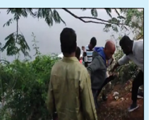
ਪੱਚਮਪੱਲੀ ਦੇ ਜਲਾਲਪੁਰ ਨੇੜੇ ਵਾਪਰਿਆ। ਹਾਦਸੇ ਦੇ ਸਮੇਂ ਕਾਰ ਵਿੱਚ ਛੇ ਲੋਕ ਸਵਾਰ ਸਨ।

ਹੈਦਰਾਬਾਦ ਲੋਕ ਬਾਣੀ- ਤੇਲੰਗਾਨਾ ਦੇ ਯਾਦਾਦਰੀ ਭੁਵਨਗਿਰੀ ਜ਼ਿਲ੍ਹੇ ਵਿੱਚ ਇੱਕ ਕਾਰ ਬੇਕਾਬੂ ਹੋ ਕੇ ਛੱਪੜ ਵਿੱਚ ਡਿੱਗ ਗਈ। ਇਸ ਹਾਦਸੇ ਵਿੱਚ ਪੰਜ ਲੋਕਾਂ ਦੀ ਮੌਤ ਹੋ ਗਈ ਅਤੇ ਇੱਕ ਵਿਅਕਤੀ ਸੁਰੱਖਿਅਤ ਬਚ ਗਿਆ। ਇਹ ਹਾਦਸਾ ਜ਼ਿਲ੍ਹੇ ਦੇ ਭੂਦਨ