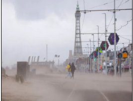
ਆਇਰਲੈਂਡ, ਵੇਲਜ਼ ਅਤੇ ਪੱਛਮੀ ਇੰਗਲੈਂਡ ਤੂਫਾਨ ਆਵੇਗਾ

ਲੰਡਨ, ਲੋਕ ਬਾਣੀ- ਬਰਤਾਨੀਆ ਅਤੇ ਆਇਰਲੈਂਡ ਵਿੱਚ ਵੱਡੀ ਗਿਣਤੀ ਲੋਕ ਅੱਜ ਬਿਜਲੀ ਤੋਂ ਵਾਂਞੇ ਰਹੇ। ਇੱਥੇ ਅੱਜ ਤੇਜ਼ ਹਵਾਵਾਂ ਅਤੇ ਭਾਰੀ ਮੀਂਹ ਪਿਆ ਜਿਸ ਕਾਰਨ ਮੌਸਮ ਵਿਭਾਗ ਨੇ ਲੋਕਾਂ ਨੂੰ ਘਰਾਂ ਦੇ ਅੰਦਰ ਰਹਿਣ ਦੀ ਚਿਤਾਵਨੀ ਦਿੱਤੀ ਸੀ। ਇਨ੍ਹਾਂ ਖੇਤਰਾਂ ਵਿੱਚ 93 ਮੀਲ ਪ੍ਰਤੀ ਘੰਟਾ ਦੀ ਰਫਤਾਰ ਨਾਲ ਤੇਜ਼ ਹਵਾਵਾਂ ਚੱਲੀਆਂ। ਜ਼ਿਕਰਯੋਗ ਹੈ ਕਿ ਯੂਕੇ ਦੇ ਮੌਸਮ ਵਿਭਾਗ ਨੇ ਬੀਤੇ ਦਿਨੀਂ ਰੈੱਡ ਅਲਰਟ ਜਾਰੀ ਕਰਦਿਆਂ ਪੇਸ਼ਨਗੋਈ ਕੀਤੀ ਸੀ ਕਿ ਉੱਤਰੀ