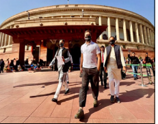
ਐਕਸ ਤੇ ਲੋਕੇ ਕਿਹਾ, ਸਰਮਾਏਦਾਰਾਂ ਨੂੰ ਰਿਆਇਤਾਂ ਅਤੇ ਆਮ ਲੋਕਾਂ ਦੀ ਲੁੱਟ ਦੀ ਇੱਕ ਹੋਰ ਉਦਾਹਰਣ ਦੱਸੀ।

ਦਿੱਲੀ, ਲੋਕ ਬਾਣੀ-ਕਾਂਗਰਸ ਨੇਤਾ ਅਤੇ ਲੋਕ ਸਭਾ ਚ ਵਿਰੋਧੀ ਧਿਰ ਦੇ ਨੇਤਾ ਰਾਹੁਲ ਗਾਂਧੀ ਨੇ ਭਾਰਤੀ ਜਨਤਾ ਪਾਰਟੀ ਦੀ ਅਗਵਾਈ ਵਾਲੀ ਕੇਂਦਰ ਤੇ ਨਿਸ਼ਾਨਾ ਸਾਧਦੇ ਹੋਏ ਦੋਸ਼ ਲਗਾਇਆ ਕਿ ਉਹ 1500 ਰੁਪਏ ਤੋਂ ਵੱਧ ਕੀਮਤ ਵਾਲੇ ਕੱਪੜਿਆਂ ਤੇ ਜੀ ਐੱਸ ਟੀ. ਸਲੈਬ ਨੂੰ ਵਧਾਉਣ ਦੀ ਯੋਜਨਾ ਬਣਾ ਰਹੀ ਹੈ। ਇਸ ਮੌਕੇ ਉਨ੍ਹਾਂ ਨੇ ਇਸ ਤੇ ਪੁੱਜੀਪਤੀਆਂ ਦਾ ਪੱਖ ਪੂਰਦਿਆਂ ਗਰੀਬ ਅਤੇ ਮੱਧ ਵਰਗ ਤੇ ਬੋਝ ਪਾਉਣ ਦਾ ਦੋਸ਼ ਲਾਇਆ। ਰਾਹੁਲ ਗਾਂਧੀ ਨੇ ਸੋਸ਼ਲ ਮੀਡੀਆ ਪਲੇਟਫਾਰਮ