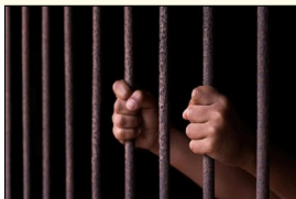
ਹਵਾਲਾਤੀ ਦੀ ਗੰਭੀਰ ਹਾਲਤ ਨੂੰ ਵੇਖਦੇ ਹੋਏ ਉਸ ਨੂੰ ਅੰਮ੍ਰਿਤਸਰ ਲਈ ਰੈਫਰ ਕਰ ਦਿੱਤਾ ਗਿਆ ਹੈ ਕਿ ਇਹੋ ਬਦਲਾਅ ਹੈ

ਜਲੰਧਰ, ਬਿੱਟੂ ਫੋਲਡੀਵਾਲ --ਪੰਜਾਬ ਵਿੱਚ ਆਪ ਸਰਕਾਰ ਆਉਣ ਤੋਂ ਬਾਅਦ ਕਾਨੂੰਨ ਵਿਵਸਥਾ ਦਾ ਬੁਰਾ ਹਾਲ ਹੈ ਹੁਣ ਤਾਂ ਜੇਲ੍ਹਾਂ ਚ ਵੀ ਸ਼ਰੇਆਮ ਗੁੰਡਾਗਰਦੀ ਦਾ ਰਾਜ ਹੈ ਤਾਜ਼ਾ ਮਾਮਲਾ ਕੇਂਦਰੀ ਜੇਲ੍ਹ ਜਲੰਧਰ ਤੇ ਕਪੂਰਥਲਾ 'ਦਾ ਹੈ ਜਿਥੇ ਹਵਾਲਾਤੀਆਂ ਦੇ 2 ਗੁੱਟਾਂ ਵਿਚਾਲੇ ਝਗੜਾ ਹੋਣ ਦਾ ਹੈ ਇਸ ਗੋਰਾਵਾਰ ਦੌਰਾਨ 4 ਹਵਾਲਾਤੀ ਜ਼ਖਮੀ ਹੋ ਗਏ, ਜਿਨ੍ਹਾਂ 'ਚ ਇੱਕ ਜ਼ਖਮੀ