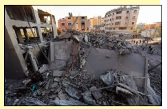
ਹਮਲਿਆਂ ਦੀ ਕੋਈ ਜਾਣਕਾਰੀ ਨਹੀਂ ਹੈ। ਇਜ਼ਰਾਈਲ ਨੇ ਕਿਹਾ ਕਿ ਉਹ ਆਮ ਨਾਗਰਿਕਾਂ ਨੂੰ ਬਚਾਉਣ ਦੀ ਕੋਸ਼ਿਸ਼ ਦੌਰਾਨ ਸਿਰਫ਼ ਦਹਿਸ਼ਤਗਰਦਾਂ ਨੂੰ ਨਿਸ਼ਾਨਾ ਬਣਾ ਰਹੇ ਹਨ।

ਮੁਵਾਸੀ ਇਲਾਕਿਆਂ ਚ ਇਜ਼ਰਾਈਲ ਨੇ ਕੈਂਪ ਨੂੰ ਬਣਾਇਆ ਨਿਸ਼ਾਨਾ ਦੀਰ ਅਲ-ਬਲਾਹ, ਲੋਕ ਬਾਣੀ-ਗਾਜ਼ਾ ਪੱਟੀ 'ਤੇ ਇਜ਼ਰਾਈਲ ਵੱਲੋਂ ਕੀਤੇ ਗਏ ਹਮਲਿਆਂ 'ਚ ਦੋ ਬੱਚਿਆਂ ਸਮੇਤ ਛੇ ਵਿਅਕਤੀ ਹਲਾਕ ਹੋ ਗਏ। ਇਜ਼ਰਾਈਲ ਵੱਲੋਂ ਮੁਵਾਸੀ ਇਲਾਕੇ ਦੇ ਇਕ ਕੈਂਪ 'ਤੇ ਹਮਲਾ ਕੀਤਾ ਗਿਆ ਸੀ ਜਿਥੇ ਹਜ਼ਾਰਾਂ ਲੋਕਾਂ ਨੇ ਪਨਾਹ ਲਈ ਹੋਈ ਹੈ। ਮਿਸਰ ਨਾਲ ਲਗਦੇ ਸਰਹੱਦੀ ਸ਼ਹਿਰ ਰਾਫਾ 'ਤੇ ਇਕ ਹੋਰ ਹਮਲੇ 'ਚ ਚਾਰ ਵਿਅਕਤੀ ਮਾਰੇ ਗਏ। ਇਜ਼ਰਾਈਲੀ ਫੌਜ ਨੇ ਕਿਹਾ ਕਿ ਉਨ੍ਹਾਂ ਨੂੰ ਇਨ੍ਹਾਂ ਇਲਾਕਿਆਂ 'ਚ