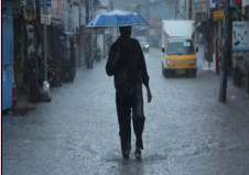
ਚਿਤਾਵਨੀ ਜਾਰੀ ਕੀਤੀ ਹੈ ਜੋ ਕਮਜ਼ੋਰ ਥਾਵਾਂ ਤੇ ਰਹਿ ਰਹੇ ਹਨ ਅਤੇ ਉਨ੍ਹਾਂ ਨੂੰ ਸੁਰੱਖਿਅਤ ਸਥਾਨਾਂ ਤੇ ਜਾਣ ਦੀ ਅਪੀਲ ਕੀਤੀ ਹੈ।