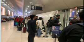
ਖਰਾਬੀ ਆਉਣ ਕਾਰਨ ਉਸ ਨੂੰ ਸਵੇਰੇ 4:01 ਵਜੇ ਕੁਵੈਤ 'ਚ ਉਤਾਰਨਾ ਪਿਆ। ਸੋਸ਼ਲ ਮੀਡੀਆ 'ਤੇ ਪਾਈ ਗਈ ਇੱਕ ਪੋਸਟ ਅਨੁਸਾਰ ਕਈ ਯਾਤਰੀਆਂ ਨੇ ਸ਼ਿਕਾਇਤ ਕੀਤੀ ਕਿ ਉਹ ਘੰਟਿਆਂਬੱਧੀ ਹਵਾਈ ਅੱਡੇ ਉੱਤੇ ਫਸੇ ਰਹੇ

ਭਾਰਤੀ ਯਾਤਰੀਆਂ ਨੂੰ ਕੁਵੈਤ ਹਵਾਈ ਅੱਡੇ ਤੇ ਕਈ ਘੰਟੇ ਹੋਣਾ ਪਿਆ ਖਜਲ ਖੁਆਰ ਕੁਵੈਤ ਲੋਕ ਬਾਣੀ- ਮੈਨਚੈਸਟਰ ਜਾਣ ਵਾਲੀ 'ਗਲਫ ਏਅਰ' ਦੀ ਉਡਾਣ ਦੇ ਕਈ ਭਾਰਤੀ ਮੁਸਾਫਰ ਕੁਵੈਤ ਹਵਾਈ ਅੱਡੇ 'ਤੇ ਤਕਰੀਬਨ 20 ਘੰਟੇ ਤੱਕ ਫਸੇ ਰਹਿਣ ਮਗਰੋਂ ਅੱਜ ਸਵੇਰੇ ਆਪਣੀ ਮੰਜ਼ਿਲ ਵੱਲ ਰਵਾਨਾ ਹੋਏ। ਬਹਿਰੀਨ ਤੋਂ ਮੈਨਚੈਸਟਰ ਜਾਣ ਵਾਲੀ ਉਡਾਣ ਨੂੰ ਤਕਨੀਕੀ ਖਰਾਬੀ ਕਾਰਨ ਕੁਵੈਤ ਮੌੜ ਦਿੱਤਾ ਗਿਆ ਸੀ। ਖਬਰ ਅਨੁਸਾਰ ਗਲਫ ਏਅਰ ਜੀਐੱਫ5 ਨੇ 1 ਦਸੰਬਰ ਨੂੰ ਸਥਾਨਕ ਸਮੇਂ ਅਨੁਸਾਰ ਦੋਰ ਰਾਤ 2:05 ਵਜੇ ਬਹਿਰੀਨ ਤੋਂ ਉਡਾਣ ਭਰੀ ਪਰ ਜਹਾਜ਼ 'ਚ ਕੁਝ ਤਕਨੀਕੀ