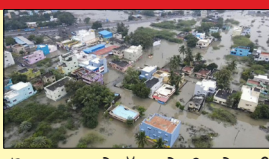
ਸੋਮਵਾਰ ਤੜਕੇ ਤੱਕ ਪਏ ਮੀਂਹ ਨੇ ਕਈ ਇਲਾਕਿਆਂ ਵਿੱਚ ਹੜ ਦੀ ਸਥਿਤੀ ਪੈਦਾ ਕਰ ਦਿੱਤੀ ਹੈ। ਖਾਸ ਕਰਕੇ ਬੁਥੂਕੁਤੀ ਵਿੱਚ ਸੜਕਾਂ ਅਤੇ ਇੱਥੋਂ ਤੱਕ ਕਿ ਲੋਕਾਂ ਦੇ ਘਰ ਵੀ ਪਾਣੀ ਨਾਲ ਭਰੇ ਹੋਏ ਦੇਖੇ ਗਏ।

ਤਾਮਿਲਨਾਡੂ ਵਿਚ ਹੜ ਕਾਰਨ ਸਕੂਲ ਕਾਲਜ ਕਿਤੇ ਗਏ ਬੰਦ ਤਾਮਿਲਨਾਡੂ, ਲੋਕ ਬਾਣੀ-ਜ਼ਿਲ੍ਹੇ ਵਿਚ ਹੜਾਂ ਤੋਂ ਬਾਅਦ ਕੁੱਝਲੋਰ ਜ਼ਿਲ੍ਹੇ ਵਿਚ ਸਕੂਲਾਂ ਅਤੇ ਕਾਲਜਾਂ ਵਿਚ ਛੁੱਟੀ ਦਾ ਐਲਾਨ ਕੀਤਾ ਗਿਆ ਹੈ। ਕੁੱਝਲੋਰ ਜ਼ਿਲ੍ਹਾ ਕੁਲੈਕਟਰ ਨੇ ਇਸ ਸੰਬੰਧੀ ਜਾਣਕਾਰੀ ਦਿੱਤੀ। ਤਾਮਿਲਨਾਡੂ ਅਜੇ ਤੱਕ ਚੱਕਰਵਾਤੀ ਤੂਫਾਨ ਮਿਚੰਗੇ ਦੇ ਪੜਾਵਾਂ ਤੋਂ ਉਤਰ ਨਹੀਂ ਸਕਿਆ ਹੈ। ਇਸ ਦੌਰਾਨ ਸੂਬੇ 'ਚ ਇਕ ਵਾਰ ਫਿਰ ਤੋਂ ਭਾਰੀ ਮੀਂਹ ਦਾ ਅਲਰਟ ਜਾਰੀ ਕੀਤਾ ਗਿਆ ਹੈ। ਇੱਥੇ ਐਤਵਾਰ ਦੋਰ ਰਾਤ ਤੋਂ