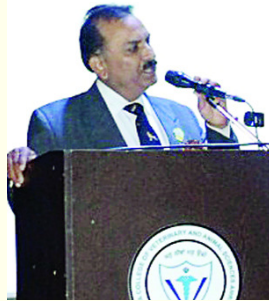
ਕਰਦਾ ਹੈ। ਇਸ ਮੌਕੇ ਪੀ. ਯੂ. ਐਮ. ਦੇ ਮਾਰਿਗ ਡੈਲੀਗੇਟਾਂ 'ਚ ਡੇਅਰੀ ਅਤੇ ਬੱਕਰੀ ਦੇ