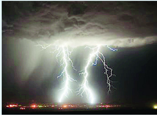
8 ਫਰਵਰੀ ਦੀ ਸ਼ਾਮ ਤੋਂ ਪੱਛਮੀ ਹਿਮਾਲੀਅਨ ਖੇਤਰ ਵਿੱਚ ਇੱਕ ਹੋਰ ਪੱਛਮੀ ਗੜਬੜੀ ਦੇ ਆਉਣ ਦੀ ਸੰਭਾਵਨਾ ਹੈ। 8 ਅਤੇ 10 ਫਰਵਰੀ ਦੇ