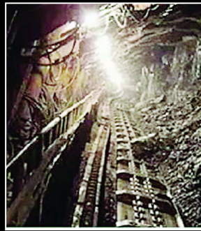
ਲਾਪਤਾ ਲੋਕਾਂ ਦੀ ਭਾਲ ਲਈ ਆਸ-ਪਾਸ ਦੇ ਇਲਾਕਿਆਂ ਤੋਂ ਬਚਾਅ ਕਰਮੀਆਂ ਨੂੰ ਭੇਜਿਆ ਗਿਆ ਹੈ। ਅੰਦਰੂਨੀ ਮੰਗੋਲੀਆ ਚੀਨ

ਬੀਜਿੰਗ/ਲੋਕ ਬਾਣੀ ਚੀਨ ਦੇ ਅੰਦਰੂਨੀ ਮੰਗੋਲੀਆ ਆਟੋਨੋਮਸ ਖੇਤਰ 'ਚ ਬੁੱਢੇਵਾਰ ਨੂੰ ਇਕ ਖਾਨ ਦੇ ਧਸਣ ਨਾਲ 2 ਲੋਕਾਂ ਦੀ ਮੌਤ ਹੋ ਗਈ ਅਤੇ 53 ਲਾਪਤਾ ਹਨ। ਸਥਾਨਕ ਅਧਿਕਾਰੀਆਂ ਨੇ ਇਹ ਜਾਣਕਾਰੀ ਦਿੱਤੀ। ਅਲੋਕਸਾ ਲੀਗ 'ਚ ਖਾਨ ਦੇ ਧਸਣ ਕਾਰਨ ਲੋਕ ਮਲਬੇ ਹੇਠਾਂ ਦੱਬ ਗਏ। ਬਚਾਅ ਕਰਮਚਾਰੀ ਮਲਬੇ 'ਚ ਫਸੇ ਲੋਕਾਂ ਨੂੰ ਕੱਢਣ 'ਚ ਲੱਗੇ ਹੋਏ ਹਨ। ਅਲੋਕਸਾ ਲੀਗ ਨੇ ਐਮਰਜੈਂਸੀ ਪ੍ਰਬੰਧਨ ਅਥਾਰਟੀ ਦੇ ਹਵਾਲੇ ਨਾਲ ਕਿਹਾ ਕਿ ਸ਼ੁਰੂਆਤੀ ਜਾਂਚ ਤੋਂ ਪਤਾ ਲੱਗਾ ਹੈ ਕਿ 50 ਤੋਂ ਵੱਧ ਲੋਕ ਖਾਨ ਦੇ ਹੇਠਾਂ ਫਸੇ ਹੋਏ ਹਨ। ਪ੍ਰਚਾਰ ਬਿਊਰੋ ਮੁਤਾਬਕ 8 ਲੋਕਾਂ ਨੂੰ ਬਾਹਰ ਕੱਢਿਆ ਗਿਆ, ਜਿਨ੍ਹਾਂ 'ਚੋਂ 2 ਨੂੰ ਮਿਤਕ ਐਲਾਨ ਦਿੱਤਾ ਗਿਆ। 6 ਲੋਕ ਹਸਪਤਾਲ ਵਿੱਚ ਦਾਖਲ ਹਨ। ਪ੍ਰਾਪਤ ਜਾਣਕਾਰੀ ਅਨੁਸਾਰ 334 ਬਚਾਅ ਕਰਮਚਾਰੀਆਂ ਦੇ ਨਾਲ 8 ਟੀਮਾਂ ਬਚਾਅ ਕਾਰਜ ਵਿੱਚ ਲੱਗੀਆਂ ਹੋਈਆਂ ਹਨ।