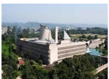
ਨੇਤਾ ਤੋਂ ਬਿਨਾਂ ਚੱਲੇਗੀ।