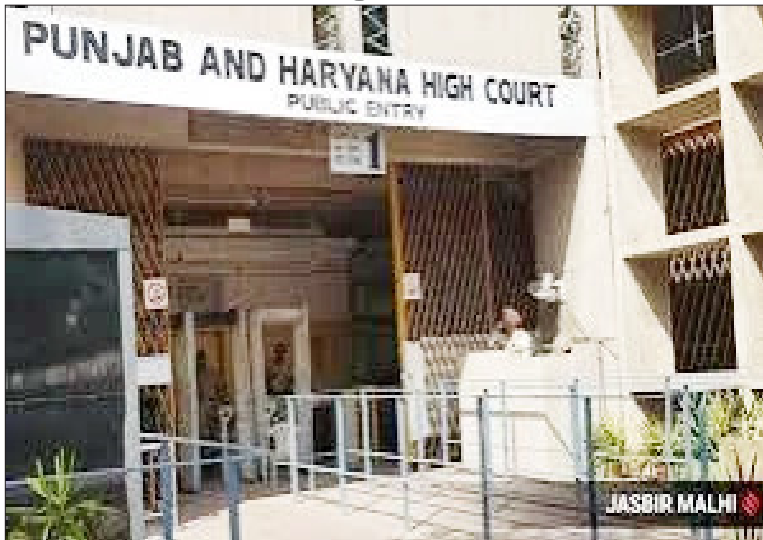
ਦੇ ਕੇ ਜਵਾਬ ਦਿੱਤਾ ਜਾਵੇਗਾ। ਇਸ ਤੋਂ ਇਲਾਵਾ ਐਨਐਸਏ ਨੂੰ ਚੁਣੌਤੀ ਦੇਣ ਵਾਲੇ ਸਾਰੇ ਮੁਲਜ਼ਮਾਂ ਦੇ ਵਕੀਲਾਂ ਨੂੰ ਅਗਲੀ ਸੁਣਵਾਈ 'ਤੇ ਆਪਣੇ ਨੁਕਤੇ ਲਿਆਉਣ ਲਈ ਕਿਹਾ ਗਿਆ ਹੈ, ਹੁਣ ਇਸ ਮਾਮਲੇ ਤੇ ਅਗਲੀ ਸੁਣਵਾਈ 4 ਦਸੰਬਰ ਨੂੰ ਹੋਵੇਗੀ।

ਚੰਡੀਗੜ੍ਹ-(ਲੋਕ ਬਾਣੀ) ਆਸਾਮ ਦੀ ਡਿਬਰੂਗੜ੍ਹ ਜੇਲ੍ਹ ਵਿੱਚ ਬੰਦ ਵਾਰਿਸ ਪੰਜਾਬ ਦੇ ਮੁੱਖੀ ਅਤੇ ਖਡੂਰ ਸਾਹਿਬ ਤੋਂ ਸੰਸਦ ਮੈਂਬਰ ਅੰਮ੍ਰਿਤਪਾਲ ਸਿੰਘ ਦੇ ਸਾਥੀਆਂ 'ਤੇ ਮੁੜ ਲਾਏ ਗਏ ਕੌਮੀ ਸੁਰੱਖਿਆ ਕਾਨੂੰਨ (ਐਨਐਸਏ) ਕੇਸ ਵਿੱਚ ਅੱਜ (ਮੰਗਲਵਾਰ) ਪੰਜਾਬ ਅਤੇ ਹਰਿਆਣਾ ਹਾਈ ਕੋਰਟ ਵਿੱਚ ਅਹਿਮ ਸੁਣਵਾਈ ਹੋਈ। ਇਸ ਦੌਰਾਨ ਅਦਾਲਤ ਨੇ ਸਰਕਾਰ ਤੋਂ ਪੁੱਛਿਆ ਕਿ ਜਦੋਂ ਡੀਸੀ ਨੇ ਅੰਮ੍ਰਿਤਪਾਲ ਸਿੰਘ ਤੇ 13 ਮਾਰਚ ਨੂੰ ਐਨਐਸਏ ਲਗਾਉਣ ਦੇ ਹੁਕਮ ਦਿੱਤੇ ਸਨ ਤਾਂ ਫਿਰ ਇਸ ਨੂੰ ਲਾਗੂ ਕਰਨ ਵਿੱਚ 10 ਦਿਨਾਂ ਦੀ ਦੇਰੀ ਕਿਉਂ ਕੀਤੀ ਗਈ। ਅਦਾਲਤ ਨੇ ਕੇਂਦਰ ਅਤੇ ਪੰਜਾਬ ਸਰਕਾਰਾਂ ਨੂੰ ਕਿਹਾ ਹੈ ਕਿ ਇਸ ਸਬੰਧੀ ਹੁਣ ਤੱਕ ਜੋ ਵੀ ਹੁਕਮ ਜਾਰੀ ਕੀਤੇ ਗਏ ਹਨ, ਉਨ੍ਹਾਂ ਨੂੰ ਅਗਲੀ ਸੁਣਵਾਈ ਵਿੱਚ ਪੇਸ਼ ਕੀਤਾ ਜਾਵੇ। ਇਸ ਦੇ ਨਾਲ ਹੀ ਪੰਜਾਬ ਸਰਕਾਰ ਨੇ ਕਿਹਾ ਹੈ ਕਿ ਦਸ ਦਿਨ ਦੀ ਦੇਰੀ ਬਾਰੇ ਹਲਫ਼ਨਾਮਾ