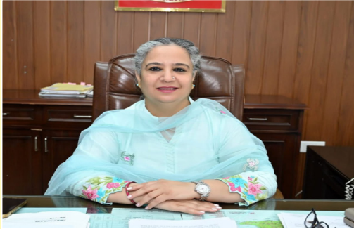
ਬਰਨਾਲਾ, (ਲੋਕ ਬਾਣੀ)

ਵਿਧਾਨ ਸਭਾ ਹਲਕਾ 103 ਬਰਨਾਲਾ ਦੀ ਉਪ ਚੋਣ ਸਬੰਧੀ ਕੁੱਲ 20 ਨਾਮਜ਼ਦਗੀਆਂ ਦਾਖਲ ਹੋਈਆਂ ਹਨ।