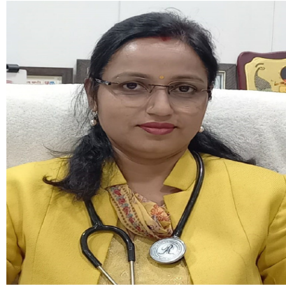
ਨਹੀਂ ਦੇ ਪਾ ਰਹੀਆਂ, ਇਹ ਵੀ ਸਭ ਤੋਂ ਵੱਡਾ ਕਾਰਨ ਹੈ ਛਾਤੀ ਕੈਂਸਰ ਦੇ ਕਾਰਨ ਹੋ ਸਕਦੇ ਹਨ।