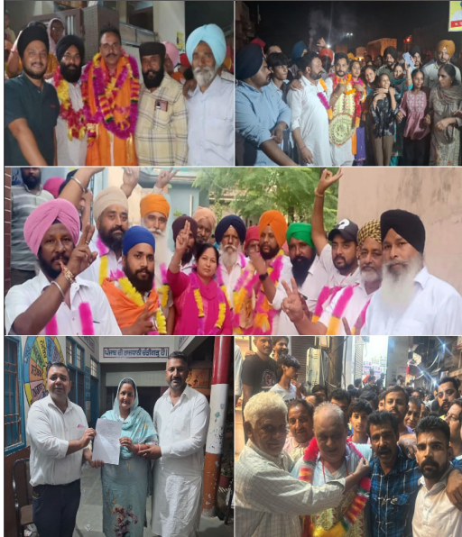
ਲਿਆ। ਇਸ ਤੋਂ ਇਲਾਵਾ ਕਈ ਪਿੰਡਾਂ ਵਿੱਚ ਵੋਟਿੰਗ ਦੇਰ ਸ਼ਾਮ ਤੱਕ ਜਾਰੀ ਰਹੀ ਜਿਸ ਕਾਰਨ ਕਈ ਪਿੰਡਾਂ ਦੇ ਨਤੀਜੇ ਆਉਣ ਵਿੱਚ ਦੇਰ ਹੋਈ।