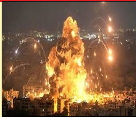
ਲਗਾਤਾਰ ਵੱਜਦੇ ਹਰੇ। ਇਸ ਦੌਰਾਨ ਲੋਕ ਬੰਬ ਸ਼ੈਲਟਰਾਂ ਵਿੱਚ ਲੁਕੇ ਹੋਏ ਦੇਖੇ ਗਏ।

ਤੇਲ ਅਵੀਵ ਲੋਕ ਬਾਣੀ- ਸੋਮਵਾਰ ਨੂੰ ਇਜ਼ਰਾਈਲ ਤੇ ਪਿਛਲੇ ਇਕ ਹਫ਼ਤੇ ਚ ਦੂਜਾ ਸਭ ਤੋਂ ਵੱਡਾ ਹਮਲਾ ਹੋਇਆ। ਇਸ ਵਾਰ ਲਿਬਨਾਨ ਤੋਂ ਹਿਜ਼ਬੁੱਲਾ ਨੇ ਇਜ਼ਰਾਈਲ ਦੇ ਹਾਇਫਾ ਇਲਾਕੇ ਚ ਘੱਟੋ-ਘੱਟ 135 ਫਾਈ-1 ਮਿਜ਼ਾਈਲਾਂ ਦਾਗੀਆਂ ਹਨ। ਹਾਇਫਾ ਇਜ਼ਰਾਈਲ ਦਾ ਤੀਜਾ ਸਭ ਤੋਂ ਵੱਡਾ ਸ਼ਹਿਰ ਹੈ। ਇਸ ਹਮਲੇ ਚ 10 ਤੋਂ ਵੱਧ ਲੋਕ ਜ਼ਖ਼ਮੀ ਹੋਏ ਹਨ। ਇਨ੍ਹਾਂ ਹਮਲਿਆਂ ਤੋਂ ਬਾਅਦ ਹਫ਼ਤਾ-ਦਫ਼ਤੀ ਮਚ ਗਈ। ਸਾਇਰਨ