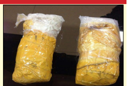
ਨਜ਼ਦੀਕ ਕੰਡਿਆਂ ਵਾਲੀ ਤਾਰ ਤੇ ਕੀਤੀ ਜਾ ਰਹੀ ਗਸ਼ਤ ਦੌਰਾਨ ਮਿਲਿਆ ਹੈ।

ਅੰਮ੍ਰਿਤਸਰ, ਲੋਕ ਬਾਣੀ-- ਪਾਕਿਸਤਾਨੀ ਤਸਕਰਾਂ ਵਲੋਂ ਅੱਜ ਅਟਾਰੀ ਸਰਹੱਦ ਦੇ ਖੇਤਰ ਅੰਦਰ ਸਾਹਮਣੇ ਪਾਕਿਸਤਾਨ ਵਾਲੇ ਪਾਸਿਓਂ ਭਾਰਤੀ ਖੇਤਰ ਅੰਦਰ ਸੁੱਟਿਆ ਇਕ ਪੈਕਟ ਹੈਰੋਇਨ ਦਾ ਬਰਾਮਦ ਹੋਇਆ ਹੈ 9 ਇਹ ਪੈਕਟ ਬੀ ਐਸ ਐਫ. ਦੀ ਟੁਕੜੀ ਵਲੋਂ ਅਟਾਰੀ ਸਰਹੱਦ ਦੇ