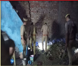
ਅਧਿਆਪਕ ਆਪਣੇ ਪਰਿਵਾਰ ਨਾਲ ਕਿਰਾਏ ਦੇ ਮਕਾਨ ਵਿਚ ਰਹਿੰਦਾ ਸੀ।

ਅਮੇਨੀ, ਲੋਕ ਬਾਣੀ- ਯੂਪੀ ਦੇ ਅਮੇਨੀ ਤੋਂ ਇਕ ਵੱਡੀ ਘਟਨਾ ਸਾਹਮਣੇ ਆ ਰਹੀ ਹੈ। ਜਿੱਥੇ ਬਦਮਾਸ਼ਾਂ ਨੇ ਘਰ 'ਚ ਦਾਖਲ ਹੋ ਕੇ ਅਧਿਆਪਕ ਸਮੇਤ ਪੂਰੇ ਪਰਿਵਾਰ ਨੂੰ ਗੋਲੀ ਮਾਰ ਦਿੱਤੀ। ਜਾਣਕਾਰੀ ਮੁਤਾਬਿਕ ਅਧਿਆਪਕ, ਉਸ ਦੀ ਪਤਨੀ ਅਤੇ ਦੋਵੇਂ ਬੱਚਿਆਂ ਦੀ ਮੌਕੇ 'ਤੇ ਹੀ ਮੌਤ ਹੋ ਗਈ। ਮੌਕੇ 'ਤੇ ਸਥਾਨਕ ਪੁਲਿਸ ਤੋਂ ਇਲਾਵਾ ਕਈ ਥਾਣਿਆਂ ਦੇ ਬਲ ਮਜ਼ਦੂਰ ਹਨ।