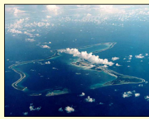
ਆਪਣੇ ਰੁਖ ਦਾ ਸਮਰਥਨ ਕਰਦੇ ਹੋਏ, ਸਿਧਾਂਤਕ ਮਾਰੀਸ਼ਸੀਅਨ ਸਥਿਤੀ ਦਾ ਮਜ਼ਬੂਤੀ ਨਾਲ ਸਮਰਥਨ ਕੀਤਾ।

ਨਵੀਂ ਦਿੱਲੀ, ਲੋਕ ਬਾਣੀ- ਭਾਰਤ ਨੇ ਅੱਜ ਯੂਨਾਈਟਿਡ ਕਿੰਗਡਮ ਅਤੇ ਮਾਰੀਸ਼ਸ ਵਿਚਕਾਰ ਚਾਰਜ਼ ਦੀਪ ਸਮੂਹ ਸਮਝੌਤੇ ਦੇ ਪਿਛੋਕੜ ਵਿਚ ਇਕ ਸ਼ਾਂਤ ਪਰ ਮਹੱਤਵਪੂਰਨ ਭੂਮਿਕਾ ਨਿਭਾਈ ਹੈ। ਭਾਰਤ ਨੇ ਡਿਕਲੇਨਾਈਜ਼ੇਸ਼ਨ ਦੇ ਆਖਰੀ ਨਿਸ਼ਾਨਾਂ ਨੂੰ ਖ਼ਤਮ ਕਰਨ ਦੀ ਜ਼ਰੂਰਤ ਤੇ