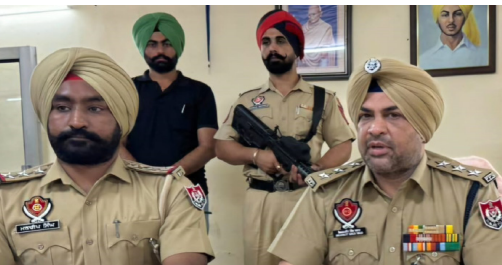
ਸ਼ੱਕੀ ਵਿਅਕਤੀ ਰਹਿ ਰਿਹਾ ਹੈ ਤਾਂ ਉਸਦੀ ਪੁਲਿਸ ਨੂੰ ਸੂਚਨਾ ਦਿੱਤੀ ਜਾਵੇਗੀ। ਸੂਚਨਾ ਦੇਣ ਵਾਲੇ ਦੀ ਪਛਾਣ ਗੁਪਤ ਰੱਖੀ ਜਾਵੇਗੀ।