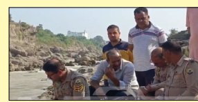
ਲਈ ਹੈ, ਜਦੋਂਕਿ ਐਨ.ਡੀ.ਆਰ.ਐਫ. ਟੀਮ ਵਲੋਂ ਦਰਿਆ ਵਿਚ ਪੁੱਤਰ ਦੀ ਭਾਲ ਜਾਰੀ ਹੈ। ਮੌਕੇ ਤੇ ਮੌਜੂਦ ਲੋਕਾਂ ਨੇ ਦੱਸਿਆ ਕਿ ਦੁਪਹਿਰ ਸਮੇਂ ਪਿਤਾ-ਪੁੱਤਰ ਪੂਜਾ ਸਮੱਗਰੀ ਪ੍ਰਵਾਹ ਕਰਨ ਲਈ ਘਰ ਤੋਂ ਚੱਕੀ ਦਰਿਆ ਆਏ ਸਨ