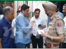
ਜਿਸ ਤੋਂ ਬਾਅਦ ਮੌਕੇ ਉਤੇ ਪਹੁੰਚੀ ਪੁਲਿਸ ਵੀ ਇਸ ਮਾਮਲੇ ਦੀ ਜਾਂਚ ਕਰ ਰਹੀ ਹੈ। ਦੂਜੇ ਪਾਸੇ ਇਸ ਮਾਮਲੇ ਵਿਚ ਮੌਕੇ ਉਤੇ ਪਹੁੰਚੇ ਪੁਲਿਸ ਅਧਿਕਾਰੀਆਂ ਦਾ ਕਹਿਣਾ ਹੈ

ਪੰਜਾਬ ਵਿੱਚ ਫੈਕਟਰੀ ਚ ਹੋਇਆ ਧਮਾਕਾ ਕਈ ਜ਼ਖਮੀ ਅੰਮ੍ਰਿਤਸਰ, ਲੋਕ ਬਾਣੀ--ਬਟਾਲਾ ਰੋਡ ਪਿੱਲਰ ਨੰਬਰ 54 ਨੇੜੇ ਫੈਕਟਰੀ ਵਿਚ ਧਮਾਕਾ ਹੋਇਆ ਹੈ। ਬਲਾਸਟ ਵਿਚ ਤਿੰਨ ਲੋਕ ਜ਼ਖਮੀ ਹੋਏ ਹਨ। ਦੱਸ ਦਈਏ ਕਿ ਅੰਮ੍ਰਿਤਸਰ-ਬਟਾਲਾ ਰੋਡ ਕੁੱਲੂ ਮਿੱਲ ਵਾਲੀ ਗਲੀ ਵਿਚ ਉਸ ਵੇਲੇ ਹਫ਼ਤਾ-ਦਫ਼ਤੀ ਮੱਚ ਗਈ ਜਦੋਂ ਇੱਕ ਮੈਡੀਸਨ ਦੀ ਫੈਕਟਰੀ ਵਿਚ ਵੱਡਾ ਧਮਾਕਾ ਹੋ ਗਿਆ ਅਤੇ ਇਹ ਧਮਾਕਾ ਇੰਨਾ ਜ਼ਬਰਦਸਤ ਸੀ ਕਿ ਗਲੀ ਵਿਚ ਕਈ ਘਰਾਂ ਦੇ ਕੱਚ ਦੇ ਸ਼ੀਸ਼ੇ ਟੁੱਟ ਗਏ ਤੇ ਤਿੰਨ ਦੇ ਕਰੀਬ ਲੋਕ ਜ਼ਖਮੀ ਹੋ ਗਏ,