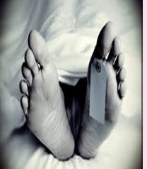
ਨੇ ਦੱਸਿਆ ਕਿ ਲਾਸ਼ਾਂ ਨੂੰ ਪੋਸਟਮਾਰਟਮ ਲਈ ਭੇਜ ਦਿੱਤਾ ਹੈ।

ਯੂ ਪੀ ਚ ਵਾਪਰੀਆਂ ਸੜਕ ਹਾਦਸਾ ਦੋ ਭਰਾਵਾਂ ਦੀ ਹੋਈ ਮੌਤ ਕਨੌਜ (ਉੱਤਰ ਪ੍ਰਦੇਸ਼), ਲੋਕ ਬਾਣੀ--ਉੱਤਰ ਪ੍ਰਦੇਸ਼ ਦੇ ਕਨੌਜ ਵਿਚ ਮਕਾਨ ਡਿੱਗਣ ਨਾਲ 2 ਸਕੇ ਭਰਾਵਾਂ ਦੀ ਮੌਤ ਹੋ ਗਈ ਤੇ 4 ਜ਼ਖਮੀ ਹੋ ਗਏ। ਇਹ ਘਟਨਾ ਇਦਰਗੜ੍ਹ ਇਲਾਕੇ ਦੇ ਇੱਕ ਪਿੰਡ ਵਿਚ ਵਾਪਰੀ। ਐਸ ਐਚ ਓ. ਨੇ ਕਿਹਾ ਕਿ ਮਕਾਨ ਢਹਿਣ ਨਾਲ ਪਿੰਡ ਵਿਚ ਸਹਿਮ ਪਸਰ ਗਿਆ। ਜ਼ਖਮੀਆਂ ਨੂੰ ਰੋਕਰ ਕਰ ਦਿੱਤਾ ਹੈ। ਪੁਲਿਸ