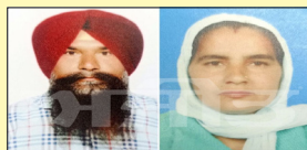
ਬਚਾਉਣ ਦੀ ਕੋਸ਼ਿਸ਼ ਕੀਤੀ ਪਰ ਉਹ ਵੀ ਪਤੀ ਦੇ ਮਗਰ ਸਰੋਵਰ ਦੇ ਪਾਣੀ ਵਿਚ ਡੁੱਬ ਗਈ। ਪਿੰਡ ਦੀ ਸੰਗਤ ਨੇ ਜਦੋਂ ਦੋਵੇਂ ਪਤੀ-ਪਤਨੀ ਦੀਆਂ ਲਾਸ਼ਾਂ ਤੈਰਦੀਆਂ ਵੇਖੀਆਂ ਤਾਂ ਸਾਰੇ ਹੀ ਖੌਫ਼ ਵਿਚ ਆ ਗਏ।

ਧਾਰਮਿਕ ਸਥਾਨ ਦੇ ਸਰੋਵਰ ਵਿੱਚ ਡੁੱਬਣ ਨਾਲ ਪਤੀ ਪਤਨੀ ਦੀ ਹੋਈ ਮੌਤ ਬਟਾਲਾ, ਲੋਕ ਬਾਣੀ--ਬਾਣਾ ਕਾਦੀਆਂ ਆਪੀਨ ਪੈਂਦੇ ਪਿੰਡ ਲੀਲੂ ਕਲਾਂ ਵਿਖੇ ਅੱਜ ਇੱਕ ਮੰਦਰਾਗੀ ਘਟਨਾ ਸਾਹਮਣੇ ਆਈ ਹੈ। ਜਾਣਕਾਰੀ ਅਨੁਸਾਰ ਗੁਰਦੁਆਰਾ ਮੱਕਾ ਸਾਹਿਬ ਵਿਖੇ ਨਜ਼ਦੀਕੀ ਪਿੰਡ ਕੰਡੀਲੇ ਤੋਂ ਇੱਕ ਜੋੜਾ ਜੋ ਕਿ ਗੁਰਦੁਆਰਾ ਸਾਹਿਬ ਵਿਖੇ ਆਪਣੇ ਮੰਦਰਸਾਈਕਲ ਉੱਤੇ ਸਵਾਰ ਹੋ ਕੇ ਮੱਥਾ ਟੇਕਣ ਆਇਆ ਸੀ, ਜਦੋਂ ਪਤੀ ਸਰੋਵਰ ਵਿਚ ਇਸ਼ਨਾਨ ਕਰਨ ਲਈ ਵੱਝਿਆ ਤਾਂ ਅਚਾਨਕ ਉਹ ਡੁੱਬਣ ਲੱਗ ਪਿਆ ਤਾਂ ਉਸ ਦੀ ਪਤਨੀ ਨੇ ਆਪਣੀ ਚੁੰਨੀ ਨਾਲ ਉਸ ਨੂੰ