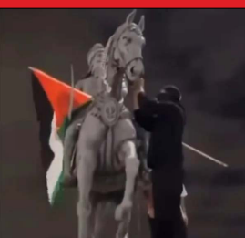
ਕਥਿਤ ਛੇੜ-ਛਾੜ ਵੀ ਕੀਤੀ।

ਕੈਨੇਡਾ ਵਿੱਚ ਫਲਸਤੀਨ ਸਮਰਥਕਾਂ ਨੇ ਮਹਾਰਾਜਾ ਰਣਜੀਤ ਸਿੰਘ ਦੇ ਬੁੱਤ ਨਾਲ ਕੀਤੀ ਛੇੜ ਛਾੜ ਵੈਨਕੂਵਰ, ਲੋਕ ਬਾਣੀ-- ਫਲਸਤੀਨ ਦੇ ਗਾਜ਼ਾ ਵਿੱਚ ਹਮਲਿਆਂ ਦਾ ਇੱਕ ਸਾਲ ਪੂਰਾ ਹੋਣ ਮੌਕੇ ਕੈਨੇਡਾ ਵਿੱਚ ਇਜ਼ਰਾਈਲ ਖਿਲਾਫ਼ ਰੋਸ ਵਿਖਾਵੇ ਕੀਤੇ ਜਾ ਰਹੇ ਹਨ। ਇਸ ਦੌਰਾਨ ਬੀਤੀ ਸ਼ਾਮ ਮਿਸੀਸਾਗਾ ਸ਼ਹਿਰ ਵਿੱਚ ਮਹਾਰਾਜਾ ਰਣਜੀਤ ਸਿੰਘ ਦੇ ਬੁੱਤ ਨਾਲ ਫਲਸਤੀਨੀ ਝੰਡਾ ਬੰਨ੍ਹ ਦਿੱਤਾ ਗਿਆ। ਕੁਝ ਵਿਖਾਵਾਕਾਰੀਆਂ ਨੇ ਮਿਸੀਸਾਗਾ ਸ਼ਹਿਰ ਦੀ ਡਰਿਉ ਰੋਡ ਸਥਿਤ ਗਰੇਟ ਪੰਜਾਬ ਪਲਾਜ਼ੇ ਵਿੱਚ ਲੱਗੇ ਆਚਮ ਕੱਚ ਅਕਾਰੀ ਘੰਟੇ 'ਤੇ ਸਵਾਰ ਮਹਾਰਾਜਾ ਰਣਜੀਤ ਸਿੰਘ ਦੇ ਬੁੱਤ ਨਾਲ