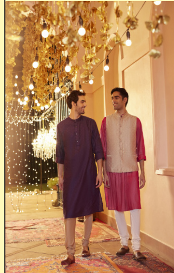
ਕਰੋ, ਅਤੇ ਨਵਰਾਤਰੀ ਦੇ ਹਰ ਦਿਨ ਨੂੰ ਵਿਲੱਖਣ ਬਣਾਓ।

ਇਸ ਵਿੱਚ ਰਵਾਇਤੀ ਕਾਰੀਗਰੀ ਨੂੰ ਆਧੁਨਿਕ ਸ਼ੈਲੀ ਨਾਲ ਜੋੜਿਆ ਗਿਆ ਹੈ। ਨਵਰਾਤਰੀ ਦੇ ਅਨੁਸਾਰ ਰੰਗਾਂ ਵਿੱਚ ਸੂਤੀ ਅਤੇ ਸਿਲਕ ਦੇ ਮਿਸ਼ਰਣ ਵਾਲੇ ਕੁਰਤੇ ਖਰੀਦ ਸਕਦੇ ਹੋ। ਉਹਨਾਂ ਨੂੰ ਚੁੜੀਦਾਰ ਜਾਂ ਧੋਤੀ ਨਾਲ ਜੋੜੋ, ਅਤੇ ਹਰ ਨਵਰਾਤਰੀ ਜਸ਼ਨ ਨੂੰ ਬੇਦਗਲਾ ਜੋਕਟਾਂ ਅਤੇ ਕਮਰਕੋਟਾਂ ਨਾਲ ਵਿਸ਼ੇਸ਼ ਬਣਾਓ। ਬੱਚਿਆਂ ਲਈ ਫੈਬਇੰਡੀਆ ਦਾ ਨਸਲੀ ਪਹਿਰਾਵੇ ਦਾ ਸੰਗ੍ਰਹਿ ਆਰਾਮ ਅਤੇ ਸ਼ੈਲੀ ਦਾ ਸੁਮੇਲ ਹੈ। ਲੜਕਿਆਂ ਲਈ ਕੁੜਤੇ ਅਤੇ ਧੋਤੀਆਂ ਹਨ ਅਤੇ ਕੁੜੀਆਂ ਲਈ ਆਕਰਸ਼ਕ ਡਿਜ਼ਾਈਨ ਕੀਤੇ ਲਹਿੰਗੇ ਅਤੇ ਅਨਾਰਕਲੀ ਸੌਟ ਹਨ। ਹਰੇਕ ਪਹਿਰਾਵੇ ਨੂੰ ਨਰਮ-ਨਰਮ ਫੈਬਇੰਡੀਆ ਤੋਂ ਬਣਾਇਆ ਗਿਆ ਹੈ ਤਾਂ ਜੋ ਇਹ ਨਾ ਸਿਰਫ ਬੱਚਿਆਂ ਲਈ ਆਰਾਮਦਾਇਕ ਹੋਵੇ, ਸਗੋਂ ਉਹਨਾਂ ਨੂੰ ਤਿਉਹਾਰਾਂ ਦਾ ਦਿੱਖ ਵੀ ਬਣਾਉਂਦਾ ਹੈ। ਫੈਬਇੰਡੀਆ ਦੇ ਨਵਰਾਤਰੀ ਤੋਂ ਪ੍ਰੇਰਿਤ ਸੁਨਹਿਰੀ ਫੈਬਰਿਕ ਕਲੈਕਸ਼ਨ ਵਿੱਚੋਂ ਚੁਣੋ। ਆਪਣੇ ਪੂਜਾ ਸਥਾਨ ਨੂੰ ਪਿੱਤਲ ਅਤੇ ਤਾਂਬੇ ਦੀਆਂ ਪੂਜਾ ਪਲੇਟਾਂ, ਪ੍ਰਥੂ ਸ਼ੈਲੀ ਧਾਰਕਾਂ ਅਤੇ ਤੇਲ ਦੇ ਦੀਵੇ (ਦੀਵੇ) ਨਾਲ ਸਜਾ ਕੇ ਵੀ ਨਵਰਾਤਰੀ ਦੀ ਪੂਜਾ ਨੂੰ ਹੋਰ ਵੀ ਵਿਸ਼ੇਸ਼ ਬਣਾ ਸਕਦੇ ਹੋ। ਫੈਬਇੰਡੀਆ ਦੇ ਨਿੱਜੀ ਦੇਖਭਾਲ ਉਤਪਾਦ ਤਿਉਹਾਰਾਂ ਦੇ ਸੀਜ਼ਨ ਦੌਰਾਨ ਤੁਹਾਨੂੰ ਤਾਜ਼ਗੀ ਮਹਿਸੂਸ ਕਰਨਗੇ। ਖੁਸ਼ਬੂਦਾਰ ਤੇਲ, ਸਾਬਣ, ਅਤੇ ਬਾਡੀ ਲੌਸਨ ਸਮੇਤ ਜ਼ਹਿਰ-ਮੁਕਤ ਚਮੜੀ ਦੀ ਦੇਖਭਾਲ ਅਤੇ ਇਸ਼ਨਾਨ ਦੀਆਂ ਜ਼ਰੂਰੀ ਚੀਜ਼ਾਂ ਲਈ ਆਪਣੇ ਆਪ ਦਾ ਇਲਾਜ