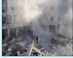
ਹਮਲਿਆਂ ਵਿੱਚ ਹਿਜ਼ਬੁੱਲਾ ਦੇ ਕਈ ਸੀਨੀਅਰ ਕਮਾਂਡਰ ਮਾਰੇ ਗਏ ਹਨ। ਬੁੱਕਰਵਾਰ ਨੂੰ ਬੈਰੂਤ ਵਿੱਚ ਸਮੂਹ ਦਾ ਮੁਖੀ ਹਸਨ ਨਸਰੁੱਲਾ ਵੀ ਮਾਰਿਆ ਗਿਆ ਸੀ।