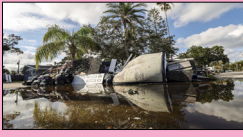
ਮੈਕਸੀਕੋ ਦੇ ਸਭ ਤੋਂ ਗਰੀਬ ਇਲਾਕੇ ਗੁਆਰੇਰੋ ਚ ਦੇਖਣ ਨੂੰ ਮਿਲਿਆ, ਜਿੱਥੇ ਇਸ ਕਾਰਨ ਕਰੀਬ 18 ਲੋਕਾਂ ਦੀ ਮੌਤ ਹੋ ਗਈ। ਸਥਾਨਕ ਮੀਡੀਆ ਅਨੁਸਾਰ ਇਨ੍ਹਾਂ ਵਿੱਚੋਂ ਬਹੁਤ ਸਾਰੀਆਂ ਮੌਤਾਂ ਦੱਖਣ ਵਿੱਚ ਓਆਕਸਾਕਾ ਵਿੱਚ ਤਿੰਨ ਮੌਤਾਂ ਹੋਈਆਂ ਹਨ

ਅਮਰੀਕਾ ਵਿੱਚ ਆਇਆ ਤੂਫ਼ਾਨ 50 ਲੋਕਾਂ ਦੀ ਹੋਈ ਮੌਤ ਅਮਰੀਕਾ, ਲੋਕ ਬਾਣੀ --ਚੱਕਰਵਾਤੀ ਤੂਫ਼ਾਨ ਹੋਲੇਨ ਕਾਰਨ ਅਮਰੀਕਾ ਵਿੱਚ 50 ਤੋਂ ਵੱਧ ਲੋਕਾਂ ਦੀ ਮੌਤ ਹੋ ਗਈ ਹੈ। ਹਜ਼ਾਰਾਂ ਲੋਕ ਬੇਘਰ ਦੱਸੇ ਜਾਂਦੇ ਹਨ। ਇਸ ਦੇ ਨਾਲ ਹੀ ਮੈਕਸੀਕੋ ਚ ਚੱਕਰਵਾਤੀ ਤੂਫ਼ਾਨ ਜੌਨ ਨੇ ਤਬਾਹੀ ਮਚਾਈ ਹੈ। ਦੱਖਣ-ਪੱਛਮੀ ਮੈਕਸੀਕੋ ਵਿੱਚ ਸ਼ਨੀਵਾਰ ਇਸ ਕਾਰਨ ਕਰੀਬ 18 ਲੋਕਾਂ ਦੀ ਮੌਤ ਪਈ। ਇਸ ਤੂਫ਼ਾਨ ਦਾ ਅਸਰ ਕਰੀਬ ਇੱਕ ਹਫ਼ਤੇ ਤੋਂ ਦਿਖਾਈ ਦੇ ਰਿਹਾ ਹੈ, ਜਿਸ ਚ ਕਰੀਬ 22 ਲੋਕਾਂ ਦੇ ਮਾਰੇ ਜਾਣ ਦੀ ਖ਼ਬਰ ਹੈ। ਇਸ ਤੂਫ਼ਾਨ ਦਾ ਸਭ ਤੋਂ ਬੁਰਾ ਪ੍ਰਭਾਵ