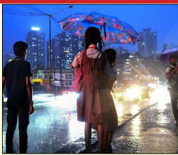
ਦਾ ਐਲਾਨ ਕੀਤਾ ਗਿਆ ਹੈ।

ਮੁੰਬਈ ਵਿਚ ਅੱਜ ਸਕੂਲ ਕਾਲਜ ਰਹਿਣਗੇ ਬੰਦ ਮੁੰਬਈ, ਲੋਕ ਬਾਣੀ --ਭਾਰਤੀ ਮੌਸਮ ਵਿਭਾਗ (ਆਈ.ਐਮ. ਡੀ.) ਨੇ ਮੁੰਬਈ ਲਈ ਰੈੱਡ ਅਲਰਟ ਜਾਰੀ ਕੀਤਾ ਹੈ। ਇਸ ਦੇ ਮੱਦੇਨਜ਼ਰ, ਵਿਦਿਆਰਥੀਆਂ ਦੀ ਸੁਰੱਖਿਆ ਨੂੰ ਧਿਆਨ ਵਿਚ ਰੱਖਦੇ ਹੋਏ, ਕੱਲ੍ਹ ਵੀਰਵਾਰ, 26 ਸਤੰਬਰ ਨੂੰ ਮੁੰਬਈ ਦੇ ਸਾਰੇ ਸਕੂਲਾਂ ਅਤੇ ਕਾਲਜਾਂ ਵਿਚ ਛੁੱਟੀ