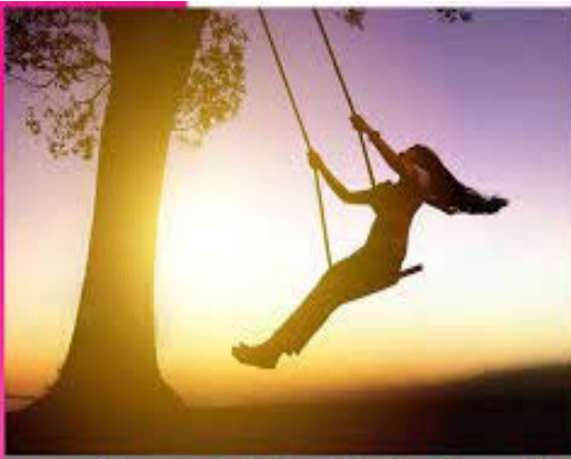
ਖੁਸ਼ ਰਹਿਣਾ ਹੀ ਜ਼ਿੰਦਗੀ ਦੀ ਸੰਗਤ ਹੈ