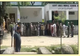
ਚੋਂ 20 ਹਲਕਿਆਂ ਤੇ 2014 ਦੀਆਂ ਵਿਧਾਨ ਸਭਾ ਚੋਣਾਂ ਦੇ ਮੁਕਾਬਲੇ ਮਤਦਾਨ ਥੋੜ੍ਹਾ ਘੱਟ ਰਿਹਾ, ਜਦੋਂ ਕਿ ਕੁੱਲ ਮਤਦਾਨ 60 ਫੀਸਦੀ ਸੀ।

ਜੰਮੂ ਕਸ਼ਮੀਰ ਵਿਚ ਦੂਜੇ ਪੜਾਅ ਦੀਆਂ ਚੋਣਾਂ ਦੌਰਾਨ 56 ਫੀਸਦੀ ਵੋਟਿੰਗ ਹੋਈ ਜੰਮੂ ਕਸ਼ਮੀਰ, ਲੋਕ ਬਾਣੀ-ਜੰਮੂ-ਕਸ਼ਮੀਰ ਵਿਧਾਨ ਸਭਾ ਚੋਣਾਂ ਦੇ ਦੂਜੇ ਪੜਾਅ 'ਚ ਬੁੱਧਵਾਰ ਨੂੰ 26 ਸੀਟਾਂ ਤੇ 56 ਫੀਸਦੀ ਤੋਂ ਵੱਧ ਵੋਟਾਂ ਨੇ ਆਪਣੀ ਵੋਟ ਦਾ ਇਸਤੇਮਾਲ ਕੀਤਾ। ਅਧਿਕਾਰੀਆਂ ਦਾ ਕਹਿਣਾ ਹੈ ਕਿ ਸਖ਼ਤ ਸੁਰੱਖਿਆ ਪ੍ਰਬੰਧਾਂ ਵਿਚਕਾਰ ਵੋਟਿੰਗ ਸ਼ਾਂਤੀਪੂਰਨ ਰਹੀ। ਛੇ ਜ਼ਿਲ੍ਹਿਆਂ ਦੀਆਂ 26 ਸੀਟਾਂ ਵਾਲੇ ਅਹਿਮ ਹਲਕਿਆਂ ਦੇ ਪੋਲਿੰਗ ਸਟੇਸ਼ਨਾਂ ਤੇ ਸਵੇਰ ਤੋਂ ਹੀ ਵੋਟਾਂ ਦੀਆਂ ਲੰਬੀਆਂ ਕਤਾਰਾਂ ਦੇਖਣ ਨੂੰ ਮਿਲੀਆਂ, ਪਰ ਇਨ੍ਹਾਂ