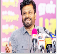
ਅਗਸਤ 2020 ਵਿਚ ਪਿਛਲੀ ਸੰਸਦ ਦਾ ਗਠਨ ਕੀਤਾ ਗਿਆ ਸੀ। ਇਸ ਨੂੰ ਨਿਰਧਾਰਤ ਸਮੇਂ ਤੋਂ 11 ਮਹੀਨੇ ਪਹਿਲਾਂ ਭੰਗ ਕਰ ਦਿੱਤਾ ਗਿਆ

ਨਵੇਂ ਬਣੇ ਸ਼੍ਰੀ ਲੰਕਾ ਦੇ ਰਾਸ਼ਟਰਪਤੀ ਨੇ ਸੰਸਦ ਨੂੰ ਕੀਤਾ ਭੰਗ ਦਿੱਲੀ, ਲੋਕ ਬਾਣੀ-ਸ਼੍ਰੀਲੰਕਾ ਦੇ ਰਾਸ਼ਟਰਪਤੀ ਅਨੁਰਾ ਕੁਮਾਰਾ ਦਿਸਾਨਾਇਕ ਨੇ ਸੰਸਦ ਨੂੰ ਭੰਗ ਕਰ ਦਿੱਤਾ ਹੈ। ਸ਼੍ਰੀਲੰਕਾ ਦੇ ਨਵ-ਨਿਯੁਕਤ ਰਾਸ਼ਟਰਪਤੀ ਅਨੁਰਾ ਕੁਮਾਰਾ ਦਿਸਾਨਾਇਕ ਨੇ ਸੰਸਦ ਨੂੰ ਭੰਗ ਕਰਨ ਸੰਬੰਧੀ ਵਿਸ਼ੇਸ਼ ਗਜ਼ਟ ਨੋਟੀਫਿਕੇਸ਼ਨ ਤੇ ਦਸਤਖ਼ਤ ਕੀਤੇ। ਮੰਗਲਵਾਰ ਅੱਧੀ ਰਾਤ ਤੋਂ ਸੰਸਦ ਭੰਗ ਹੋ ਜਾਵੇਗੀ ਅਤੇ 14 ਨਵੰਬਰ ਨੂੰ ਚੋਣਾਂ ਹੋਣਗੀਆਂ। ਸ਼ਨੀਵਾਰ ਨੂੰ ਸ਼੍ਰੀਲੰਕਾ ਦੇ ਰਾਸ਼ਟਰਪਤੀ ਚੋਣ ਤੋਂ ਪਹਿਲਾਂ, ਦਿਸਾਨਾਇਕ ਨੇ ਕਿਹਾ ਸੀ ਕਿ ਉਹ ਤੁਰੰਤ ਸੰਸਦ ਨੂੰ ਭੰਗ ਕਰ ਦੇਣਗੇ ਅਤੇ ਤੁਰੰਤ ਚੋਣਾਂ ਦਾ ਆਦੇਸ਼ ਦੇਣਗੇ। ਇਸ ਤੋਂ ਪਹਿਲਾਂ