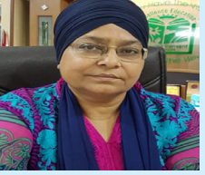
ਗੁੰਝਲ ਭਾਵਨਾਵਾਂ, ਮਨੋਕਾਮਨਾਵਾਂ, ਉਨ੍ਹਾਂ ਦੀ ਦਸ਼ਾ ਅਤੇ ਦਿਸ਼ਾ ਆਦਿ ਨੂੰ ਖੂਬਸੂਰਤ ਸ਼ਬਦਾਂ ਵਿਚ ਪਰੋਇਆ ਗਿਆ ਹੈ।