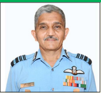
ਇਸ ਸਮੇਂ ਮੇਘਾਲਿਆ ਦੇ ਸ਼ਿਲਾਂਗ ਵਿਚ ਪੁਰਬੀ ਹਵਾਈ ਕਮਾਂਡਰ ਹਨ।