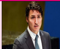
ਸਰਕਾਰ ਨੇ ਦੇਸ਼ ਨੂੰ ਹਰ ਖੇਤਰ ਵਿੱਚ ਪਿੱਛੇ ਧੱਕਿਆ ਅਤੇ ਲੋਕਾਂ ਨਾਲ ਕੀਤਾ ਹਰ ਵਾਅਦਾ ਤੋੜਿਆ। ਉਨ੍ਹਾਂ ਨੇ ਘਰਾਂ ਦੀਆਂ ਕੀਮਤਾਂ 'ਚ ਵਾਧੇ ਅਤੇ ਅਤਿ ਦੀ ਮਹਿਗਾਈ ਲਈ ਵੀ ਸਰਕਾਰ ਨੂੰ ਜ਼ਿੰਮੇਵਾਰ ਠਹਿਰਾਇਆ।

ਕੈਨੇਡਾ ਵਿੱਚ ਟਰੂਡੋ ਸਰਕਾਰ ਖ਼ਿਲਾਫ਼ ਬੇਰੋਸ਼ਰੀ ਲਈ ਵੋਟਿੰਗ ਅੱਜ ਕੈਨੇਡਾ, ਲੋਕ ਬਾਣੀ-ਕੈਨੇਡਾ ਦੀ ਘੱਟ ਗਿਣਤੀ ਟਰੂਡੋ ਸਰਕਾਰ ਖ਼ਿਲਾਫ਼ ਵਿਰੋਧੀ ਤੇ ਟੋਰੀ ਆਗੂ ਪੀਅਰ ਪੌਲਿਵਰ ਵੱਲੋਂ ਸੰਸਦ ਦੇ ਮੈਂਬਰ ਸੈਬਨ ਦੇ ਦੂਜੇ ਦਿਨ ਅੱਜ ਸਰਕਾਰ ਖ਼ਿਲਾਫ਼ ਇੱਕ ਲਾਈਨ ਦਾ ਬੇਰੋਸ਼ਰੀ ਮਤਾ ਪੇਸ਼ ਕੀਤਾ ਤੇ ਬਹਿਸ ਦੀ ਸ਼ੁਰੂਆਤ ਕਰਦਿਆਂ ਸਰਕਾਰ ਦੀਆਂ ਨਾਕਾਮੀਆਂ ਗਿਣਾਈਆਂ। ਇਸ ਸੰਬੰਧੀ ਵੋਟਾਂ ਭਲਕੇ ਪੈਣਗੀਆਂ। ਐਨਡੀਪੀ ਤੇ ਬਲਾਕ ਕਿਊਬਿਕ ਨੇ ਮਤੇ ਦੀ ਹਮਾਇਤ ਕਰਨ ਤੋਂ ਇਨਕਾਰ ਕਰ ਦਿੱਤਾ ਹੈ। ਪੌਲਿਵਰ ਨੇ ਕਿਹਾ ਕਿ 9 ਸਾਲ ਪਹਿਲਾਂ ਸੱਤਾ ਸੰਭਾਲਣ ਵਾਲੀ ਲਿਬਰਲ