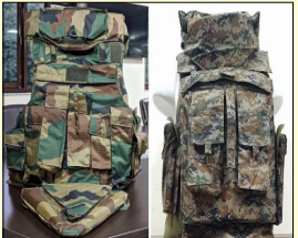
'ਅਭੇਦ' (ਐਡਵਾਂਸਡ ਬੈਲਿਸਟਿਕਸ ਫਾਰ ਹਾਈ ਐਨਰਜੀ ਡੀਫੀਟ) ਨਾਮ ਦਿੱਤਾ ਗਿਆ ਹੈ।