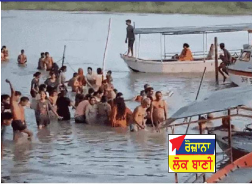
ਰੋਜ਼ਾਨਾ ਲੋਕ ਬਾਣੀ

ਕਾਨਪੁਰ (ਸੁਨੀਲ ਬਾਜਪਾਈ) ਅੱਜ ਐਤਵਾਰ ਨੂੰ ਗੁਰੂ ਪੂਰਨਿਮਾ ਦੇ ਮੌਕੇ ਤੇ ਪਰਮਾਤਮਾ ਅਤੇ ਬਿਰੁਹ ਗੰਗਾ ਘਾਟ ਤੇ ਸ਼ਰਧਾਲੂਆਂ ਦੀ ਭੀੜ ਇਕੱਠੀ ਹੋਈ। ਭਗਤੀ: ਸਵੇਰ ਤੋਂ ਹੀ ਵੱਡੀ ਗਿਣਤੀ ਚ ਸੰਗਤਾਂ ਗੰਗਾ ਘਾਟ ਤੇ ਪੁੱਜੀਆਂ ਅਤੇ ਗੰਗਾ ਚ ਇਸ਼ਨਾਨ ਕਰਨ ਦੇ ਨਾਲ-ਨਾਲ ਆਪਣੇ ਗੁਰੂ ਦਾ ਸਿਮਰਨ ਕੀਤਾ ਅਤੇ ਅਰਦਾਸ ਕੀਤੀ।