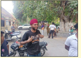
ਹਸਪਤਾਲ ਕਪੂਰਥਲਾ ਲਿਆਂਦਾ ਗਿਆ ਜਿੱਥੇ ਡਿਊਟੀ ਡਾਕਟਰ ਵਲੋਂ ਉਸ ਨੂੰ ਮਿ੍ ਕ ਐਲਾਨ ਦਿੱਤਾ ਗਿਆ। ਇਸ ਸੰਬੰਧੀ ਸੰਬੰਧਿਤ ਥਾਣੇ ਨੂੰ ਸੂਚਿਤ ਕਰ ਦਿੱਤਾ ਗਿਆ ਹੈ।