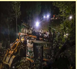
ਵਾਟਰਗਲ ਇਲਾਕੇ ਵਿੱਚ ਇਕ ਖੱਬੇ 'ਚ ਡਿੱਗ ਗਈ। ਉਨ੍ਹਾਂ ਦੱਸਿਆ ਕਿ ਹਾਦਸੇ ਵਿੱਚ ਕਰੀਬ 35 ਜਵਾਨ ਜ਼ਖ਼ਮੀ ਹੋ ਗਏ

ਬੀਐਸਐਫ ਦੇ ਜਵਾਨਾਂ ਦੀ ਬੱਸ ਨਾਲ ਵਾਪਰਿਆ ਹਾਦਸਾ ਤਿੰਨ ਜਵਾਨਾਂ ਦੀ ਮੌਤ 32 ਜ਼ਖ਼ਮੀ ਜੰਮੂ ਕਸ਼ਮੀਰ, ਲੋਕ ਬਾਣੀ--ਜੰਮੂ ਕਸ਼ਮੀਰ ਦੇ ਬਡਗਾਮ ਜ਼ਿਲ੍ਹੇ ਵਿੱਚ ਅੱਜ ਚੋਣ ਡਿਊਟੀ ਲਈ ਜਾ ਰਹੀ ਸੀਮਾ ਸੁਰੱਖਿਆ ਬਲ (ਬੀਐਸਐਫ) ਦੀ ਇਕ ਬੱਸ ਹਾਦਸਾਗ੍ਰਸਤ ਹੋ ਜਾਣ ਕਾਰਨ ਘੱਟੋ-ਘੱਟ ਤਿੰਨ ਜਵਾਨਾਂ ਦੀ ਮੌਤ ਹੋ ਗਈ ਜਦਕਿ 32 ਹੋਰ ਜ਼ਖ਼ਮੀ ਹੋ ਗਏ। ਅਧਿਕਾਰੀਆਂ ਨੇ ਇਹ ਜਾਣਕਾਰੀ ਦਿੱਤੀ। ਅਧਿਕਾਰੀਆਂ ਨੇ ਦੱਸਿਆ ਕਿ ਵਿਧਾਨ ਸਭਾ ਚੋਣਾਂ ਦੇ ਦੂਜੇ ਗੇੜ ਲਈ ਚੋਣ ਡਿਊਟੀ 'ਤੇ ਜਾ ਰਹੇ ਬੀਐਸਐਫ ਦੇ ਜਵਾਨਾਂ ਨੂੰ ਲੈ ਕੇ ਜਾ ਰਹੀ ਇਕ ਬੱਸ ਮੱਧ ਕਸ਼ਮੀਰ ਦੇ ਬਡਗਾਮ ਜ਼ਿਲ੍ਹੇ ਦੇ