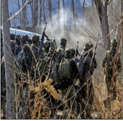
ਅਤਿਵਾਦੀਆਂ ਨਾਲ ਆਹਮੋ-ਸਾਹਮਣਾ ਹੋਇਆ ਅਤੇ ਕੁਝ ਦੋਰ ਲਈ ਗੋਲੀਬਾਰੀ ਹੋਈ। -

ਜੰਮੂ ਕਸ਼ਮੀਰ ਵਿਚ ਸੁਰੱਖਿਆ ਬਲਾਂ ਤੇ ਅਤਿਵਾਦੀਆਂ ਦਾ ਹੋਇਆ ਮੁਕਾਬਲਾ ਜੰਮੂ ਕਸ਼ਮੀਰ, ਲੋਕ ਬਾਣੀ--ਜੰਮੂ ਕਸ਼ਮੀਰ ਦੇ ਰਿਆਸੀ ਜ਼ਿਲ੍ਹੇ ਵਿੱਚ ਅੱਜ ਰਾਤ ਸੁਰੱਖਿਆ ਬਲਾਂ ਦੀ ਤਲਾਸ਼ੀ ਮੁਹਿੰਮ ਦੌਰਾਨ ਸ਼ੱਕੀ ਅਤਿਵਾਦੀਆਂ ਨੇ ਗੋਲੀਬਾਰੀ ਕੀਤੀ। ਅਧਿਕਾਰੀਆਂ ਨੇ ਇਹ ਜਾਣਕਾਰੀ ਦਿੱਤੀ। ਅਧਿਕਾਰੀਆਂ ਨੇ ਦੱਸਿਆ ਕਿ ਖੂਬੀਆ ਜਾਣਕਾਰੀ ਦੇ ਆਧਾਰ 'ਤੇ ਅੱਜ ਬਾਅਦ ਦੁਪਹਿਰ 1 ਵਜੇ ਤਲਾਸ਼ੀ ਮੁਹਿੰਮ ਸ਼ੁਰੂ ਕੀਤੀ ਗਈ ਸੀ। ਉਨ੍ਹਾਂ ਦੱਸਿਆ ਕਿ ਚੌਸਾਨਾ ਪੁਲੀਸ ਥਾਣੇ ਅਧੀਨ ਆਉਂਦੇ ਸ਼ਿਕਾਰੀ ਇਲਾਕੇ ਵਿੱਚ