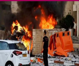
ਸਥਾਨਕ ਸੂਤਰਾਂ ਅਤੇ ਪ੍ਰਤੱਖਦਰਸ਼ੀਆਂ ਨੇ ਕਿਹਾ ਕਿ ਹਵਾਈ ਹਮਲੇ ਨਾਲ ਸਕੂਲ ਦੇ ਵੇਹੜੇ ਅਤੇ ਕਲਾਸਾਂ ਦਾ ਵੀ ਕਾਰੀ ਨੁਕਸਾਨ ਹੋਇਆ ਹੈ।

ਇਜ਼ਰਾਈਲ ਦੇ ਹਮਲੇ ਵਿਚ 8 ਫਿਲਸਤੀਨੀ ਮਾਰੇ ਗਏ ਗਾਜ਼ਾ, ਲੋਕ ਬਾਣੀ --ਗਾਜ਼ਾ ਸ਼ਹਿਰ ਦੇ ਪਹਿਲਾਂ ਤੋਂ ਵਿਸਥਾਪਿਤ ਲੋਕਾਂ ਨੂੰ ਸ਼ਰਣ ਦੇਣ ਵਾਲੇ ਇਕ ਸਕੂਲ 'ਤੇ ਇਜ਼ਰਾਈਲੀ ਹਮਲੇ 'ਚ ਘੱਟੋ-ਘੱਟ 8 ਫਿਲਸਤੀਨੀ ਮਾਰੇ ਗਏ। ਫਿਲਸਤੀਨੀ ਸੁਰੱਖਿਆ ਸੂਤਰਾਂ ਨੇ ਦੱਸਿਆ ਕਿ ਇਜ਼ਰਾਈਲੀ ਜਹਾਜ਼ਾਂ ਨੇ ਬੁਜ਼ਈਆ 'ਚ ਵਿਸਥਾਪਿਤ ਲੋਕਾਂ ਨੂੰ ਸ਼ਰਣ ਦੇਣ ਵਾਲੇ ਅਲ-ਹੋਥਮ ਸਕੂਲ 'ਚ ਬੰਬ ਸੁੱਟੇ। ਗਾਜ਼ਾ ਸਿਵਲ ਡਿਫੈਂਸ ਨੇ ਇਕ ਪ੍ਰੈੱਸ ਬਿਆਨ 'ਚ ਕਿਹਾ ਕਿ ਸਾਡੀਆਂ ਟੀਮਾਂ ਨੇ ਇਜ਼ਰਾਈਲੀ ਹਵਾਈ ਹਮਲੇ ਤੋਂ ਬਾਅਦ 5 ਬੱਚਿਆਂ ਅਤੇ 2 ਮਹਿਲਾਵਾਂ ਸਮੇਤ 8 ਪੀੜਤਾਂ ਦੀਆਂ ਲਾਸ਼ਾਂ ਬਰਾਮਦ ਕੀਤੀਆਂ ਹਨ।