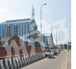
ਖਿਲਾਫ ਕਾਰਵਾਈ ਦੀ ਮੰਗ ਕੀਤੀ ਹੈ।

ਪੰਜਾਬ ਵਿੱਚ ਮਿਲ ਦੇ ਪ੍ਰਬੰਧਕਾਂ ਨੇ ਕਿਸਾਨਾਂ ਖਿਲਾਫ ਦਿੱਤੀ ਸ਼ਿਕਾਇਤ ਫਗਵਾੜਾ, ਲੋਕ ਬਾਣੀ--ਗੰਨਾ ਮਿੱਲ ਵੱਲੋਂ ਬਕਾਇਆ ਰਾਸ਼ੀ ਨੂੰ ਲੈ ਕੇ ਕੱਲ੍ਹ ਇਥੇ ਕਿਸਾਨਾਂ ਵਲੋਂ ਧਰਨੇ ਤੋਂ ਬਾਅਦ ਮਿੱਲ ਦੇ ਗੇਟ ਨੂੰ ਤਾਲਾ ਲਗਾਉਣ ਦੇ ਮਾਮਲੇ 'ਚ ਮਿੱਲ ਪ੍ਰਬੰਧਕਾਂ ਨੇ ਵੀ ਹੁਣ ਸਖ਼ਤ ਰੁੱਖ ਅਪਣਾਇਆ ਹੈ ਤੇ ਉਨ੍ਹਾਂ ਪ੍ਰਸ਼ਾਸਨ ਨੂੰ ਆਪਣੀ ਲਿਖਤੀ ਸ਼ਿਕਾਇਤ ਦੇ ਕੇ ਕਿਸਾਨਾਂ