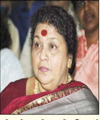
ਉਨ੍ਹਾਂ ਨੂੰ ਚਾਰ ਵਾਰ ਸੂਬਾਈ ਪੁਰਸਕਾਰ ਨਾਲ ਸਨਮਾਨਿਤ ਕੀਤਾ ਗਿਆ ਸੀ।

ਮਸ਼ਹੂਰ ਮਲਿਆਲਮ ਅਦਾਕਾਰਾ ਕਵਿਊਰ ਦੀ ਹੋਈ ਮੌਤ ਕੋਚੀ, ਲੋਕ ਬਾਣੀ - ਤਜਰਬੇਕਾਰ ਮਲਿਆਲਮ ਕਵਿਊਰ ਪੰਨੇਮਾ ਦਾ ਅੱਜ ਇੱਥੇ ਇਕ ਨਿੱਜੀ ਹਸਪਤਾਲ ਵਿੱਚ ਦੋਹਾੜ ਹੋ ਗਿਆ। ਉਹ 80 ਸਾਲਾਂ ਦੀ ਸੀ। ਹਸਪਤਾਲ ਦੇ ਸੂਤਰਾਂ ਨੇ ਇਹ ਜਾਣਕਾਰੀ ਦਿੱਤੀ। ਛੇ ਦਹਾਕੇ ਤੋਂ ਵੱਧ ਸਮੇਂ ਦੇ ਕਰੀਅਰ ਦੇ ਨਾਲ, ਪੰਨੇਮਾ ਕੁਝ ਸਮੇਂ ਤੋਂ ਜ਼ੇਰੇ ਇਲਾਜ ਸੀ। ਉਨ੍ਹਾਂ ਅੱਜ ਸ਼ਾਮ 5.33 ਵਜੇ ਆਪਣੇ ਆਖਰੀ ਸਾਹ ਲਏ। ਪੰਨੇਮਾ ਨੇ 700 ਤੋਂ ਵੱਧ ਫਿਲਮਾਂ ਕੀਤੀਆਂ, ਜਿਨ੍ਹਾਂ ਵਿੱਚ ਉਨ੍ਹਾਂ ਮੁੱਖ ਤੌਰ 'ਤੇ ਮਾਂ ਦੀ ਭੂਮਿਕਾ ਨਿਭਾਈ। ਉਨ੍ਹਾਂ ਨੂੰ ਚਾਰ ਵਾਰ ਸੂਬਾਈ ਪੁਰਸਕਾਰ ਨਾਲ ਸਨਮਾਨਿਤ ਕੀਤਾ ਗਿਆ ਸੀ।