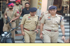
ਹੋ ਕੇ ਆਏ ਸਨ। ਸੀ. ਸੀ. ਟੀ.ਵੀ. ਵਿਚ ਵਾਰਦਾਤ ਕੇਂਦ ਹੋ ਗਈ ਹੈ। ਸੂਚਨਾ ਮਿਲਣ 'ਤੇ ਐਸ. ਐਸ. ਪੀ. ਮੋਹਾਲੀ ਵੀ ਮੌਕੇ 'ਤੇ ਪਹੁੰਚ ਚੁੱਕੇ ਹਨ। ਜਾਣਕਾਰੀ ਅਨੁਸਾਰ ਇਸ ਵਿਚ ਕੋਈ ਜਾਨੀ ਨੁਕਸਾਨ ਨਹੀਂ ਹੋਇਆ।

ਏਸ਼ਟ ਦੇ ਦਫਤਰ ਬਾਹਰ ਫਿਰੋਤੀ ਮੰਗਣ ਆਏ ਲੁਟੇਰੇ ਗੋਲੀਆਂ ਚੱਲਾਂ ਹੋਏ ਫ਼ਰਾਰ ਮੋਹਾਲੀ, ਲੋਕ ਬਾਣੀ-ਸਰਕਾਰੀ ਕਾਲਜ ਨੂੰ ਜਾਂਦੀ ਸੜਕ 'ਤੇ ਥਾਣੇ ਦੇ ਪਿਛਲੇ ਪਾਸੇ ਇਮੀਗ੍ਰੇਸ਼ਨ ਸਰਵਿਸ ਐਜੂਕੇਸ਼ਨ ਪੁਆਇੰਟ ਦੇ ਮਾਲਕ ਨੂੰ ਫਿਰੋਤੀ ਵਾਲੀ ਚਿੱਠੀ ਦੇਣ ਆਏ ਦੋ ਨਕਾਬਪੋਸ਼ 4-5 ਗੋਲੀਆਂ ਚਲਾ ਕੇ ਫ਼ਰਾਰ ਹੋ ਗਏ। ਉਕਤ ਨੌਜਵਾਨਾਂ ਨੇ ਪਹਿਲਾਂ ਕਾਉਂਟਰ 'ਤੇ ਬੈਠੀ ਲੜਕੀ ਨੂੰ ਫਿਰੋਤੀ ਵਾਲੀ ਚਿੱਠੀ ਦਿੱਤੀ, ਫਿਰ ਸੀਬ 'ਤੇ ਗੋਲੀਆਂ ਚਲਾ ਕੇ ਫ਼ਰਾਰ ਹੋ ਗਏ। ਗੋਲੀਆਂ ਚਲਾਉਣ ਵਾਲੇ ਮੋਟਰ ਸਾਈਕਲ 'ਤੇ ਸਵਾਰ