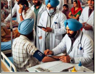
ਅਤੇ ਲੋੜੀਂਦੀਆਂ ਸਵਾਧਾਨੀਆਂ ਵਰਤਣ ਦੀ ਲੋੜ ਹੈ। ਉਨ੍ਹਾਂ ਦੱਸਿਆ ਕਿ ਸਵਾਈਨ ਫਲੂ ਐੱਚ-1, ਐੱਨ-1 ਦੇ ਵਿਸ਼ੇਸ਼ ਵਿਸ਼ਾਣੂ ਰਾਹੀਂ ਹੁੰਦਾ ਹੈ, ਜੋ ਕਿ ਇਕ ਤੋਂ ਦੂਜੇ ਮਨੁੱਖ 'ਚ ਸਾਹ ਰਾਹੀਂ ਫੈਲਦਾ ਹੈ।