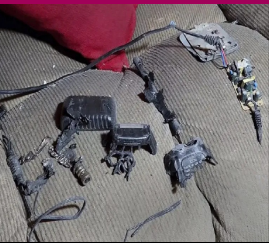
12 ਲੋਕਾਂ ਦੇ ਮਾਰੇ ਜਾਣ ਅਤੇ 2,800 ਤੋਂ ਵੱਧ ਹੋਰਨਾਂ ਜ਼ਖਮੀ ਹੋਣ ਦੇ ਇੱਕ ਦਿਨ ਬਾਅਦ ਹੋਇਆ ਹੈ।

ਲਿਬਨਾਨ ਚ ਹੋਏ ਧਮਾਕਿਆਂ ਵਿਚ 20 ਦੀ ਮੌਤ ਕਈ ਜ਼ਖਮੀ ਬੈਰੁਤ, ਲੋਕ ਬਾਣੀ- ਲਿਬਨਾਨ ਵਿੱਚ ਹਮਲੇ ਲਈ ਵਾਕੀ-ਟਾਕੀਜ਼ ਅਤੇ ਪੇਜਰਾਂ ਸਮੇਤ ਸੰਚਾਰ ਯੰਤਰਾਂ ਨੂੰ ਨਿਸ਼ਾਨਾ ਬਣਾਇਆ ਗਿਆ ਹੈ, ਜਿਸ ਦੇ ਤਬਾਹਕੁਨ ਨਤੀਜੇ ਨਿਕਲ ਕੇ ਸਾਹਮਣੇ ਆਏ ਹਨ। 'ਅਲ ਜ਼ਜ਼ੀਰਾ' ਦੀ ਇੱਕ ਰਿਪੋਰਟ ਦੇ ਅਨੁਸਾਰ ਅਧਿਕਾਰੀਆਂ ਨੇ ਕਿਹਾ ਕਿ ਤਾਜ਼ਾ ਹਮਲਿਆਂ ਵਿੱਚ ਘੱਟੋ ਘੱਟ 20 ਲੋਕਾਂ ਦੀ ਮੌਤ ਹੋ ਗਈ ਅਤੇ 450 ਤੋਂ ਵੱਧ ਲੋਕ ਜ਼ਖਮੀ ਹੋ ਗਏ ਹਨ। ਇਹ ਤਾਜ਼ਾ ਹਮਲਾ ਲਿਬਨਾਨ ਵਿੱਚ ਪੇਜਰਾਂ ਵਿੱਚ ਇਕੋ ਵੇਲੇ ਕੀਤੇ ਗਏ ਧਮਾਕਿਆਂ ਵਿੱਚ