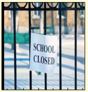
ਅਨੁਸਾਰ ਗੰਗਾ ਨਦੀ ਦੇ ਵਧਦੇ ਪਾਣੀ ਦੇ ਪੱਧਰ ਦੇ ਮੰਦਿਨਜ਼ਰ ਪਟਨਾ ਜ਼ਿਲ੍ਹੇ ਦੇ ਅੱਠ ਬਲਾਕਾਂ ਵਿੱਚ ਕੁੱਲ 76 ਸਰਕਾਰੀ ਸਕੂਲ 21 ਸਤੰਬਰ ਤੱਕ ਬੰਦ ਰਹਿਣਗੇ।