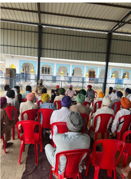
ਇਸੇ ਤਰ੍ਹਾਂ ਖੇਤੀਬਾੜੀ ਵਿਭਾਗ ਅਤੇ ਕਲੱਸਟਰ ਅਫ਼ਸਰਾਂ ਵਲੋਂ ਵੀ ਮੀਟਿੰਗਾਂ ਜਾਰੀ ਹਨ।