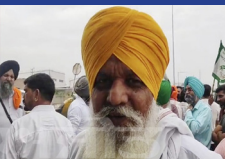
ਉਤੇ ਤੁਰੰਤ ਹੀ ਕਿਸਾਨ ਉਥੇ ਪਹੁੰਚੇ ਅਤੇ ਇਕ ਘੰਟੇ ਦੇ ਲਗਭਗ ਟੋਲ ਫ੍ਰੀ ਕਰਵਾਇਆ ਅਤੇ ਟੋਲ ਪਲਾਜ਼ਾ ਮੁਲਾਜ਼ਮ ਵੱਲੋਂ ਮੁਆਫੀ ਮੰਗਣ ਉਤੇ ਟੋਲ ਪਲਾਜ਼ਾ ਚਾਲੂ ਹੋਇਆ।

ਟੋਲ ਪਲਾਜ਼ਾ ਵਾਲਿਆਂ ਨੂੰ ਸਿਖਾਇਆ ਸਬਕ ਫਰੀ ਕੀਤਾ ਟੋਲ ਅੰਮ੍ਰਿਤਸਰ, ਲੋਕ ਬਾਣੀ-ਸਰਕਾਰ ਵੱਲੋਂ ਕਿਸਾਨਾਂ ਨੂੰ ਪਹਾਲੀ ਲੈ ਕੇ ਜਾਣ ਸਮੇਂ ਟੋਲ ਪਲਾਜ਼ਾ ਤੋਂ ਛੋਟ ਦੇਣ ਦੇ ਬਾਵਜੂਦ ਵੀ ਟੋਲ ਪਲਾਜ਼ਾ ਨਿੱਜਰਪੁਰਾ ਉਤੇ ਪਹਾਲੀ ਦੀ ਟਰਾਲੀ ਲੈ ਕੇ ਜਾ ਰਹੇ ਇਕ ਕਿਸਾਨ ਨੂੰ ਟੋਲ ਵਾਲਿਆਂ ਵੱਲੋਂ ਰੋਕ ਕੇ ਉਸ ਦੀ ਜ਼ਬਰੀ ਪਰਚੀ ਕੱਟਣ ਉਤੇ ਵਿਵਾਦ ਹੋ ਗਿਆ ਅਤੇ ਕਿਸਾਨ ਸੰਘਰਸ਼ ਕਮੇਟੀ ਨੂੰ ਪਤਾ ਲੱਗਣ