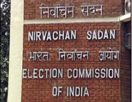
ਵੋਟਰ ਆਪਣੇ ਵੋਟ ਦੇ ਅਧਿਕਾਰੀ ਦੀ ਵਰਤੋਂ ਕਰਨਗੇ। ਅਗਸਤ 2019 ਵਿਚ ਧਾਰਾ 370 ਖ਼ਤਮ ਕੀਤੇ ਜਾਣ ਤੋਂ ਬਾਅਦ ਇਹ ਜੰਮੂ ਕਸ਼ਮੀਰ ਵਿਚ ਪਹਿਲੀ ਵਾਰ ਹੋਵੇਗੀ।

ਜੰਮੂ ਕਸ਼ਮੀਰ ਵਿਚ ਸੱਤ ਜ਼ਿਲ੍ਹਿਆਂ ਵਿਚ ਵੋਟਾਂ ਦੀ ਤਿਆਰੀ ਮੁਕੰਮਲ ਜੰਮੂ ਕਸ਼ਮੀਰ, ਲੋਕ ਬਾਣੀ-ਜੰਮੂ ਕਸ਼ਮੀਰ ਦੇ ਸੱਤ ਜ਼ਿਲ੍ਹਿਆਂ ਦੇ ਵੋਟ 10 ਸਾਲਾਂ ਵਿਚ ਪਹਿਲੀ ਵਾਰ ਵੋਟ ਕਰਨ ਜਾ ਰਹੇ ਹਨ। ਕੇਂਦਰ ਸਾਬਿਤ ਸੂਬੇ ਵਿਚ ਬੁੱਧਵਾਰ ਨੂੰ ਪਹਿਲੇ ਪੜਾਅ ਤਹਿਤ ਚੋਣਾਂ ਦੀ ਤਿਆਰੀ ਮੁਕੰਮਲ ਹੋ ਚੁੱਕੀ ਹੈ। ਜੰਮੂ ਦੇ ਤਿੰਨ ਜ਼ਿਲ੍ਹੇ ਅਤੇ ਕਸ਼ਮੀਰ ਘਾਟੀ ਦੇ ਚਾਰ ਜ਼ਿਲ੍ਹਿਆਂ ਵਿਚ 90 ਆਜ਼ਾਦ ਉਮੀਦਵਾਰਾਂ ਸਮੇਤ ਕੁੱਲ 219 ਉਮੀਦਵਾਰ ਹਨ ਅਤੇ ਇਸ ਦੌਰਾਨ 23 ਲੱਖ ਤੋਂ ਜ਼ਿਆਦਾ