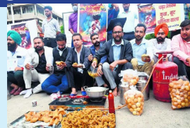
ਦੇ ਜਨਮ ਦਿਨ 'ਤੇ ਫਰੂਟ ਸ਼ਬਡੀ ਦੀ ਰੋਹੜੀ, ਬੂਟ ਪਾਲਿਸ਼, ਸਮੋਸੇ ਪਕੌੜੇ, ਰਿਕਸ਼ਾ ਰੋਹੜੀ ਚਲਾ ਕੇ ਬੇਰੁਜ਼ਗਾਰੀ ਦਿਵਸ ਦੇ ਤੌਰ 'ਤੇ ਮਨਾਇਆ ਗਿਆ। ਇਸ ਦੌਰਾਨ ਕਈ ਯੂਥ ਆਗੂ ਮੌਜੂਦ ਰਹੇ।