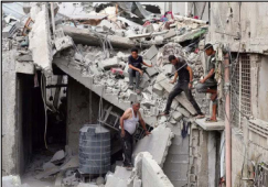
ਇਲਾਜ ਹਨ। ਇਜ਼ਰਾਈਲੀ ਫੌਜ ਵੱਲੋਂ ਗਾਜ਼ਾ ਸ਼ਹਿਰ 'ਚ ਕੀਤੇ ਗਏ ਹੋਰ ਹਮਲੇ 'ਚ ਅੱਠਰਤ ਅਤੇ ਦੋ ਬੱਚਿਆਂ ਸਮੇਤ 10 ਵਿਅਕਤੀ ਮਾਰੇ ਗਏ।

16 ਲੋਕਾਂ ਦੀ ਹੋਈ ਇਜ਼ਰਾਈਲ ਹਵਾਈ ਹਮਲੇ ਵਿਚ ਮੌਤ ਯੇਰੂਸ਼ਲਮ ਲੋਕ ਬਾਣੀ-ਗਾਜ਼ਾ ਪੱਟੀ 'ਤੇ ਇਜ਼ਰਾਈਲੀ ਫੌਜ ਵੱਲੋਂ ਕੀਤੇ ਹਵਾਈ ਹਮਲਿਆਂ 'ਚ 16 ਵਿਅਕਤੀ ਮਾਰੇ ਗਏ। ਮ੍ਰਿਤਕਾਂ 'ਚ ਚਾਰ ਅੱਠਰਤਾਂ ਅਤੇ ਚਾਰ ਬੱਚੇ ਸ਼ਾਮਲ ਹਨ। ਨੁਸਰਤ ਸ਼ਰਨਾਰਥੀ ਕੈਂਪ 'ਤੇ ਅੱਜ ਤੱਕ ਕੀਤੇ ਹਮਲੇ 'ਚ ਘਰ ਮਲਬਾ ਬਣ ਗਿਆ, ਜਿਸ 'ਚ ਚਾਰ ਅੱਠਰਤਾਂ ਅਤੇ ਦੋ ਬੱਚਿਆਂ ਸਮੇਤ 10 ਵਿਅਕਤੀ ਮਾਰੇ ਗਏ। ਅਵਦਾ ਹਸਪਤਾਲ ਮੁਤਾਬਕ ਇਸ ਹਮਲੇ 'ਚ 13 ਹੋਰ ਵਿਅਕਤੀ ਜ਼ਖ਼ਮੀ ਹੋਏ ਹਨ, ਜੋ ਜ਼ੇਰੇ