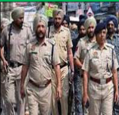
ਭਾਈਚਾਰੇ ਦੇ ਪੜਵੰਤਿਆਂ ਨੇ ਗੁੱਸੇ ਅਤੇ ਰੋਸ ਚ ਸਥਾਨਕ ਸਿਨੇਮਾ ਹੋਲ ਤੇ ਧਰਨਾ ਲਗਾ ਰੋਸ ਪ੍ਰਦਰਸ਼ਨ ਕੀਤਾ।