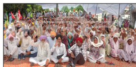
ਮਜ਼ਦੂਰ ਜਥੇਬੰਦੀਆਂ ਦੇ ਸਮਰਥਨ ਵਿਚ ਆ ਗਈ ਅਤੇ ਸੈਂਕੜਿਆਂ ਦੀ ਗਿਣਤੀ ਵਿਚ ਮਰਦਾਂ ਤੇ ਅੱਠਰਤਾਂ ਨੇ ਪਿੰਡ ਬਿਸ਼ਨਪੁਰਾ (ਅਕਾਲਗੜ੍ਹ) ਵਿਖੇ ਕੌਮੀ ਮਾਰਗ ਤੇ ਮੁਕੰਮਲ ਚੱਕਾ ਜਾਮ ਕਰਕੇ ਪੰਜਾਬ ਸਰਕਾਰ ਖਿਲਾਫ ਨਾਅਰੇਬਾਜ਼ੀ ਕੀਤੀ।

ਸੂਬੇ ਵਿਚ ਮਜ਼ਦੂਰ ਦੀ ਮੌਤ ਦੇ ਇਨਸਾਫ ਲਈ ਲਗਾਇਆ ਗਿਆ ਸੜਕ ਤੇ ਧਰਨਾ ਸੁਨਾਮ, ਲੋਕ ਬਾਣੀ-ਬੀਤੇ ਕੱਲ ਸਥਾਨਕ ਪਟਿਆਲਾ ਮੁੱਖ ਮਾਰਗ ਤੇ ਹੋਏ ਸੜਕ ਹਾਦਸੇ 'ਚ ਮਰੇ 4 ਮਗਨਰੋਗਾ ਮਜ਼ਦੂਰਾਂ ਦੇ ਪਰਿਵਾਰਾਂ ਨੂੰ ਇਨਸਾਫ ਦਿਵਾਉਣ ਲਈ ਵਿੱਢਿਆ ਗਿਆ ਅਣਮਿੱਥੇ ਸਮਾਂ ਦਾ ਸੰਘਰਸ਼ ਅੱਜ ਦੂਜੇ ਦਿਨ ਵੀ ਜਾਰੀ ਰਿਹਾ। ਪੀੜਤ ਪਰਿਵਾਰਾਂ ਵੱਲੋਂ ਕਿਹਾ ਜਾ ਰਿਹਾ ਹੈ ਕਿ ਉਹ ਪ੍ਰਸ਼ਾਸਨ ਤੋਂ ਲਿਖਤੀ ਭਰੋਸਾ ਲੈਣ ਤੋਂ ਬਾਅਦ ਹੀ ਮ੍ਰਿਤਕ ਮਜ਼ਦੂਰਾਂ ਦਾ ਸਸਕਾਰ ਕਰਨਗੇ। ਇਸ ਦੌਰਾਨ ਭਾਰਤੀ ਕਿਸਾਨ ਯੂਨੀਅਨ ਏਕਤਾ ਉਗਰਾਹਾਂ ਵੀ