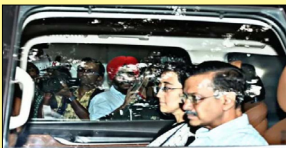
'ਆਪ' ਵੱਲੋਂ ਉਨ੍ਹਾਂ ਦੇ ਜਾਨਸ਼ੀਨ ਵਜੋਂ ਚੁਣੀ ਗਈ ਪਾਰਟੀ ਦੀ ਸੀਨੀਅਰ ਆਗੂ ਆਤਿਸ਼ੀ ਨੇ ਨਵੀਂ ਸਰਕਾਰ ਬਣਾਉਣ ਲਈ ਆਪਣਾ ਦਾਅਵਾ ਐਲਾਨੀ ਅੱਗੇ ਪੇਸ਼ ਕੀਤਾ।

ਕੇਜਰੀਵਾਲ ਨੇ ਅਸਤੀਫਾ ਦੇ ਆਪਣੀ ਸਹਿਯੋਗੀ ਆਤਿਸ਼ੀ ਨੂੰ ਬਣਾਇਆ ਮੁੱਖ ਮੰਤਰੀ ਦਿੱਲੀ, ਲੋਕ ਬਾਣੀ-ਦਿੱਲੀ ਦੇ ਮੁੱਖ ਮੰਤਰੀ ਅਰਵਿੰਦ ਕੇਜਰੀਵਾਲ ਨੇ ਮੰਗਲਵਾਰ ਨੂੰ ਆਪਣੇ ਅਹੁਦੇ ਤੋਂ ਅਸਤੀਫਾ ਦੇ ਦਿੱਤਾ ਹੈ। ਉਨ੍ਹਾਂ ਦੀ ਥਾਂ ਹਾਕਮ ਧਿਰ ਆਮ ਆਦਮੀ ਪਾਰਟੀ (ਆਪ) ਨੇ ਪਾਰਟੀ ਦੀ ਸੀਨੀਅਰ ਆਗੂ ਆਤਿਸ਼ੀ ਨੂੰ ਮੁੱਖ ਮੰਤਰੀ ਵਜੋਂ ਚੁਣਿਆ ਹੈ। ਕੇਜਰੀਵਾਲ ਵੱਲੋਂ ਦਿੱਲੀ ਦੇ ਉਪ ਰਾਜਪਾਲ (ਐਲਜੀ) ਵੀਕੇ ਸਕਸੇਨਾ ਨੂੰ ਅਸਤੀਫਾ ਸੌਂਪ ਜਾਣ ਤੋਂ ਬਾਅਦ,