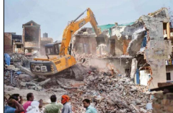
ਮਨਜ਼ੂਰੀ ਤੋਂ ਬਿਨਾਂ 1 ਅਕਤੂਬਰ ਤੱਕ ਹਰਗਿਜ਼ ਨਹੀਂ ਢਾਹਿਆ ਜਾ ਸਕੇਗਾ। ਬੈਂਚ ਨੇ ਕਿਹਾ ਕਿ ਭਾਵੇਂ ਕੋਈ ਉਸਾਰੀ ਨਾਜਾਇਜ਼ ਵੀ ਹੋਵੇ, ਤਾਂ ਵੀ ਇਸ ਨੂੰ ਇਝ ਢਾਹੁਣਾ ਸਾਡੇ ਸੰਵਿਧਾਨ ਦੀ ਮੂਲ ਭਾਵਨਾ ਦੇ ਖਿਲਾਫ ਹੈ।