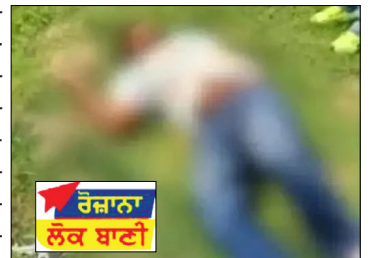
ਰੋਜ਼ਾਨਾ ਲੋਕ ਬਾਣੀ

ਚੰਡੀਗੜ੍ਹ: ਪੰਜਾਬ ਦੇ ਮੋਹਾਲੀ ਦੇ ਬਨੂੜ ਨੇੜੇ ਪੁਲਿਸ ਅਤੇ ਗੈਂਗਸਟਰ ਵਿਚਾਲੇ ਮੁਕਾਬਲਾ ਹੋਇਆ ਹੈ। ਸ਼ੁਰੂਆਤੀ ਜਾਣਕਾਰੀ ਅਨੁਸਾਰ ਇੱਕ