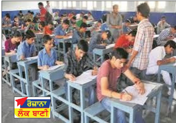
ਰੋਜ਼ਾਨਾ ਲੋਕ ਬਾਣੀ

ਪਟਿਆਲਾ, 14 ਜੁਲਾਈ: ਪੰਜਾਬ ਪਬਲਿਕ ਸਰਵਿਸ ਕਮਿਸ਼ਨ ਵੱਲੋਂ ਅੱਜ ਪੰਜਾਬ ਸਿਵਲ ਸਰਵਿਸ (ਕਾਰਜਕਾਰੀ) ਦੀ ਕਰਵਾਈ ਗਈ ਲਿਖਤੀ ਪ੍ਰੀਖਿਆ ਸਫਲਤਾ ਪੂਰਵਕ ਸੰਪੰਨ ਹੋਈ। ਪਟਿਆਲਾ ਵਿਖੇ ਲਈ ਗਈ ਇਸ ਪ੍ਰੀਖਿਆ ਸਬੰਧੀ ਪੀ.ਪੀ.ਐਸ.ਸੀ. ਵੱਲੋਂ ਵਿਆਪਕ ਸੁਰੱਖਿਆ ਪ੍ਰਬੰਧਾਂ ਸਮੇਤ ਉਮੀਦਵਾਰਾਂ ਦੀ ਪਛਾਣ ਆਦਿ ਲਈ ਢੁਕਵੇਂ ਸਖ਼ਤ ਪ੍ਰਬੰਧ ਕੀਤੇ ਗਏ ਸਨ।