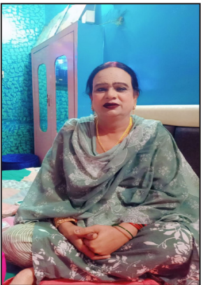
ਰੋਜ਼ਾਨਾ ਲੋਕ ਬਾਣੀ www.lokbani