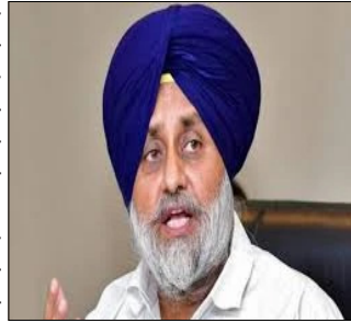
ਉਚ ਅਹੁਦਿਆਂ 'ਤੇ ਬੈਠੀਆਂ ਅਹਿਮ ਸ਼ਖਸੀਅਤਾਂ ਵੱਲੋਂ ਦਿੱਤੇ ਬਿਆਨਾਂ ਦੇ ਕਾਰਣ ਇਹ ਮਾੜੇ ਅਨਸਰ ਦੇਸ਼ ਭਗਤ ਸਿੱਖ ਕੌਮ ਦੇ ਖਿਲਾਫ ਜ਼ਹਿਰ ਉਗਲਣ ਲੱਗ ਪਏ ਹਨ। ਉਹਨਾਂ ਕਿਹਾ ਕਿ ਰਾਜਸਥਾਨ ਸਰਕਾਰ ਨੂੰ ਇਸ ਫਿਰਕੂ ਪਰਵੀਕਰਨ ਨੂੰ ਰੋਕਣਾ ਚਾਹੀਦਾ ਹੈ ਨਾ ਕਿ ਇਸਨੂੰ ਉਤਸ਼ਾਹਿਤ ਕਰਨਾ ਚਾਹੀਦਾ ਹੈ।