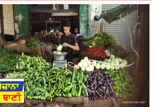
ਭਾਅ ਅਸਮਾਨੀ ਹੋਣਾਂ ਉਤਰਦੇ ਹਨ ਜਾਂ ਫਿਰ ਗਰੀਬ ਆਦਮੀ ਨੂੰ ਦਾਲਾਂ ਜਾਂ ਫਿਰ ਕੁੱਖੀ ਮਿੱਸੀ ਖਾ ਕੇ ਹੀ ਗੁਜ਼ਾਰ ਕਰਨਾ ਪਏਗਾ।

ਸਬਜ਼ੀ ਅਤੇ ਫਲਾਂ ਦੀ ਸਪਲਾਈ ਪ੍ਰਭਾਵਿਤ ਹੋ ਰਹੀ ਹੈ। ਜਿਸ ਕਰਕੇ ਸਬਜ਼ੀਆਂ ਅਤੇ ਫਰੂਟ ਦੀ ਕਮੀ ਆਉਣ ਕਰਕੇ ਭਾਅ ਵਧ ਰਹੇ ਹਨ। ਉਹਨਾਂ ਕਿਹਾ ਕਿ ਆਉਂਦੇ ਦਿਨਾਂ ਵਿੱਚ ਵੀ ਸਬਜ਼ੀਆਂ ਅਤੇ ਖਾਸ ਕਰਕੇ ਪਿਆਜ਼ ਅਤੇ ਟਮਾਟਰ ਦੇ ਭਾਅ ਹੋਰ ਵੱਧ ਸਕਦੇ ਹਨ। ਉਹਨਾਂ ਇਹ ਵੀ ਦੱਸਿਆ ਕਿ ਸਬਜ਼ੀਆਂ ਦੇ ਸਮਾਨ ਚੜੇ ਭਾਅ ਕਾਰਨ ਉਹਨਾਂ ਦੀ ਦੁਕਾਨਦਾਰੀ ਦੀ ਵਿਕਰੀ ਤੇ ਵੀ ਕਾਫ਼ੀ ਅਸਰ ਪਿਆ ਹੈ। ਕਿਉਂਕਿ ਸਬਜ਼ੀ ਖਰੀਦਣਾ ਹੋਣਾ ਆਮ ਵਿਅਕਤੀ ਦੇ ਵੱਸ ਦੀ ਗੱਲ ਨਹੀਂ ਰਹੀ। ਦੇਖਣ ਵਿੱਚ ਆਇਆ ਹੈ ਕਿ ਇਸ ਵਾਰ ਪਿੰਡਾਂ ਦੀ ਸਬਜ਼ੀ ਕਾਸਤਕਾਰਾਂ ਵੱਲੋਂ ਕਾਸਬੇ ਅੰਦਰ ਕਾਫ਼ੀ ਘੱਟ ਮਾਤਰਾ ਵਿੱਚ ਸਬਜ਼ੀ ਵੇਚੀ ਜਾ ਰਹੀ ਹੈ। ਜਿਸਦਾ ਮੁੱਖ ਕਾਰਨ ਇਸ ਵਾਰ ਜ਼ਿਆਦਾ ਪਈ ਗਰਮੀ ਅਤੇ ਬਾਰਿਸ਼ਾਂ ਨੂੰ ਮੰਨਿਆ ਜਾ ਰਿਹਾ ਹੈ। ਕਿਸਾਨਾਂ ਦਾ ਇਹ ਵੀ ਕਹਿਣਾ ਹੈ ਕਿ ਉਨ੍ਹਾਂ ਵੱਲੋਂ ਸਬਜ਼ੀ ਉੱਪਰ ਕੀਤਾ ਖਰਚ ਵੀ ਉਹਨਾਂ ਦੇ ਪੱਲੇ ਪੈਣਾ ਨਜ਼ਰ ਨਹੀਂ ਆ ਰਿਹਾ। ਹੁਣ ਦੇਖਣਾ ਇਹ ਹੈ ਕਿ ਆਉਣ ਵਾਲੇ ਦਿਨਾਂ ਵਿੱਚ ਸਬਜ਼ੀਆਂ ਦੇ