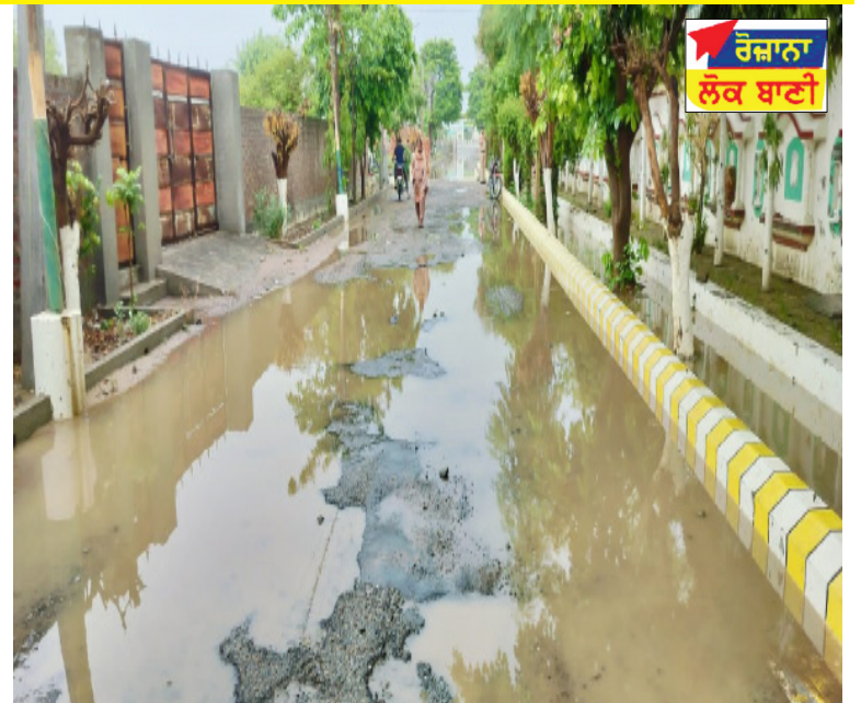
ਰੋਜ਼ਾਨਾ ਲੋਕ ਬਾਣੀ

ਲਈ ਕੁੱਝ ਪ੍ਰਤੀਸ਼ਟ ਪੈਸੇ ਭਰੇ ਹਨ ਜਿਸ ਕਰਕੇ ਕਲੋਨੀ ਅਪਰੂਵਡ ਹੋਣੇ ਰਹਿ ਗਈ। ਕਲੋਨੀ ਵਾਸੀਆਂ ਨੇ ਦੱਸਿਆ ਕਿ ਕਲੋਨੀ ਵਿੱਚ ਸੀਵਰੇਜ ਦਾ ਮੰਦਾ ਹਾਲ ਹੈ, ਪੀਣ ਵਾਲਾ ਪਾਣੀ ਡੂੰਘਾ ਹੋਣ ਕਾਰਨ ਸਬਰਸੀਵਲ ਮੋਟਰਾਂ ਤੇ ਲੱਖਾਂ ਰੁਪਏ ਖਰਚ ਕਰਨਾ ਪੈ ਰਿਹਾ ਹੈ ਅਤੇ ਪਾਣੀ ਡੂੰਘਾ ਹੋਣ ਕਾਰਨ ਮੋਟਰਾਂ ਪਾਣੀ ਛੱਡ ਰਹੀਆਂ ਹਨ, ਜਦੋਂ ਕਿ ਕਲੋਨੀ ਵਿੱਚ ਵਾਟਰ ਵਰਕਸ ਮੌਜੂਦ ਹੈ ਪਰ ਕੁਨੈਕਸ਼ਨ ਕੱਟਿਆ ਹੋਇਆ ਹੈ, ਹੁਣ ਇਸ ਵਾਟਰ ਵਰਕਸ ਤੇ ਅਵਾਰਾ ਕੁੱਤੇ ਬੈਠੇ ਰਹਿੰਦੇ ਹਨ, ਸੜਕਾਂ ਦੀ ਸਫਾਈ ਅਤੇ ਸਟਰੀਟ ਲਾਈਟਾਂ ਦਾ ਪ੍ਰਬੰਧ ਅਤੇ ਗਤ ਦੇ ਚੱਕੀਦਾਰ ਕਲੋਨੀ ਵਾਸੀਆਂ ਨੇ ਖੁਦ ਪੈਸੇ ਇਕੱਠੇ ਕਰਕੇ ਰੱਖਿਆ ਹੋਇਆ ਹੈ। ਸੰਗਰੂਰ ਦਿੱਲੀ ਤੋਂ ਕਲੋਨੀ ਰਾਹੀਂ ਗੁਰਦੁਆਰਾ ਬੈਰਸੀਆਣਾ ਅਤੇ ਬੈਰਸੀਆਣਾ ਚੈਰੀਟੇਬਲ ਹਸਪਤਾਲ ਨੂੰ ਜਾਂਚੀ ਇਸ ਸੜਕ ਦੀ ਹਾਲਤ ਏਨੀ ਖਸਤਾ ਹੈ ਕਿ ਬਰਸਾਤਾਂ ਦੌਰਾਨ ਪਾਣੀ ਨਾਲ ਭਰ ਜਾਂਦੀ ਹੈ ਜਿਸ ਕਰਕੇ ਲੋਕਾਂ ਨੂੰ ਭਾਰੀ ਮੁਸ਼ਕਿਲ ਦਾ ਸਾਹਮਣਾ ਕਰਨਾ ਪੈਂਦਾ ਹੈ ਕਿਉਂਕਿ ਸੜਕ ਵੀ ਥਾਂ ਥਾਂ ਤੋਂ ਟੁੱਟੀ ਪਈ ਹੈ ਅਤੇ ਇਸ ਸੜਕ ਰਾਹੀਂ ਕਲੋਨੀ ਵਾਸੀਆਂ ਤੋਂ ਇਲਾਵਾ ਗੁਰਦੁਆਰਾ ਬੈਰਸੀਆਣਾ ਸਾਹਿਬ ਅਤੇ ਬੈਰਸੀਆਣਾ ਚੈਰੀਟੇਬਲ ਹਸਪਤਾਲ ਲਈ ਲੋਕਾਂ ਦਾ ਦਿਨ-ਰਾਤ ਆਉਣਾ ਜਾਣਾ ਰਹਿੰਦਾ ਹੈ ਅਤੇ ਦਸਵੀਂ ਵਾਲੇ ਦਿਨ ਹਜ਼ਾਰਾਂ ਦਾ ਇਕੱਠ ਹੁੰਦਾ ਹੈ। ਸਹੂਲਤਾਂ ਦੇਣ ਲਈ ਜਦ ਨਗਰ ਪੰਚਾਇਤ ਦਿੜਬਾ ਦੇ ਕਾਰਜ ਸਾਧਕ ਅਫਸਰ ਨਾਲ ਗੱਲ ਕੀਤੀ ਕਿ ਕਲੋਨੀ ਅਪਰੂਵਡ ਨਾ ਹੋਣ ਕਾਰਨ