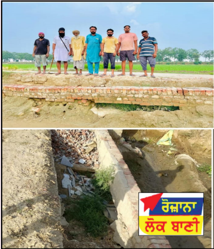
ਰੋਜ਼ਾਨਾ ਲੋਕ ਬਾਣੀ

ਮਾਨਸਾ (ਮਨੋਜ) ਪਿੰਡ ਹੀਰਕੇ ਤਹਿਸੀਲ ਸਰਦੂਲਗੜ੍ਹ ਜਿਲਾ ਮਾਨਸਾ ਦੀ ਢੁਡਾਲ ਬਰਾਂਚ ਵਿੱਚੋਂ ਨਹਿਰੀ ਪਾਣੀ ਨਾਲ ਫਸਲਾਂ ਦੀ ਸਿੰਚਾਈ ਹੁੰਦੀ ਹੈ ਇਸ ਨਹਿਰ ਵਿੱਚੋਂ ਮੋਘਾ ਨੰਬਰ 20 960 * ਤੇ ਜਿਹੜੇ ਖਾਲ ਨਾਲ ਪਿੰਡ ਹੀਰਕੇ ਦੇ ਖੇਤਾਂ ਦੀ ਸਿੰਚਾਈ ਹੁੰਦੀ ਸੀ ਉਹ ਜਿਆਦਾ ਸਮਾਂ ਹੋਣ ਕਾਰਨ ਅਤੇ ਬਾਰਿਸ਼ ਨਾਲ ਪਿਛਲੇ ਦੋ ਸਾਲਾਂ ਤੋਂ ਟੁੱਟ ਗਿਆ ਹੈ ਕਿਉਂਕਿ ਇਹ ਖੇਤ ਬਹੁਤ ਨੀਵੇਂ ਹਨ ਅਤੇ ਜਿਆਦਾ ਬਾਰਿਸ਼ ਹੋਣ ਦੇ ਨਾਲ ਪਿੰਡ ਝੰਡੂਕੇ ਅਤੇ ਚੇਨੇਵਾਲਾ ਦਾ ਪਾਣੀ ਵੀ ਇਥੇ ਆ ਜਾਂਦਾ ਹੈ ਜਿਸ ਨਾਲ ਫਸਲਾਂ ਖਰਾਬ ਹੋ ਜਾਂਦੀਆਂ ਹਨ ਹੁਣ ਟਿਊਬਵੈਲਾਂ ਰਾਹੀਂ ਸਿੰਚਾਈ ਕੀਤੀ ਜਾਂਦੀ ਹੈ ਜਿਸ ਨਾਲ ਧਰਤੀ ਹੇਠਲੇ ਜਲ ਪੱਧਰ ਨੀਵਾਂ ਹੋ ਰਿਹਾ ਤੇ ਬਿਜਲੀ ਦੀ ਖਪਤ ਹੋ ਰਹੀ ਹੈ ਸੋ ਕਿਸਾਨਾਂ ਵੱਲੋਂ ਸਰਕਾਰ ਤੋਂ ਮੰਗ ਕੀਤੀ ਜਾਂਦੀ ਹੈ ਕਿ ਪਿੰਡ ਹੀਰਕੇ ਦੇ ਮੋਘਾ ਨੰਬਰ 20960 * ਦੇ ਪਾਣੀ ਨੂੰ ਪਾਈਪਾਂ ਰਾਹੀਂ ਪਾਉਣ ਦੀ ਪੁਰਜੋਰ ਮੰਗ ਕੀਤੀ ਜਾਂਦੀ ਹੈ ਤਾਂ ਜੋ ਲੰਬੇ ਸਮੇਂ ਤੋਂ ਬਣੀ ਇਸ ਸਮੱਸਿਆ ਤੋਂ ਛੁਟਕਾਰਾ ਮਿਲ ਸਕੇ ਅਤੇ ਬਿਜਲੀ ਅਤੇ ਧਰਤੀ ਹੇਠਲੇ ਪਾਣੀ