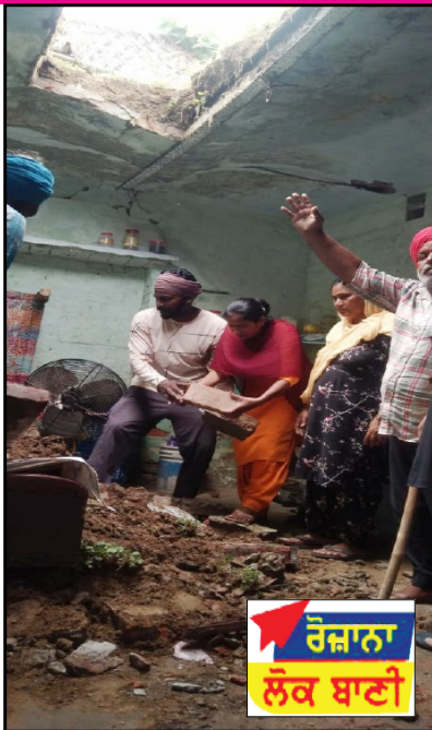
ਬਣਵਾ ਕੇ ਦਿੱਤਾ ਜਾਵੇ।