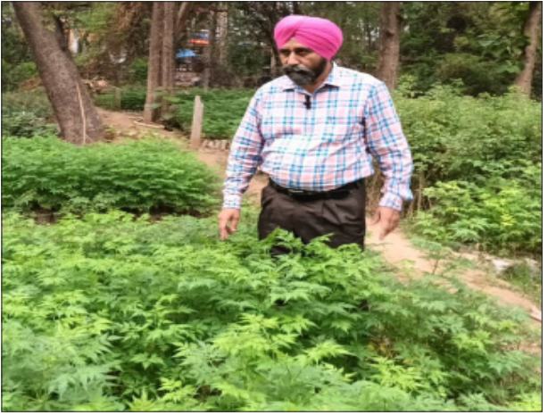
ਇਸ ਲਈ ਅਸੀਂ ਦਿਨ ਰਾਤ ਮਿਹਨਤ ਕਰ ਰਹੇ ਹਾਂ।

ਵੀ ਨਹੀਂ ਕਰਦੇ। ਜਦੋਂ ਕੋਈ ਚੀਜ਼ ਮੁਫਤ ਵਿੱਚ ਦਿੱਤੀ ਜਾਂਦੀ ਹੈ, ਤਾਂ ਉਸ ਦੀ ਕਦਰ ਨਹੀਂ ਕੀਤੀ ਜਾਂਦੀ। ਇਸ ਸਮੇਂ ਵਿਭਾਗ ਕੋਲ 2.5 ਲੱਖ ਦੇ ਕਰੀਬ ਬੂਟੇ ਤਿਆਰ ਹਨ। ਬੂਟੇ ਲਗਾਉਣ ਲਈ ਕਾਫੀ ਮਿਹਨਤ ਕਰਨੀ ਪੈਂਦੀ ਹੈ ਅਤੇ ਇਸ ਦਾ ਖਰਚਾ ਵੀ ਕਾਫੀ ਹੁੰਦਾ ਹੈ। ਮਾਮੂਲੀ ਕੀਮਤ ਰੱਖੀ ਗਈ ਹੈ ਤਾਂ ਜੋ ਪੌਦੇ ਖਰੀਦਣ ਵਾਲੇ ਉਨ੍ਹਾਂ ਦੀ ਦੇਖਭਾਲ ਕਰਨਗੇ। ਇਸ ਸਭ ਨੂੰ ਧਿਆਨ ਵਿੱਚ ਰੱਖਦੇ ਹੋਏ ਵਿਭਾਗ ਵੱਲੋਂ ਪੌਦਿਆਂ ਦੀ ਕੀਮਤ ਤੈਅ ਕੀਤੀ ਗਈ ਹੈ, ਜਿਸ ਤਰ੍ਹਾਂ ਤੁਹਾਨੂੰ ਪਾਲੀਥੀਨ ਬੈਗ ਵਿੱਚ 6ਗਾ9 ਦਾ ਬੂਟਾ 20 ਰੁਪਏ ਵਿੱਚ ਮਿਲੇਗਾ, ਇਸੇ ਤਰ੍ਹਾਂ ਜੇਕਰ ਤੁਸੀਂ ਖਰੀਦਿਆ ਹੈ ਤਾਂ ਇੱਕ ਸਜਾਵਟੀ ਬੂਟਾ 25 ਰੁਪਏ ਅਤੇ 35 ਰੁਪਏ ਵਿੱਚ ਉਪਲਬਧ ਹੋਵੇਗਾ। ਜੇਕਰ ਤੁਸੀਂ ਇੱਕ ਵੱਡਾ ਪੌਦਾ ਚਾਹੁੰਦੇ ਹੋ, ਇਸਦਾ ਆਕਾਰ 9ਗ12 ਹੈ, ਤੁਹਾਨੂੰ ਇਹ 50 ਰੁ: ਵਿੱਚ ਮਿਲੇਗਾ ਅਤੇ ਇਸਦੀ ਉਚਾਈ ਲਗਭਗ 5 ਫੁੱਟ ਹੋਵੇਗੀ। ਉਨ੍ਹਾਂ ਦੱਸਿਆ ਕਿ ਵਿਭਾਗ ਕੋਲ ਕਰੀਬ 12 ਕਿਸਮਾਂ ਦੇ ਰੁੱਖ ਹਨ। ਇਸ ਤੋਂ ਇਲਾਵਾ ਵਿਭਾਗ ਕੋਲ ਮੈਡੀਸਨ ਪਲਾਂਟ ਵੀ ਉਪਲਬਧ ਹਨ। ਸਰਕਾਰ ਸਾਡੇ ਇਲਾਕੇ ਨੂੰ ਹਰਿਆ ਭਰਿਆ ਬਣਾਉਣ ਲਈ ਪੂਰੀ ਕੋਸ਼ਿਸ਼ ਕਰ ਰਹੀ ਹੈ,