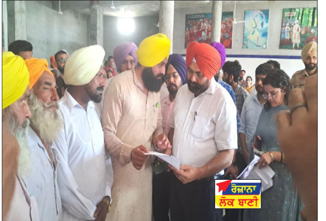
ਰੋਜ਼ਾਨਾ ਲੋਕ ਬਾਣੀ

ਇਸ ਤੋਂ ਇਲਾਵਾ ਉਨ੍ਹਾਂ ਅੱਗੇ ਦੱਸਿਆ ਆਪ ਦੀ ਸਰਕਾਰ ਦੇ ਦੁਆਰਾ ਮੁਹਿੰਮ ਤਹਿਤ ਮਿਤੀ 19 ਜੁਲਾਈ ਦਿਨ ਸ਼ੁਕਰਵਾਰ ਨੂੰ ਫਤਿਹਗੜ੍ਹ ਪੰਜਤੂਰ ਦੇ ਗੁਰਦੁਆਰਾ ਸਿੰਘ ਸਭਾ ਵਿਖੇ ਮੁੰਡੀ ਜਮਾਲ, ਕਾਦਰਵਾਲਾ, ਲਲਿਹਾਦੀ, ਫਤਿਹਗੜ੍ਹ ਪੰਜਤੂਰ ਪਿੰਡਾਂ ਦੇ ਵਾਸੀਆਂ ਦੀਆਂ ਮੁਸ਼ਕਲਾਂ ਸੁਣੀਆਂ ਜਾਣਗੀਆਂ। ਮਿਤੀ 24 ਜੁਲਾਈ ਦਿਨ ਬੁੱਧਵਾਰ ਨੂੰ ਨੱਬੂਵਾਲਾ ਗਰਬੀ ਦੇ ਗੁਰਦੁਆਰਾ ਗੁਰੂ ਪ੍ਰਕਾਸ਼ ਵਿਖੇ ਵੱਡਾ ਘਰ, ਛੋਟਾ ਘਰ, ਨੱਬੂਵਾਲਾ ਗਰਬੀ, ਗੱਜਣਵਾਲਾ ਪਿੰਡਾਂ ਦੇ ਵਾਸੀਆਂ ਦੀਆਂ ਮੁਸ਼ਕਲਾਂ ਸੁਣੀਆਂ ਜਾਣਗੀਆਂ।