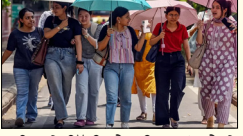
ਬਾਰਿਸ਼ ਨੇ ਦਿੱਲੀ-ਐਨਸੀਅਰ ਤੋਂ ਲੈ ਕੇ ਮਨੀਪੁਰ ਤੱਕ ਤਬਾਹੀ ਮਚਾ ਦਿੱਤੀ ਹੈ। ਹਾਲਾਤ ਦੇ ਮੱਦੇਨਜ਼ਰ ਮੌਸਮ ਵਿਭਾਗ ਨੇ ਦੇਸ਼ ਵਾਸੀਆਂ ਨੂੰ ਚੌਕਸ ਰਹਿਣ ਦੀ ਚਿਤਾਵਨੀ ਦਿੱਤੀ ਹੈ। ਪਹਾੜੀ ਖੇਤਰਾਂ, ਬੀਚਾਂ, ਨਦੀਆਂ, ਨਹਿਰਾਂ ਅਤੇ ਝਰਨੇ ਦੇ ਨੇੜੇ ਨਾ ਜਾਣ ਦੀ ਸਲਾਹ ਦਿੱਤੀ ਜਾਂਦੀ ਹੈ।

ਜਲੰਧਰ, (ਹਰਬੰਸ ਬਿੱਟੂ) ਮੌਸਮ ਵਿਭਾਗ ਪੰਜਾਬ ਦੇ ਵੱਲੋਂ ਭਵਿੱਖਬਾਣੀ ਕਰਦਿਆਂ ਅਲਰਟ ਜਾਰੀ ਕੀਤਾ ਗਿਆ ਹੈ ਕਿ, ਮਾਨਸਾ, ਸੰਗਰੂਰ, ਬਰਨਾਲਾ, ਪਟਿਆਲਾ, ਬਠਿੰਡਾ ਵਿੱਚ ਦਰਮਿਆਨੀ ਮੀਂਹ ਦੇ ਨਾਲ ਅਸਮਾਨੀ ਬਿਜਲੀ ਅਤੇ ਤੇਜ਼ ਹਵਾਵਾਂ (30-40 kmph) ਦੀ ਸੰਭਾਵਨਾ ਹੈ। ਦੱਸ ਦਈਏ ਕਿ, ਕਿਤੇ ਹੜ੍ਹ, ਕਿਤੇ ਜ਼ਮੀਨ ਖਿਸਕਣ, ਕਿਤੇ ਤੂਫਾਨ ਮੌਸਮ ਵਿਭਾਗ ਦੀ ਭਵਿੱਖਬਾਣੀ ਮੁਤਾਬਕ, ਦੇਸ਼ ਭਰ ਦੇ ਕਈ ਸੂਬਿਆਂ 'ਚ ਮਾਨਸੂਨ 'ਮੌਤ' ਵਾਂਗ ਵਧ ਰਿਹਾ ਹੈ।