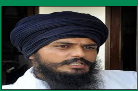
ਮੰਜਿਸਟਰੇਟ ਵੱਲੋਂ ਜਾਰੀ ਪੈਰੋਲ ਹੁਕਮਾਂ ਦੀਆਂ ਸ਼ਰਤਾਂ ਮੁਤਾਬਕ ਕੌਮੀ ਰਾਜਧਾਨੀ ਵਿਚ ਆਪਣੀ ਠਹਿਰ ਦੌਰਾਨ ਅੰਮ੍ਰਿਤਪਾਲ ਸਿੰਘ ਜਾਂ ਉਸ ਦਾ ਕੋਈ ਸਕਾ ਸੰਬੰਧੀ ਜਾਂ ਪਰਿਵਾਰਕ ਮੈਂਬਰ ਮੀਡੀਆ ਵਿਚ ਕਿਸੇ ਤਰ੍ਹਾਂ ਦਾ ਕੋਈ ਬਿਆਨ ਨਹੀਂ ਦੇ ਸਕੇਗਾ।

ਦਿੱਲੀ (ਲੋਕ ਬਾਣੀ)-ਕੌਮੀ ਸੁਰੱਖਿਆ ਐਕਟ (ਐਨਐੱਸਏ) ਤਹਿਤ ਅਸਾਮ ਦੀ ਡਿਥਰੂਗੜ੍ਹ ਜੇਲ੍ਹ ਵਿਚ ਬੰਦ ਖੜੂਰ ਸਾਹਿਬ ਤੋਂ ਸੰਸਦ ਮੈਂਬਰ ਅੰਮ੍ਰਿਤਪਾਲ ਸਿੰਘ ਨੂੰ ਪੈਰੋਲ ਦੌਰਾਨ ਪਰਿਵਾਰਕ ਮੈਂਬਰਾਂ ਨੂੰ ਮਿਲਣ ਦੀ ਖੁੱਲ੍ਹ ਰਹੇਗੀ, ਪਰ ਉਸ ਨੂੰ ਦਿੱਲੀ ਛੱਡਣ ਦੀ ਇਜਾਜ਼ਤ ਨਹੀਂ ਦਿੱਤੀ ਜਾਵੇਗੀ। ਅੰਮ੍ਰਿਤਪਾਲ ਸਿੰਘ ਨੂੰ ਸੰਸਦ ਮੈਂਬਰ ਵਜੋਂ ਸਹੁੰ ਚੁੱਕਣ ਲਈ ਪੈਰੋਲ 'ਤੇ ਅਸਾਮ ਤੋਂ ਦਿੱਲੀ ਲਿਆਂਦਾ ਜਾ ਰਿਹਾ ਹੈ। ਅੰਮ੍ਰਿਤਪਾਲ ਸਿੰਘ ਨੂੰ ਪਿਛਲੇ ਸਾਲ 23 ਅਪਰੈਲ ਨੂੰ ਗ੍ਰਿਫਤਾਰ ਕੀਤਾ ਗਿਆ ਸੀ। ਅੰਮ੍ਰਿਤਸਰ ਦੇ ਜ਼ਿਲ੍ਹਾ