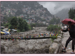
ਗਿਆ ਆਰਜ਼ੀ ਬੈਰੀਕੇਡ ਪੂਰੀ ਤਰ੍ਹਾਂ ਤਬਾਹ ਹੋ ਗਿਆ। ਜ਼ਮੀਨ ਖਿਸਕਣ ਕਾਰਨ ਸੜਕ ਦੇ ਬੰਦ ਹੋਣ ਦਾ ਖ਼ਤਰਾ ਬਣਿਆ ਹੋਇਆ ਹੈ। ਇਸ ਮੌਕੇ ਬਹੁਤ ਸਾਰੇ ਵਹਾਂ ਫਸੇ ਹੋਏ ਹਨ।

ਚੰਡੀਗੜ੍ਹ (ਵਿਨੋਦ ਸ਼ਰਮਾ) ਮੰਡੀ ਜ਼ਿਲ੍ਹੇ ਵਿਚ ਮੌਨਸੂਨ ਨੇ ਤਬਾਹੀ ਮਚਾਉਣੀ ਸ਼ੁਰੂ ਕਰ ਦਿੱਤੀ ਹੈ। ਪਿਛਲੇ ਦੋ ਦਿਨਾਂ ਵਿਚ ਜ਼ਿਲ੍ਹੇ ਦੇ ਪੱਛਮ ਅਤੇ ਕਟੌਲਾ ਵਿਚ 150 ਮਿਲੀਮੀਟਰ ਤੋਂ ਵੱਧ ਮੀਂਹ ਪਿਆ ਹੈ। ਭਾਰੀ ਮੀਂਹ ਕਾਰਨ ਕੀਰਤਪੁਰ-ਮਨਾਲੀ ਚਾਰ ਮਾਰਗੀ ਤੇ ਕੀਰਤਵਾਲ ਤੋਂ ਚਾਰ ਮੀਲ ਦੇ ਨੇੜੇ ਪਿਛਲੇ ਸਾਲ ਲਗਾਇਆ