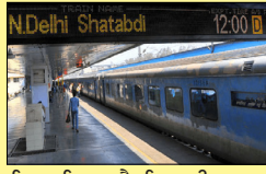
ਕਿਹਾ ਗਿਆ ਹੈ ਕਿ ਕਈ ਕਾਰਨਾਂ ਕਰਕੇ ਵਾਈਫਾਈ ਕੰਮ ਨਹੀਂ ਕਰ ਰਿਹਾ ਹੈ, ਜਿਸ ਨਾਲ ਯਾਤਰੀਆਂ ਨੂੰ ਅਸੁਵੀਧਾ ਹੋ ਰਹੀ ਹੈ। ਬੋਰਡ ਨੇ ਜਨਰਲ ਮੈਨੇਜਰਾਂ ਤੋਂ ਇਕ ਹਫ਼ਤੇ ਵਿਚ ਹਦਾਇਤਾਂ ਦੀ ਪਾਲਣਾ ਸਬੰਧੀ ਕਾਰਵਾਈ ਰਿਪੋਰਟ ਵੀ ਮੰਗੀ ਹੈ।

ਵਾਈ ਫਾਈ ਦੀਆਂ ਸੇਵਾਵਾਂ ਜਲਦ ਰੇਲਵੇ ਸਟੇਸ਼ਨਾਂ ਤੇ ਕੀਤੀਆਂ ਜਾਣਗੀਆਂ ਬਹਾਲ ਨਵੀਂ ਦਿੱਲੀ (ਲੋਕ ਬਾਣੀ)-ਰੇਲਵੇ ਬੋਰਡ ਵੱਲੋਂ ਕਈ ਰੇਵਲੇ ਸਟੇਸ਼ਨਾਂ ਤੇ ਬੰਦ ਪਈਆਂ ਵਾਈ-ਫਾਈ ਸੇਵਾਵਾਂ ਦੇ ਮੱਦਦੇਨਜ਼ਰ ਸ਼ਖ਼ਤ ਨੋਟਿਸ ਲਿਆ ਗਿਆ ਹੈ। ਉਨ੍ਹਾਂ 17 ਜ਼ੋਨਾਂ ਦੇ ਜਨਰਲ ਮੈਨੇਜਰਾਂ (ਸਿਗਨਲ ਅਤੇ ਦੂਰਸੰਚਾਰ) ਨੂੰ ਪੱਤਰ ਜਾਰੀ ਕਰਦਿਆਂ ਸੇਵਾਵਾਂ ਬਹਾਲ ਕਰਨ ਲਈ ਤੁਰੰਤ ਕਦਮ ਚੁੱਕਣ ਲਈ ਕਿਹਾ ਹੈ। ਬੋਰਡ ਅਨੁਸਾਰ ਦੇਸ਼ ਦੇ 7000 ਤੋਂ ਵੱਧ ਸਟੇਸ਼ਨਾਂ ਵਿਚੋਂ 6108 ਸਟੇਸ਼ਨਾਂ ਤੋਂ ਯਾਤਰੀਆਂ ਲਈ ਮੁਫਤ ਵਾਈਫਾਈ ਸੇਵਾਵਾਂ ਉਪਲਬਧ ਹੈ। ਪੱਤਰ ਵਿਚ ਕਿਹਾ ਗਿਆ ਹੈ ਕਿ ਕਈ ਕਾਰਨਾਂ ਕਰਕੇ ਵਾਈਫਾਈ ਕੰਮ ਨਹੀਂ ਕਰ ਰਿਹਾ ਹੈ, ਜਿਸ ਨਾਲ ਯਾਤਰੀਆਂ ਨੂੰ ਅਸੁਵੀਧਾ ਹੋ ਰਹੀ ਹੈ। ਬੋਰਡ ਨੇ ਜਨਰਲ ਮੈਨੇਜਰਾਂ ਤੋਂ ਇਕ ਹਫ਼ਤੇ ਵਿਚ ਹਦਾਇਤਾਂ ਦੀ ਪਾਲਣਾ ਸਬੰਧੀ ਕਾਰਵਾਈ ਰਿਪੋਰਟ ਵੀ ਮੰਗੀ ਹੈ।