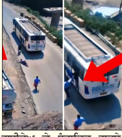
ਹਾਈਵੇਅ ਤੇ ਸੰਭਾਵਿਤ ਹਾਦਸੇ ਕਾਰਨ ਵਿਅਕਤੀਆਂ ਵਿੱਚ ਸਹਿਮ ਦਾ ਮਾਹੌਲ ਹੈ।

ਅਮਰਨਾਥ ਯਾਤਰਾ ਤੋਂ ਵਾਪਸ ਪਰਤੀ ਬੱਸ ਹੋਈ ਹਾਦਸੇ ਦਾ ਸ਼ਿਕਾਰ ਜਲੰਧਰ (ਵਿਸ਼ਾਲ ਸ਼ੈਲੀ) ਰਾਮਬਨ ਨੇੜੇ ਅਮਰਨਾਥ ਦਰਸ਼ਨ ਕਰਕੇ ਪੰਜਾਬ ਪਰਤ ਰਹੇ ਯਾਤਰੀਆਂ ਦੀ ਬੱਸ ਦੀਆਂ ਬ੍ਰੇਕਾਂ ਫੇਲ੍ਹ ਹੋ ਗਈਆਂ। ਚੱਲਦੀ ਬੱਸ ਤੋਂ ਡਾਲ ਮਾਰਨ ਕਾਰਨ ਕਈ ਸ਼ਰਧਾਲੂ ਜ਼ਖ਼ਮੀ ਹੋ ਗਏ। ਹਾਦਸੇ ਵਿਚ ਕਿਸੇ ਦੇ ਮਾਰੇ ਜਾਣ ਦੀ ਖ਼ਬਰ ਨਹੀਂ ਹੈ। ਪੁਲਿਸ ਅਧਿਕਾਰੀਆਂ ਨੇ ਦੱਸਿਆ ਕਿ ਸੁਰੱਖਿਆ ਬਲਾਂ ਨੂੰ ਸੂਚਨਾ ਮਿਲਦੇ ਹੀ ਬੱਸ ਨੂੰ ਰੋਕ ਲਿਆ ਗਿਆ, ਜਿਸ ਨਾਲ ਜੰਮੂ-ਸ਼੍ਰੀਨਗਰ ਨੈਸ਼ਨਲ ਹਾਈਵੇਅ ਤੇ ਸੰਭਾਵਿਤ ਹਾਦਸੇ ਕਾਰਨ ਵਿਅਕਤੀਆਂ ਵਿੱਚ ਸਹਿਮ ਦਾ ਮਾਹੌਲ ਹੈ।