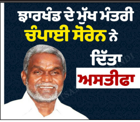
ਝਾਰਖੰਡ ਦੇ ਮੁੱਖ ਮੰਤਰੀ ਚੰਪਾਈ ਸੋਰੇਨ ਨੇ ਦਿੱਤਾ ਅਸਤੀਫਾ

ਚੰਪਾਈ ਸੋਰੇਨ ਨੇ ਝਾਰਖੰਡ ਦੇ ਮੁੱਖ ਮੰਤਰੀ ਦੇ ਅਹੁਦੇ ਤੋਂ ਦਿੱਤਾ ਅਸਤੀਫਾ ਝਾਰਖੰਡ (ਲੋਕ ਬਾਣੀ)- ਝਾਰਖੰਡ ਦੇ ਮੁੱਖ ਮੰਤਰੀ ਚੰਪਾਈ ਸੋਰੇਨ ਨੇ ਰਾਜ ਦੇ ਰਾਜ ਭਵਨ ਵਿਚ ਰਾਜਪਾਲ ਸੀ.ਪੀ. ਰਾਧਾਕ੍ਰਿਸ਼ਨਨ ਨੂੰ ਅਸਤੀਫਾ ਸੌਂਪਿਆ। ਅਸਤੀਫਾ ਸੌਂਪਣ ਤੋਂ ਬਾਅਦ ਚੰਪਾਈ ਸੋਰੇਨ ਨੇ ਕਿਹਾ ਕਿ ਕੁਝ ਦਿਨ ਪਹਿਲਾਂ, ਮੈਨੂੰ ਮੁੱਖ ਮੰਤਰੀ ਬਣਾਇਆ ਗਿਆ ਸੀ ਅਤੇ ਮੈਨੂੰ ਰਾਜ ਦੀ ਜ਼ਿੰਮੇਵਾਰੀ ਮਿਲੀ ਸੀ। ਹੇਮੰਤ ਸੋਰੇਨ ਦੇ ਵਾਪਸ ਆਉਣ ਤੋਂ ਬਾਅਦ, ਸਾਡੇ ਗੱਠਜੋੜ ਨੇ ਇਹ ਫੈਸਲਾ ਲਿਆ ਹੈ ਅਤੇ ਅਸੀਂ ਹੇਮੰਤ ਨੂੰ ਚੁਣਿਆ। ਸੋਰੇਨ ਸਾਡੇ ਨੇਤਾ ਹਨ, ਹੁਣ ਮੈਂ ਮੁੱਖ ਮੰਤਰੀ ਦੇ ਅਹੁਦੇ ਤੋਂ ਅਸਤੀਫਾ ਦੇ ਦਿੱਤਾ ਹੈ।