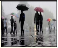
ਨੂੰ ਸਾਫ਼-ਸਫ਼ਾਈ ਦਾ ਵਿਸ਼ੇਸ਼ ਧਿਆਨ ਰੱਖਣ ਦੀਆਂ ਹਦਾਇਤਾਂ ਜਾਰੀ ਕੀਤੀਆਂ ਗਈਆਂ ਹਨ।

ਪੰਜਾਬ ਵਿੱਚ ਬਰਸਾਤੀ ਮੌਸਮ ਕਾਰਨ ਸਿਹਤ ਵਿਭਾਗ ਨੂੰ ਮਿਲੇ ਆਦੇਸ਼ ਜਲੰਧਰ (ਵਿਸ਼ਾਲ ਸ਼ੈਲੀ)-ਪੰਜਾਬ ਚ ਮਾਨਸੂਨ ਨੇ ਦਸਤਕ ਦੇ ਦਿੱਤੀ ਹੈ, ਜਿਸ ਨਾਲ ਅੱਤ ਦੀ ਗਰਮੀ ਤੋਂ ਕਾਫ਼ੀ ਰਾਹਤ ਮਿਲੀ ਹੈ ਪਰ ਬਰਸਾਤਾਂ ਦੇ ਦਿਨਾਂ 'ਚ ਖਾਣ-ਪੀਣ ਨਾਲ ਸਬੰਧਿਤ ਕਈ ਤਰ੍ਹਾਂ ਦੀਆਂ ਬਿਮਾਰੀਆਂ ਦੇ ਮਾਮਲੇ ਵੀ ਵੱਧ ਜਾਂਦੇ ਹਨ। ਸਿਹਤ ਮਾਰਗ ਅਨੁਸਾਰ ਬਰਸਾਤਾਂ ਦੇ ਦਿਨਾਂ 'ਚ 5 ਸਾਲ ਦੀ ਉਮਰ ਤੱਕ ਦੇ ਬੱਚੇ ਪੇਟ ਦੀਆਂ ਬਿਮਾਰੀਆਂ ਦਾ ਜ਼ਿਆਦਾ ਸ਼ਿਕਾਰ ਹੁੰਦੇ ਹਨ। ਇਸ ਨੂੰ ਦੇਖਦਿਆਂ ਸਿਹਤ ਵਿਭਾਗ ਹਰਕਤ 'ਚ ਆ ਗਿਆ ਹੈ ਅਤੇ ਸਾਰੇ ਸਰਕਾਰੀ ਸਕੂਲਾਂ ਨੂੰ ਸਾਫ਼-ਸਫ਼ਾਈ ਦਾ ਵਿਸ਼ੇਸ਼ ਧਿਆਨ ਰੱਖਣ ਦੀਆਂ ਹਦਾਇਤਾਂ ਜਾਰੀ ਕੀਤੀਆਂ ਗਈਆਂ ਹਨ।