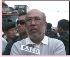
ਮਦਦ ਪ੍ਰਦਾਨ ਕਰਨ ਜਾ ਰਹੀ ਹੈ ਅਤੇ ਹੁਣ ਅੰਦਰੂਨੀ ਪਿੰਡਾਂ ਤੋਂ ਬਚਾਅ ਕਾਰਜ ਚੱਲ ਰਹੇ ਹਨ, ਮੈਨੂੰ ਲੱਗਦਾ ਹੈ ਕਿ ਜੇਕਰ ਬਾਰਿਸ਼ ਹੁੰਦੀ ਹੈ ਤਾਂ ਸਾਨੂੰ ਬੜਾ ਸਾਵਧਾਨ ਰਹਿਣਾ ਚਾਹੀਦਾ ਹੈ।

ਹੜ ਪ੍ਰਭਾਵਿਤ ਇਲਾਕਿਆਂ ਦਾ ਮਨੀਪੁਰ ਦੇ ਮੁੱਖ ਮੰਤਰੀ ਨੇ ਕੀਤਾ ਦੌਰਾ ਮਨੀਪੁਰ (ਲੋਕ ਬਾਣੀ) ਮਨੀਪੁਰ ਦੇ ਮੁੱਖ ਮੰਤਰੀ ਐਨ. ਬੀਰੇਨ ਸਿੰਘ ਨੇ ਹੜਾਂ ਨਾਲ ਪ੍ਰਭਾਵਿਤ ਰਿਹਾਇਸ਼ੀ ਇਲਾਕਿਆਂ ਦਾ ਮੁਆਇਨਾ ਕੀਤਾ। ਉਨ੍ਹਾਂ ਨੇ ਕਿਹਾ ਕਿ ਇਹ ਦੂਸਰੀ ਵਾਰ ਹੈ ਜਦੋਂ ਗੜੇਮਾਰੀ ਤੋਂ ਬਾਅਦ ਹੜ ਆਇਆ ਹੈ। ਇਹ ਬਹੁਤ ਮੁਸ਼ਕਲ ਹੈ। ਐਨ. ਡੀ. ਆਰ. ਐਫ. ਦੀਆਂ ਦੋ ਟੀਮਾਂ ਪਹਿਲਾਂ ਹੀ ਸਾਜ਼ੋ-ਸਾਮਾਨ ਦੇ ਨਾਲ ਭੇਜੀਆਂ ਜਾ ਚੁੱਕੀਆਂ ਹਨ। ਜਿਨ੍ਹਾਂ ਤੇ ਰਾਜ ਪੁਲਿਸ ਬਲ ਅਤੇ ਅਸਾਮ ਰਾਈਫਲਜ਼, ਸਾਰੇ ਸ਼ਾਮਿਲ ਹਨ। ਸਰਕਾਰ 24 ਘੰਟੇ ਹਰ ਸੰਭਵ ਮਦਦ ਪ੍ਰਦਾਨ ਕਰਨ ਜਾ ਰਹੀ ਹੈ ਅਤੇ ਹੁਣ ਅੰਦਰੂਨੀ ਪਿੰਡਾਂ ਤੋਂ ਬਚਾਅ ਕਾਰਜ ਚੱਲ ਰਹੇ ਹਨ, ਮੈਨੂੰ ਲੱਗਦਾ ਹੈ ਕਿ ਜੇਕਰ ਬਾਰਿਸ਼ ਹੁੰਦੀ ਹੈ ਤਾਂ ਸਾਨੂੰ ਬੜਾ ਸਾਵਧਾਨ ਰਹਿਣਾ ਚਾਹੀਦਾ ਹੈ।