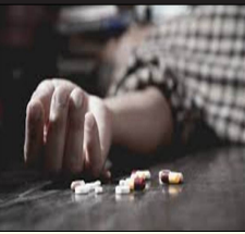
ਨਾਲ ਆਪਣੀ ਜਾਨ ਗਵਾ ਚੁੱਕੇ ਹਨ।

ਪੰਜਾਬ ਵਿੱਚ ਬਗੈਰ ਨਾਗਾਂ ਇਕ ਹੋਰ ਨੌਜਵਾਨ ਦੀ ਨਸ਼ੇ ਕਾਰਨ ਹੋਈ ਮੌਤ ਬਠਿੰਡਾ (ਲੋਕ ਬਾਣੀ) ਪੰਜਾਬ ਵਿੱਚ ਨਹੀਂ ਰੁਕ ਰਹੀ ਨਸ਼ੇ ਕਾਰਨ ਮਰਨ ਵਾਲਿਆਂ ਦੀ ਗਿਣਤੀ ਬਠਿੰਡਾ ਦੀ ਗੋਨਿਆਣਾ ਮੰਡੀ ਚ ਨਸ਼ੇ ਦੀ ਵੱਧ ਮਾਤਰਾ ਕਾਰਨ ਇਕ ਨੌਜਵਾਨ ਦੀ ਮੌਤ ਹੋਣ ਦਾ ਮਾਮਲਾ ਸਾਹਮਣੇ ਆਇਆ ਹੈ। ਨੌਜਵਾਨ ਦੀ ਲਾਸ਼ ਗੋਨਿਆਣਾ ਮੰਡੀ ਦੇ ਰਾਮਬਾਗ ਦੇ ਪਿੰਡੇ ਪਈ ਹੋਈ ਸੀ ਜਿਸ ਤੋਂ ਸਾਫ਼ ਪਤਾ ਚੱਲਦਾ ਹੈ ਕਿ ਨੌਜਵਾਨ ਨੇ ਨਸ਼ੇ ਦੀ ਓਵਰਡੋਜ਼ ਲੈ ਲਈ ਜਿਸ ਕਾਰਨ ਉਸ ਦੀ ਮੌਤ ਹੋ ਗਈ ਹੈ। ਪੁਲਿਸ ਵੱਲੋਂ ਮਾਮਲੇ ਦੀ ਜਾਂਚ ਕੀਤੀ ਜਾ ਰਹੀ ਹੈ ਤੇ ਲਾਸ਼ ਨੂੰ ਸਿਵਲ ਹਸਪਤਾਲ ਬਠਿੰਡਾ ਵਿਖੇ ਰੱਖਿਆ ਗਿਆ ਹੈ। ਜ਼ਿਕਰਯੋਗ ਕਹਿ ਕੇ ਬਠਿੰਡਾ ਜ਼ਿਲ੍ਹੇ ਅੰਦਰ ਇਕ ਹਫਤੇ ਚ ਛੇ ਨੌਜਵਾਨ ਨਸ਼ੇ ਦੀ ਓਵਰਡੋਜ਼