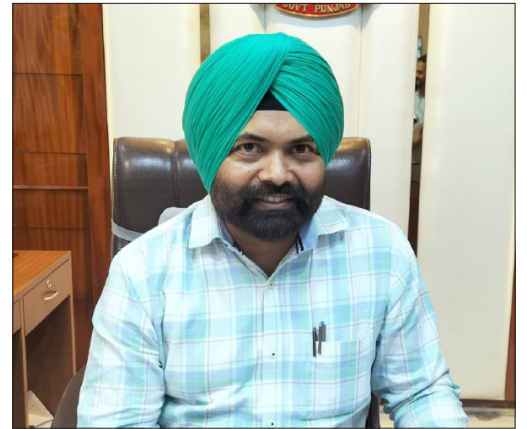
ਜਾਣਗੀਆਂ। ਉਨ੍ਹਾਂ ਦੱਸਿਆ ਕਿ ਸਮੂਹ ਵਿਭਾਗ ਇਨ੍ਹਾਂ ਜਨ ਸੁਣਵਾਈ ਕੈਂਪਾਂ ਵਿੱਚ ਹਾਜ਼ਰ ਹੋ ਕੇ ਲੋਕਾਂ ਦੀਆਂ ਮੁਸ਼ਕਲਾਂ ਦਾ ਤੁਰੰਤ ਨਿਪਟਾਰਾ ਕਰਨ ਨੂੰ ਯਕੀਨੀ ਬਣਾਏਗਾ। ਡਿਪਟੀ ਕਮਿਸ਼ਨਰ ਨੇ ਸਬੰਧਤ ਪਿੰਡਾਂ ਦੇ ਵਾਸੀਆਂ ਨੂੰ ਇਨ੍ਹਾਂ ਕੈਂਪਾਂ ਦਾ ਵੱਧ ਤੋਂ ਵੱਧ ਲਾਭ ਲੈਣ ਦੀ ਅਪੀਲ ਕੀਤੀ।

ਇਸ ਤੋਂ ਇਲਾਵਾ ਉਨ੍ਹਾਂ ਅੱਗੇ ਦੱਸਿਆ ਕਿ ਮਿਤੀ 19 ਜੁਲਾਈ ਦਿਨ ਸ਼ੁੱਕਰਵਾਰ ਨੂੰ ਫਤਿਹਗੜ੍ਹ ਪੰਜਤੂਰ ਦੇ ਗੁਰਦੁਆਰਾ ਸਿੰਘ ਸਭਾ ਵਿਖੇ ਮੁੰਡੀ ਜਮਾਲ, ਕਾਦਰਵਾਲਾ, ਲਲਿਹਾਦੀ, ਫਤਿਹਗੜ੍ਹ ਪੰਜਤੂਰ ਪਿੰਡਾਂ ਦੇ ਵਾਸੀਆਂ ਦੀਆਂ ਮੁਸ਼ਕਲਾਂ ਸੁਣੀਆਂ ਜਾਣਗੀਆਂ। ਮਿਤੀ 24 ਜੁਲਾਈ ਦਿਨ ਬੁੱਧਵਾਰ ਨੂੰ ਨੱਬੂਵਾਲਾ ਗਰਬੀ ਦੇ ਗੁਰਦੁਆਰਾ ਗੁਰੂ ਪ੍ਰਕਾਸ਼ ਵਿਖੇ ਵੱਡਾ ਘਰ, ਛੋਟਾ ਘਰ, ਨੱਬੂਵਾਲਾ ਗਰਬੀ, ਗੱਜਣਵਾਲਾ ਪਿੰਡਾਂ ਦੇ ਵਾਸੀਆਂ ਦੀਆਂ ਮੁਸ਼ਕਲਾਂ ਸੁਣੀਆਂ ਜਾਣਗੀਆਂ। ਮਿਤੀ 26 ਜੁਲਾਈ ਦਿਨ ਸ਼ੁੱਕਰਵਾਰ ਨੂੰ ਮਾਣੂਕੇ ਦੇ ਪੰਚਾਇਤ ਘਰ ਵਿਖੇ ਘੋਲੀਆ, ਮਾਣੂਕੇ ਖੁਰਦ, ਰਣੀਆਂ, ਖੋਟਾ, ਕਿਸ਼ਨਗੜ੍ਹ ਪਿੰਡਾਂ ਦੇ ਵਾਸੀਆਂ ਦੀਆਂ ਮੁਸ਼ਕਲਾਂ ਸੁਣੀਆਂ ਜਾਣਗੀਆਂ। ਮਿਤੀ 31 ਜੁਲਾਈ ਦਿਨ ਬੁੱਧਵਾਰ ਨੂੰ ਘੱਲ ਕਲਾਂ ਦੇ ਗੁਰਦੁਆਰਾ ਗੁਰੂਸਰ ਸਾਹਿਬ ਵਿਖੇ ਡਰੋਲੀ ਭਾਈ, ਘੱਲ ਕਲਾਂ, ਸਲੀਣਾ, ਖੋਸਾ ਪਾਂਡੋ, ਰੱਤੀਆਂ ਪਿੰਡਾਂ ਦੇ ਵਾਸੀਆਂ ਦੀਆਂ ਮੁਸ਼ਕਲਾਂ ਸੁਣੀਆਂ