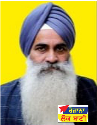
ਰੋਜ਼ਾਨਾ ਲੋਕ ਬਾਣੀ

ਸ੍ਰੀ ਅਨੰਦਪੁਰ ਸਾਹਿਬ, (ਦਵਿੰਦਰਪਾਲ ਸਿੰਘ): ਗੁਰੂ ਨਗਰੀ ਸ੍ਰੀ ਅਨੰਦਪੁਰ ਸਾਹਿਬ ਦੇ ਸਾਰੇ ਬਜ਼ਾਰ ਹਰ ਸਾਲ ਦੀ ਤਰਾਂ ਇਸ ਵਾਰ ਵੀ ਗਰਮੀਆਂ ਦੀਆਂ ਛੁੱਟੀਆਂ ਦੇ ਚਲਦਿਆਂ 27 ਤੋਂ 30 ਜੂਨ ਤੱਕ ਚਾਰ ਦਿਨ ਮੁਕੰਮਲ ਤੌਰ ਤੇ ਬੰਦ ਰਹਿਣ ਤੋਂ ਬਾਅਦ ਅੱਜ 1 ਜੁਲਾਈ ਨੂੰ ਖੁਲ ਗਏ ਹਨ। ਅੱਜ ਚਾਰ ਦਿਨਾਂ ਬਾਅਦ ਖੁੱਲੀਆਂ ਦੁਕਾਨਾਂ ਤੋਂ ਬਾਅਦ ਬਜ਼ਾਰਾਂ ਵਿਚ ਮੁੜ ਰੋਣਕਾਂ ਪਰਤ ਆਈਆਂ।