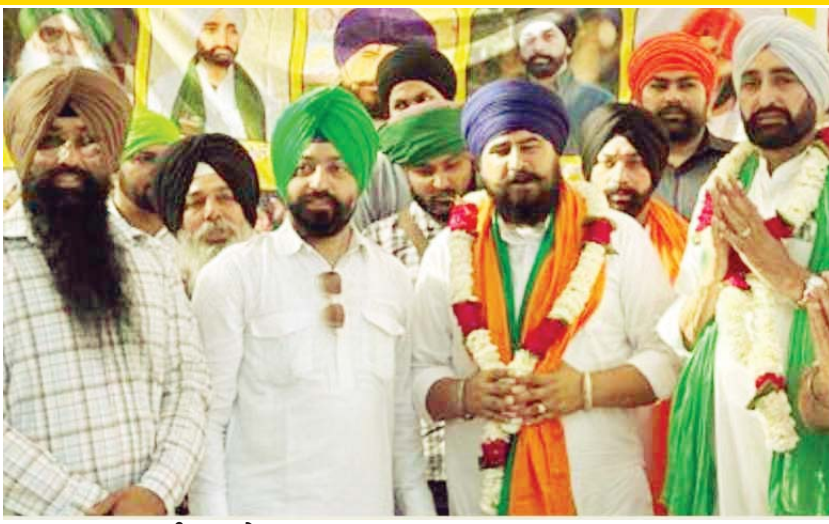
ਦਰਜ ਕੀਤਾ ਜਾਵੇ।