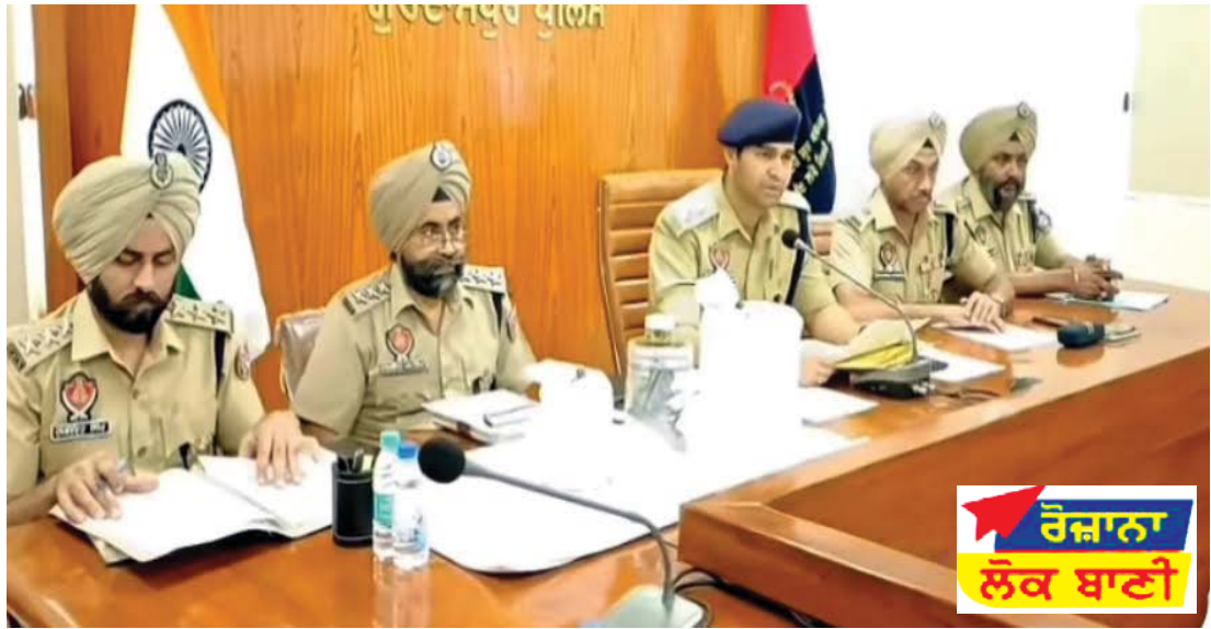
ਰੋਜ਼ਾਨਾ ਲੋਕ ਬਾਣੀ

ਬਣਵਾਉਣ ਕਿਉਂਕਿ ਭਵਿੱਖ ਵਿੱਚ ਨੌਜਵਾਨ ਹੀ ਹਨ ਜੋ ਦੇਸ਼ ਦੇ ਲੋਕਤੰਤਰ ਨੂੰ ਬਰਕਰਾਰ ਰੱਖ ਸਕਦੇ ਹਨ। ਉਨ੍ਹਾਂ ਕਿਹਾ ਵਿਦਿਆਰਥੀ ਆਪਣੇ ਪਿੰਡਾਂ ਵਿੱਚ ਅਤੇ ਆਲੇ ਦੁਆਲੇ ਦੇ ਲੋਕਾਂ ਦੀ ਵੋਟ ਬਣਵਾਉਣ ਅਤੇ ਹਰ ਇੱਕ ਵਿਅਕਤੀ ਨੂੰ ਆਉਣ ਵਾਲੀਆਂ ਚੋਣਾਂ ਵਿੱਚ ਵੋਟ ਦੇ ਅਧਿਕਾਰ ਦਾ ਪ੍ਰਯੋਗ ਕਰਨ ਲਈ ਕਹਿਣਾ। ਇਸ ਮੌਕੇ ਵਿਦਿਆਰਥੀਆਂ ਦੁਆਰਾ ਰੰਗੋਲੀ ਦਾ ਪ੍ਰਦਰਸ਼ਨ ਕੀਤਾ ਗਿਆ ਜਿਸਨੂੰ ਮੁੱਖ ਮਹਿਮਾਨ ਜੀ ਦੁਆਰਾ ਸਰਾਹਿਆ ਗਿਆ। ਇਸ ਮੌਕੇ ਵਿਦਿਆਰਥੀਆਂ ਦੁਆਰਾ ਵੋਟਰ ਜਾਗਰੂਕਤਾ ਸੰਬੰਧੀ ਸਕਿੱਟ, ਡਾਂਸ, ਨਾਟਕ, ਗੀਤ ਅਤੇ ਵਿਦਿਆਰਥਣਾਂ ਦੁਆਰਾ ਨਿਵੇਕਲੇ ਢੰਗ ਨਾਲ ਗਿੱਧੇ ਦੇ ਰੂਪ ਵਿੱਚ ਚੋਣ ਬੋਲੀਆਂ ਪੇਸ਼ ਕੀਤੀਆਂ ਗਈਆਂ।