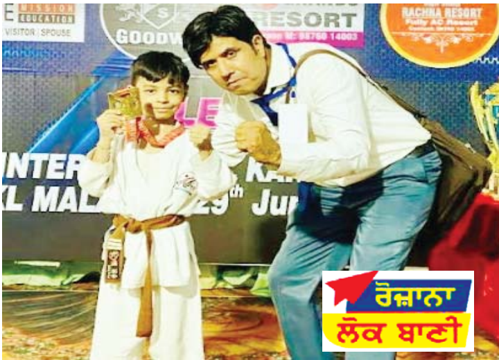
ਰੋਜ਼ਾਨਾ ਲੋਕ ਬਾਣੀ