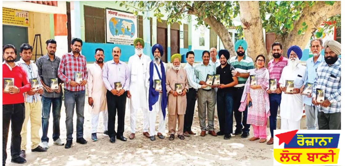
ਰੋਜ਼ਾਨਾ ਲੋਕ ਬਾਣੀ

ਨਵ ਪੰਜਾਬੀ ਸਾਹਿਤ ਸਭਾ ਕੋਟ ਈਸੇ ਖਾਂ ਦੀ ਮਹੀਨਾਵਾਰ ਮੀਟਿੰਗ ਹੋਈ