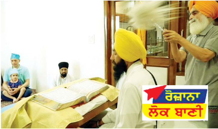
ਰੋਜ਼ਾਨਾ ਲੋਕ ਬਾਣੀ