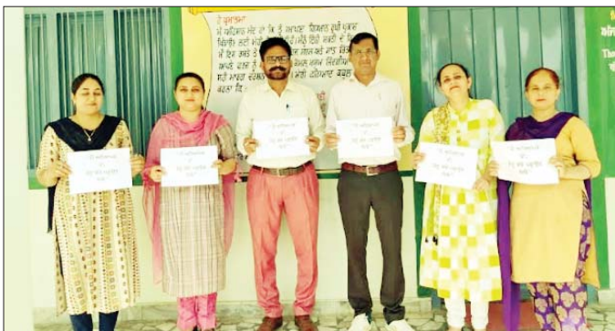
ਅਧਿਆਪਕਾਂ ਨੇ ਸਰਕਾਰੀ ਸਕੂਲਾਂ ਵਿੱਚ ਪੜ੍ਹਦੇ ਵਿਦਿਆਰਥੀਆਂ ਦੀ ਪੜ੍ਹਾਈ ਅਤੇ ਅਧਿਆਪਕ ਕਿੱਤੇ ਨੂੰ ਅਸਲੀਅਤ ਨਾਲ ਜੋੜਨ ਦੀ ਮੰਗ

ਗੁਰੂਗਰਸਹਾਏ -ਐਲੀਮੈਂਟਰੀ ਟੀਚਰਜ਼ ਯੂਨੀਅਨ ਪੰਜਾਬ ਦੀ 21 ਅਪ੍ਰੈਲ ਦੇ ਸਟੇਟ ਮੀਟਿੰਗ ਵਿੱਚ ਲਏ ਫੈਸਲੇ ਅਨੁਸਾਰ ਪ੍ਰਾਇਮਰੀ ਅਧਿਆਪਕ ਅਤੇ ਪ੍ਰਾਇਮਰੀ ਅਧਿਆਪਕਾਂ ਨਾਲ ਸਬੰਧਤ ਅਧਿਆਪਕਾਂ ਜਥੇਬੰਦੀਆਂ ਨੇ ਪੰਜਾਬ ਸਰਕਾਰ ਤੋਂ ਮੰਗ ਕੀਤੀ ਕਿ "ਮੈਂ ਅਧਿਆਪਕ ਹਾਂ, ਮੈਨੂੰ ਬੱਚੇ ਪੜ੍ਹਾਉਣ ਦਿਓ"। ਲੋਗੋ ਵਾਲੀਆਂ ਤਖਤੀਆਂ ਫੜ ਕੇ ਮੰਗ ਕੀਤੀ ਗਈ ਕੇ ਸਾਨੂੰ ਸਰਕਾਰ ਨੇ ਸਕੂਲਾਂ ਵਿੱਚ ਵਿਦਿਆਰਥੀਆਂ ਨੂੰ ਪੜ੍ਹਾਉਣ ਲਈ ਲਗਾਇਆ ਹੈ। ਜਿਸ ਕਰਕੇ ਸਾਨੂੰ ਸਿਰਫ ਪੜ੍ਹਾਉਣ ਦਾ ਕੰਮ ਹੀ ਦਿੱਤਾ ਜਾਵੇ। ਵਿਭਾਗ ਵੱਲੋਂ ਅਧਿਆਪਕਾਂ ਤੋਂ ਲਏ ਜਾਂਦੇ ਗੈਰ ਵਿੱਦਿਅਕ ਕੰਮ ਬੀਐੱਲਓ ਦੀਆਂ ਡਿਊਟੀਆਂ ਅਤੇ ਦਫ਼ਤਰਾਂ ਦੀਆਂ ਡਿਊਟੀਆਂ ਬਿਲਕੁੱਲ ਬੰਦ ਕੀਤੀਆਂ ਜਾਣ। ਕਿਉਂਕਿ ਇਹ ਸਭ ਕੰਮ ਬੱਚਿਆਂ ਦੀ ਪੜ੍ਹਾਈ ਦਾ ਨੁਕਸਾਨ ਕਰਦੀਆਂ ਹਨ। ਖਾਸ ਕਰਕੇ ਪ੍ਰਾਇਮਰੀ ਵਾਲੇ ਬੱਚੇ ਪੂਰਾ ਦਿਨ ਅਧਿਆਪਕ ਦੀ ਜਮਾਤ ਵਿੱਚ ਹਾਜ਼ਰੀ ਮੰਗਦੇ ਹਨ। ਇਸ ਮੰਗ ਵਿੱਚ ਜ਼ਿਲ੍ਹੇ ਦੇ ਸਮੂਹ