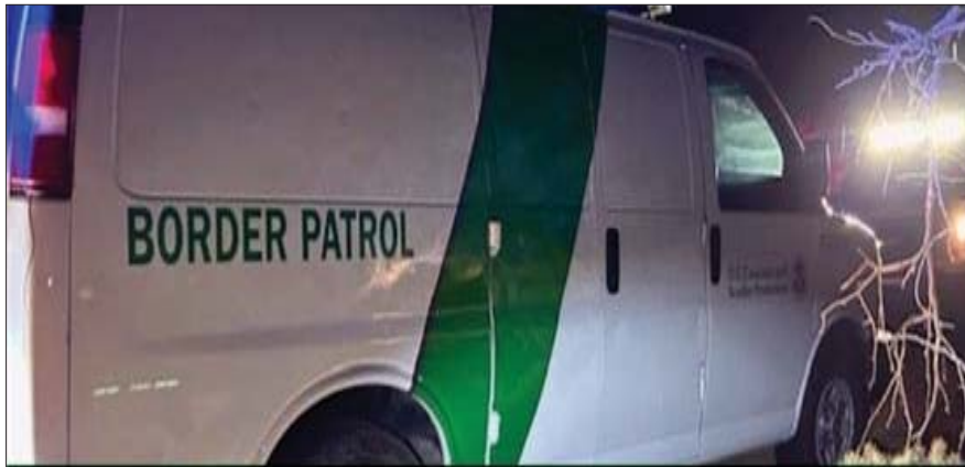
ਅਮਰੀਕਾ-ਮੈਕਸੀਕੋ ਲਾਈਨ ਨੇੜੇ ਫਰਜ਼ੀ ਬਾਰਡਰ ਪੈਟਰੋਲ ਵਾਹਨ ਬਰਾਮਦ, 12 ਲੋਕ ਗ੍ਰਿਫ਼ਤਾਰ

ਨਿਊਯਾਰਕ ਯੂ.ਐਸ. ਕਸਟਮਜ਼ ਅਤੇ ਬਾਰਡਰ ਪ੍ਰੋਟੈਕਸ਼ਨ ਦੇ ਏਜੰਟਾਂ ਨੂੰ ਇਸ ਹਫ਼ਤੇ ਦੇ ਸ਼ੁਰੂ ਵਿੱਚ ਐਰੀਜ਼ੋਨਾ ਵਿੱਚ ਇੱਕ ਸਟਾਪ ਦੌਰਾਨ ਇੱਕ ਕਲੋਨ ਨਕਲੀ ਬਾਰਡਰ ਪੈਟਰੋਲ ਵੈਨ ਮਿਲੀ। ਯੂ.ਐਸ. ਕਸਟਮਜ਼ ਅਤੇ ਬਾਰਡਰ ਪ੍ਰੋਟੈਕਸ਼ਨ ਏਜੰਸੀ ਨੇ ਕਿਹਾ ਕਿ ਵੈਨ ਨੂੰ ਉਨ੍ਹਾਂ ਦੇ ਵਾਹਨਾਂ ਵਾਂਗ ਹੀ ਦਿਸਣ ਲਈ ਪੇਂਟ ਕੀਤਾ ਗਿਆ ਸੀ। ਵਾਹਨ ਵਿੱਚ ਇੱਕ ਡਰਾਈਵਰ ਸਮੇਤ ਅਤੇ 11 ਲੋਕ ਸਵਾਰ ਸਨ, ਜਿਨ੍ਹਾਂ ਨੂੰ ਨਿਊਫੀਲਡ ਨੇੜੇ ਹਿਰਾਸਤ ਵਿੱਚ ਲਿਆ ਗਿਆ ਜੋ ਸੈਨ ਮਿਗੁਏਲ ਤੋਂ ਸੱਤ ਮੀਲ ਦੀ ਦੂਰੀ 'ਤੇ ਦੱਖਣ-ਪੂਰਬ ਦੇ ਵਿੱਚ ਹੈ।