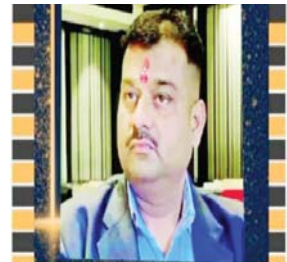
ਯੂ ਟੀਵੀ ਪੰਜਾਬ ਭਰ 'ਚੋਂ ਆਵਾਜ਼ੇ ਨੂੰ ਮਿਲ ਰਹੇ ਪਿਆਰ ਅਤੇ ਸਹਿਯੋਗ ਦਾ ਇੱਕ ਪੰਨਾਵਾ