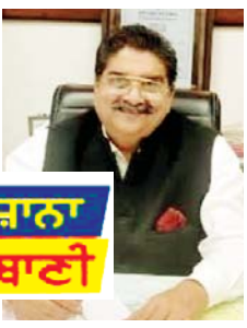
ਰੋਜ਼ਾਨਾ ਲੋਕ ਬਾਣੀ

ਦੇ ਪ੍ਰਦਰਸ਼ਨ ਦੀ ਮਨਾਹੀ ਕੀਤੀ ਹੈ। ਫੌਜਦਾਰੀ ਜ਼ਾਬਤਾ ਸੰਘਤਾ 1973 (1974) ਦੇ ਐਕਟ 2 ਦੀ ਧਾਰਾ 144 ਅਧੀਨ ਪ੍ਰਾਪਤ ਹੋਏ ਅਧਿਕਾਰਾਂ ਦੀ ਵਰਤੋਂ ਤਹਿਤ ਜਾਰੀ ਇਨ੍ਹਾਂ ਹੁਕਮਾਂ 'ਚ ਜ਼ਿਲ੍ਹੇ 'ਚ ਕਿਸੇ ਵੀ ਤਰ੍ਹਾਂ ਦੇ ਮੈਰਿਜ ਪੈਲੇਸ/ਰਿਜ਼ੋਰਟ, ਮੇਲੇ, ਧਾਰਮਿਕ ਸਥਾਨਾਂ, ਜਲੂਸ, ਬਰਾਤ, ਵਿਆਹ ਪਾਰਟੀਆਂ ਜਾਂ ਹੋਰ ਸਮਾਗਮ/ਜਨਤਕ ਇਕੱਠਾਂ ਅਤੇ ਵਿਦਿਅਕ