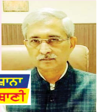
ਰੋਜ਼ਾਨਾ ਲੋਕ ਬਾਣੀ