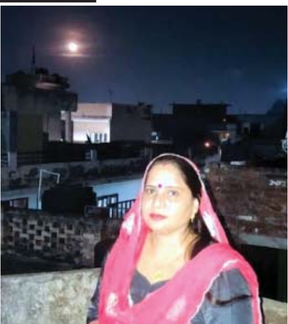
ਕਰਵਾਚੋਥ ਦਾ ਵਰਤ ਰੱਖ ਕੇ ਚੰਦਰਮਾਂ ਨੂੰ ਅਰਗ ਦਿੰਦੀਆਂ ਸੁਹਾਗਣਾਂ