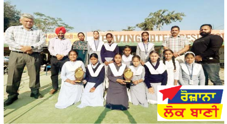
ਰੋਜ਼ਾਨਾ ਲੋਕ ਬਾਣੀ

ਬੋਲੀਕਾਰ ਨੂੰ ਮੱਛੀ ਫੜਨ ਲਈ ਜਹਿਰੀਲੀ ਦਵਾਈ ਜਾਂ ਬਿਜਲੀ ਦਾ ਕਰੰਟ ਵਰਤਣ ਦੀ ਮਨਾਹੀ ਹੋਵੇਗੀ। ਬੋਲੀਕਾਰ ਮੱਛੀ ਫੜਨ ਸਮੇਂ ਨਹਿਰ/ਬਰਾਂਚ ਨੂੰ ਕੋਈ ਨੁਕਸਾਨ ਨਹੀਂ ਪਹੁੰਚਾਏਗਾ ਅਤੇ ਨਾ ਹੀ ਮਨਾਹੀ ਵਾਲੇ ਏਰੀਏ ਵਿੱਚ ਮੱਛੀ ਫੜੇਗਾ। ਇਸ ਤੋਂ ਇਲਾਵਾ ਬੋਲੀਕਾਰ ਆਪਣੇ ਨਾਲ ਆਪਣੇ ਅਸਲ ਆਈ.ਡੀ. ਪਰੂਫ ਅਤੇ ਉਸ ਦੀ ਕਾਪੀ ਨਾਲ ਲੈ ਕੇ ਆਉਣਾ।