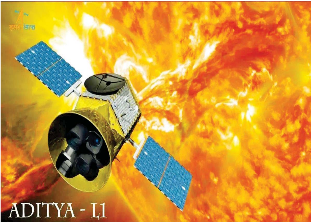
ADITYA - L1

ਕੁੱਲ 125 ਦਿਨਾਂ 'ਚ ਸੂਰਜ ਦੇ ਨੇੜੇ ਆਰਬਿਟ 'ਤੇ ਪਹੁੰਚ ਜਾਵੇਗਾ। ਸੂਰਜ ਦੇ ਬਹੁਤ ਨੇੜੇ ਜਾਣ ਬਾਰੇ ਕੋਈ ਸੋਚ ਵੀ ਨਹੀਂ ਸਕਦਾ, ਪਰ ਸੂਰਜ ਦੇ ਨੇੜੇ ਇੱਕ ਸੁਰੱਖਿਅਤ ਆਰਬਿਟ ਹੈ, ਜਿਸ ਤੱਕ ਪਹੁੰਚ ਕੇ ਕੋਈ ਵਾਹਨ ਚੱਕਰ ਲਗਾਉਂਦਾ ਹੈ। 1 ਸੂਰਜ ਨੂੰ ਦੇਖ ਸਕਦਾ ਹੈ। ਸੂਰਜ ਦੇ ਨੇੜੇ ਇਹ ਸੁਰੱਖਿਅਤ ਪੰਚ ਧਰਤੀ ਤੋਂ ਲਗਭਗ 15 ਲੱਖ ਕਿਲੋਮੀਟਰ ਦੂਰ ਹੈ। ਆਦਿਤਿਆ