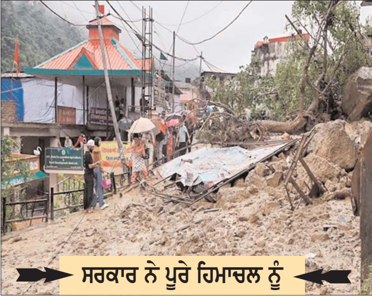
ਸਰਕਾਰ ਨੇ ਪੂਰੇ ਹਿਮਾਚਲ ਨੂੰ