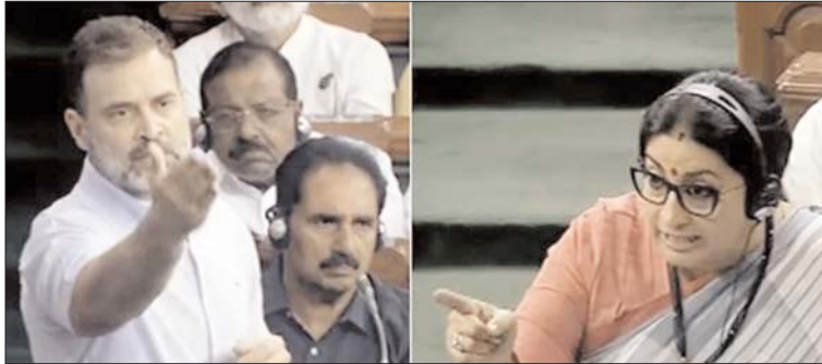
ਫਲਾਇੰਗ ਕਿਸ ਕੀਤੀ ਅਤੇ ਬਾਹਰ ਨਿਕਲ ਗਏ ਰਾਹੁਲ

ਕਾਂਗਰਸ ਨੇਤਾ ਰਾਹੁਲ ਗਾਂਧੀ ਫਿਰ ਵਿਵਾਦਾਂ 'ਚ ਆ ਗਏ ਹਨ। ਬੁੱਧਵਾਰ ਨੂੰ ਉਨ੍ਹਾਂ ਨੇ ਅਵਿਸ਼ਵਾਸ ਪ੍ਰਸਤਾਵ 'ਤੇ ਚਰਚਾ ਦੌਰਾਨ ਸੰਸਦ 'ਚ ਭਾਜਪਾ ਮੈਂਬਰਾਂ ਨੂੰ 'ਫਲਾਇੰਗ ਕਿੱਸ' ਕੀਤੀ। ਰਾਹੁਲ ਦੀ ਇਸ ਹਰਕਤ 'ਤੇ ਕਈ ਮਹਿਲਾ ਮੈਂਬਰਾਂ ਵੱਲੋਂ ਲੋਕ ਸਭਾ ਸਪੀਕਰ ਨੂੰ ਸ਼ਿਕਾਇਤ ਕੀਤੀ ਗਈ ਹੈ। ਉਥੇ ਹੀ ਕੇਂਦਰੀ ਮੰਤਰੀ ਸਮ੍ਰਿਤੀ ਈਰਾਨੀ ਨੇ ਇਸਨੂੰ ਅਸਲੀਲ ਹਰਕਤ ਦੱਸਿਆ ਹੈ। ਦੱਸ ਦੇਈਏ ਕਿ ਕਾਂਗਰਸ ਨੇਤਾ ਰਾਹੁਲ ਗਾਂਧੀ ਨੇ ਬੁੱਧਵਾਰ ਨੂੰ ਸੰਸਦ ਮੈਂਬਰਾਂ ਦੇ ਰੂਪ 'ਚ ਬਹਾਲ ਹੋਣ ਤੋਂ ਬਾਅਦ ਪਹਿਲੀ ਵਾਰ ਪਾਰਲੀਮੈਂਟ 'ਚ ਆਪਣਾ ਭਾਸ਼ਣ ਦਿੱਤਾ। ਰਾਹੁਲ ਜਦੋਂ ਭਾਸ਼ਣ ਖਤਮ ਹੋਣ ਤੋਂ ਬਾਅਦ ਬਾਹਰ ਜਾ ਰਹੇ ਸਨ ਤਾਂ ਇਕ ਅਜਿਹਾ ਵਾਕਿਆ ਹੋਇਆ, ਜਿਸ 'ਤੇ ਮਹਿਲਾ ਮੈਂਬਰਾਂ ਨੇ ਇਤਰਾਜ਼ ਜਤਾਇਆ ਹੈ। ਉਸ ਸਮੇਂ ਕੇਂਦਰੀ ਮੰਤਰੀ ਸਮ੍ਰਿਤੀ ਈਰਾਨੀ ਦਾ ਭਾਸ਼ਣ ਚੱਲ ਰਿਹਾ ਸੀ। ਹਾਲਾਂਕਿ, ਰਾਹੁਲ ਦੇ ਰਿਐਕਸ਼ਨ ਦਾ ਉਹ ਪਲ ਕੈਮਰੇ 'ਚ ਕੈਦ ਨਹੀਂ ਹੋਇਆ।